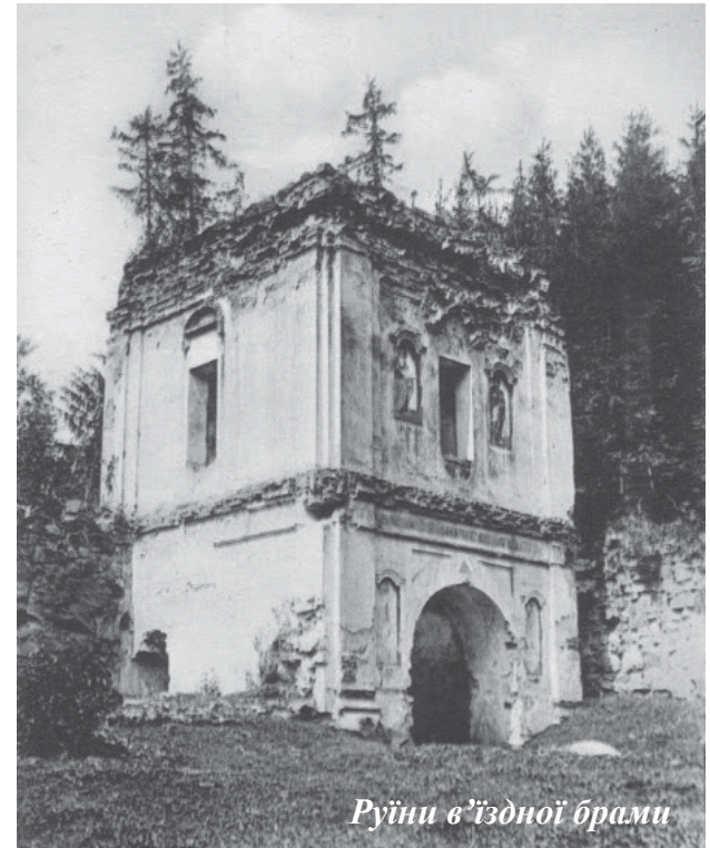
Руїни в'їзної брами

Дуже багато видатних осіб української історії пов'язані з Манявським скитом. Серед них гетьман Іван Виговський займає особливе місце, адже згідно зі заповітом прах гетьмана покоїться у скиті. Цей факт засвідчують такі вчені як