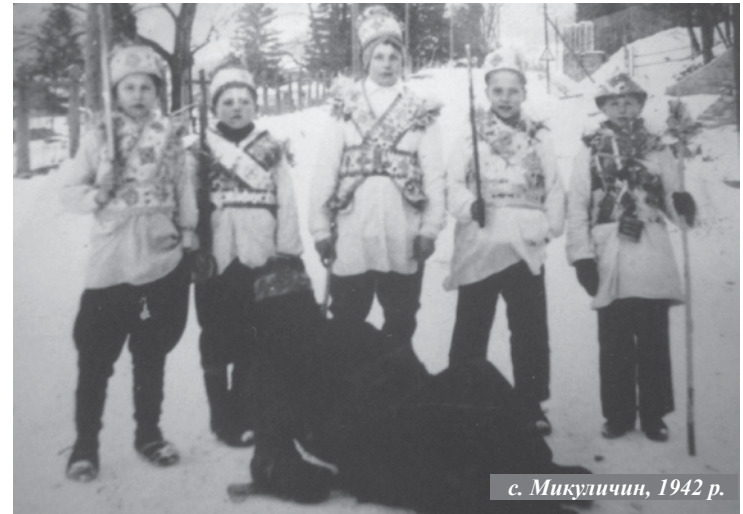
с. Микуличин, 1942 р.