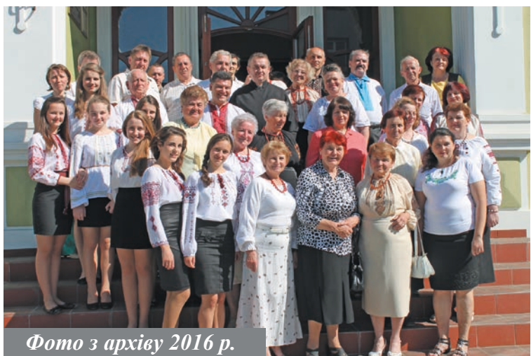
Фото з архіву 2016 р.