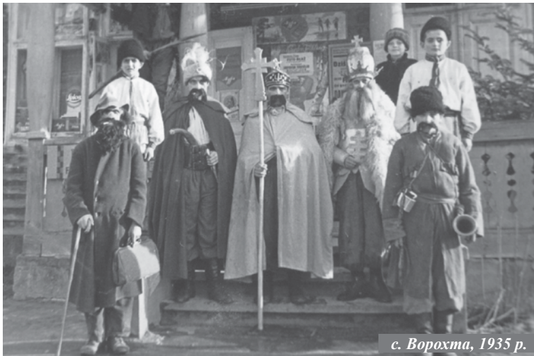
с. Ворохта, 1935 р.