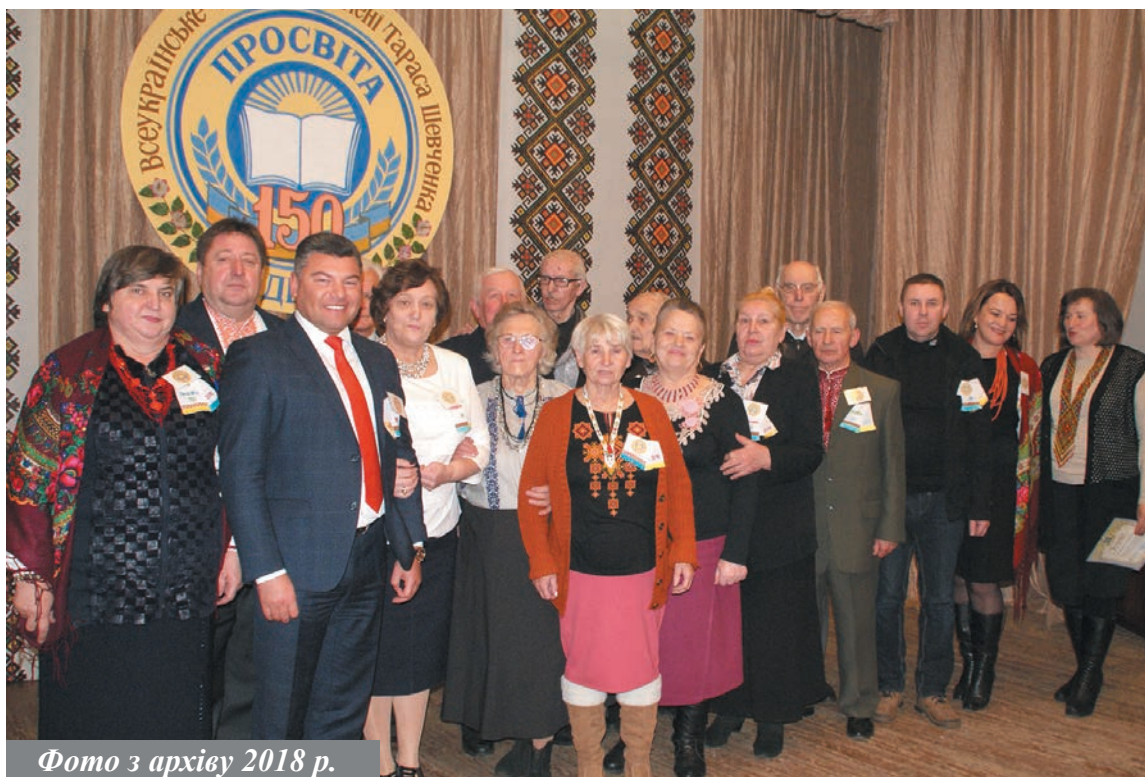
Фото з архіву 2018 р.

Вітаю нас усіх зі світлим святом Богоявлення і Хрещення Господнього! Нехай Божа благодать зійде на кожную родину, на Україну. Нехай свята вода змиє всі негаразди і прикрощі; очистить душу і тіло від усілякої скверни. Опустимо на дно ополонки всі свої печалі і зі світлою надією, вільною душею, міцною вірою і щирою любов'ю продовжимо від сьогодні свій шлях, наповнюючи світ довкола і свій внутрішній світ світлою радістю, добром, співчуттям та готовністю підтримувати один одного, допомагати один одному, тим, хто поруч і тим, хто цього потребує найбільше. Бо насправді не існує таких ситуацій, з якими неможливо було б впоратися разом. Разом виборемо Волю. Разом здобудемо Долю! Бажаю нам міцні і згуртованості. Доброго здоров'я, любові та благополуччя нам і нашим родинам. Христос ся хреще! В ріці Йордані!