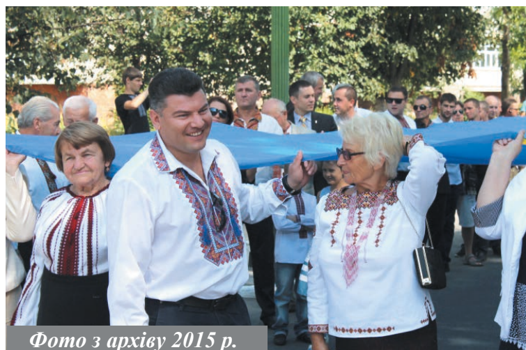
Фото з архіву 2015 р.

– Так, дійсно. Будучи депутатом міської ради, я чимало зусиль доклав, в тому числі, і до відродження нашої Надвірнянської міської Просвіти. На той час, зрештою, як і сьогодні, там працювали дійсно віддані цій сподвижницькій справі люди: Ганна Мохнач, Олександра Волинська, Любов Кипещук, Адрі-