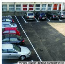
Parcare interior - Spitalul municipal Onești

Odată cu preluarea instituției de sănătate publică de către Consiliul Local Onești, s-a hotărât realizarea unor lucrări de modernizarea a spațiilor destinate parcărilor interioare și exterioare Spitalului municipal, în scopul descongestionării traficului din zonă.