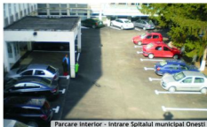
Parcare Interior - intrare Spitalul municipal Onești

Serviciul Tehnic-Gospodărie, Sing. Rotaru Monica