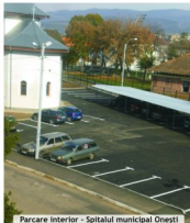
Parcare Interior - Spitalul municipal Onești

Este o plăcere să privești noua înfățișare a zonei, curată, aerisită și totodată foarte utilă, cu care se mândresc și pe care o merită toți oneștenii.