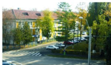
Parcare Căminul Colegiului „Nadia Comăneci”