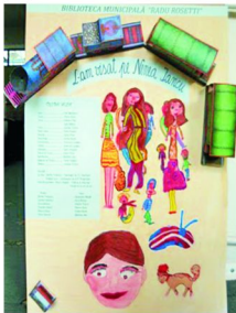
Afiș Trupa Alfa