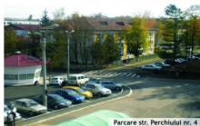
Parcare str. Perchiului nr. 4