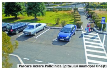
Parcare Intrare Policlinica Spitalului municipal Onești