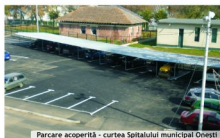
Parcare acoperită - curtea Spitalului municipal Onești