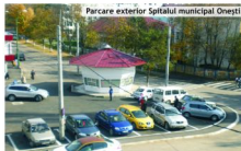
Parcare exterior Spitalul municipal Onești