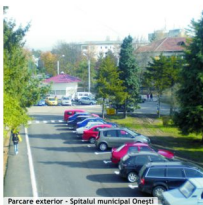
Parcare exterior - Spitalul municipal Onești