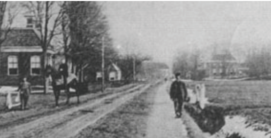
Afbeeldingen voorzijde Rechts: Nederlands Hervormde Kerk Links: Wensenkaart

De gemeente Oldambt heeft de ambitie dorpsvisies te gebruiken als basis van haar beleid de komende jaren. Het bestuur van de gemeente ziet vele goede initiatieven in de gemeente. Deze brochure is opgesteld ten behoeve van de dorpsvisie van Nieuw Beerta.