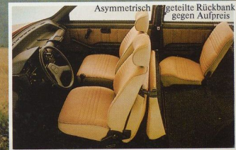
Asymmetrisch geteilte Rückbank gegen Aufpreis

Uno 60 Super und Diesel Super: Gürtel-Breitreifen 155/70 SR 13 · Scheibenbremsen vorne, Trommelbremsen hinten · Unterdruck-Bremskraftverstärker · Bremskraftregler für die Hinterräder · Drehstrom-Lichtmaschine · 2 Rückfahrleuchten · 3 Scheibenwischergeschwindigkeiten · Verbundglas-Windschutzscheibe · Athermische Scheiben · Heizbare Heckscheibe · Heckscheibenwischer/-wascher · Kühlwasser-Fernthermometer · Warnleuchten für Öldruck, Handbremse · Zeituhr · Stoßfänger Kunststoff, stoßabsorbierend · Kindersicherungen an hinteren Türen · Heizungs-/Lüftungsfächer, Bedienungshebel beleuchtet · Ablagefächer an Fahrertür/Beifahrertür · Kopfstützen vorne · Automatische Sicherheitsgurte