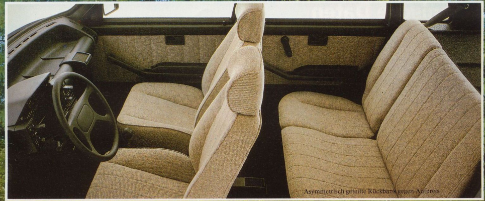
Asymmetrisch geteilte Rückbank gegen Aufpreis

Strömungsgünstige Karosserie (cW-Wert nur 0,33!) und das serienmäßige Fünfganggetriebe tun ein übriges, um das Fahren im Uno 70 SL nicht nur gepflegt und vital, sondern auch sparsam zu gestalten. Ein echtes Spitzenmodell in der internationalen Kompaktklasse!