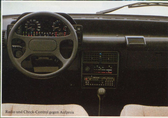
Radio und Check-Control gegen Aufpreis

Im Zeichen der Maßnahmen zur Senkung der Verbrauchswerte wurde der Kühlergrill mit einer besonderen Abdichtung versehen und der 1300-ccm-Motor auf 66 PS Leistungsstärke ausgelegt. Die strömungsgünstige Karosserie (cW-Wert nur 0,33!) und das serienmäßige Fünfganggetriebe tun ein übriges, um das Fahren im Uno 70 SL nicht nur gepflegt und vital, sondern auch sparsam zu gestalten. Ein echtes Spitzenmodell in der internationalen Kompaktklasse!