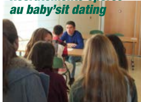
Pour sa 3 e édition, le Baby'sit Dating a de nouveau rempli sa mission : mettre en contact familles et baby-sitters pour de futures collaborations.