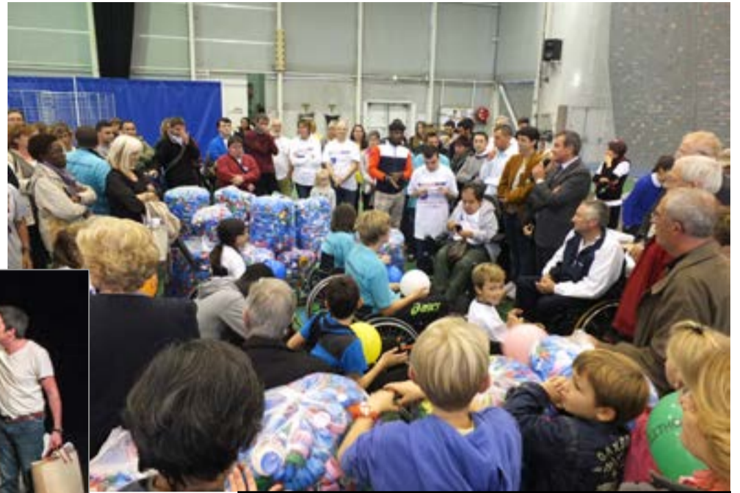
Le week-end de clôture des 11 et 12 octobre a rassemblé un public très nombreux autour d'animations proposées au gymnase Alain Colas et au centre P. Coubertin. Il faut dire que la Direction des Sports et le Centre Communal d'Action Sociale (CCAS) de la ville avaient concocté un programme extrêmement riche pour l'occasion.