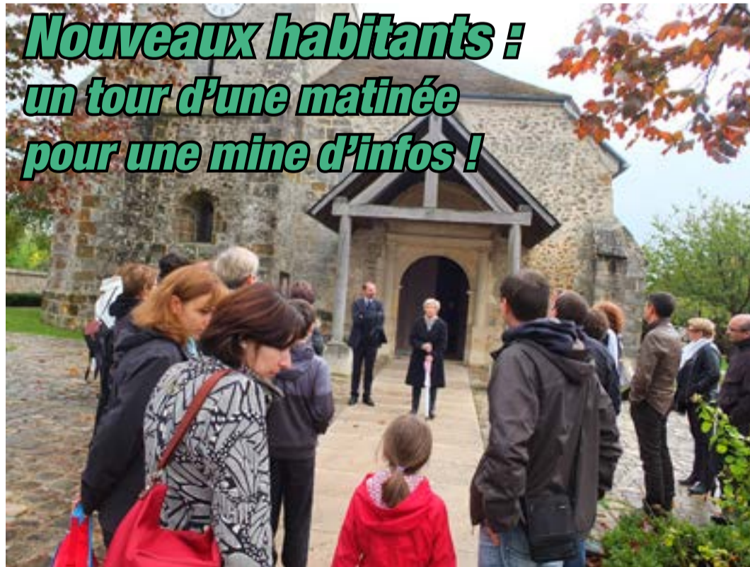
Le petit train et le car annuels ont transporté le groupe des nouveaux habitants de Montigny volontaires pour une balade informative aux quatre coins de la ville, sous la houlette du maire et président d'agglomération Michel Laugier, le samedi 11 octobre en matinée. Un moment d'échanges toujours sympathique et riche.