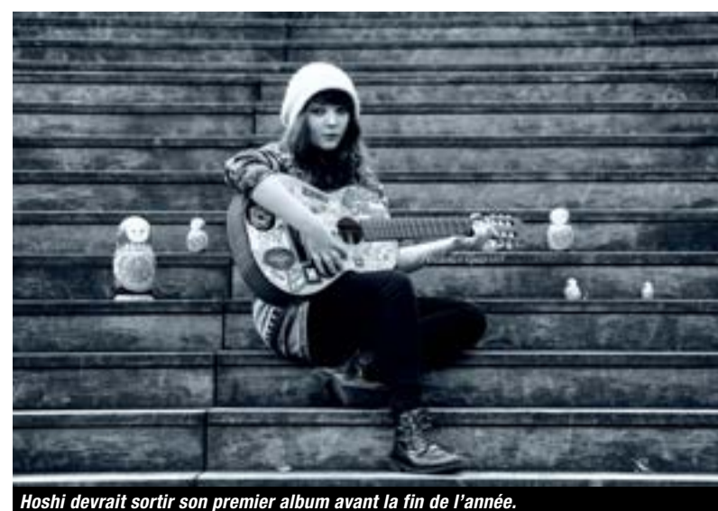
Hoshi devrait sortir son premier album avant la fin de l'année.