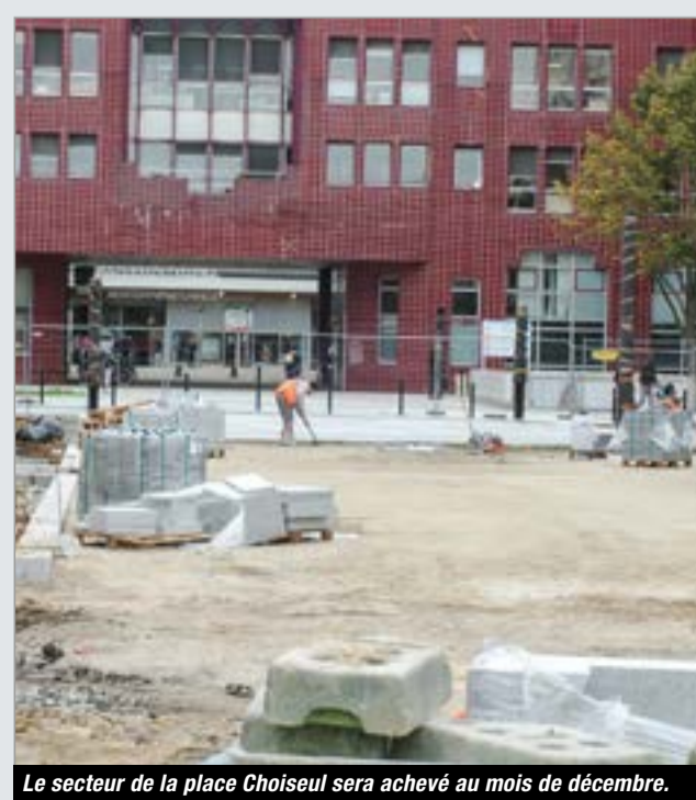
Le secteur de la place Choiseul sera achevé au mois de décembre.

01 39 30 30 50 (Direction Petite Enfance)