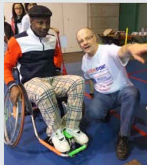
MC Solaar au final de la 11 e Semaine du Handicap