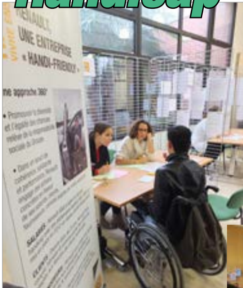
Mis sur pied à l'Hôtel de ville le 10 octobre par le service municipal Montigny Initiative Emploi (MIE) et CAP Emploi 78, l'opération Handi-Recrutement a parfaitement atteint son objectif. 109 candidats en situation de handicap ont en effet pu s'entretenir avec l'une ou plusieurs des 12 entreprises présentes pour l'occasion.