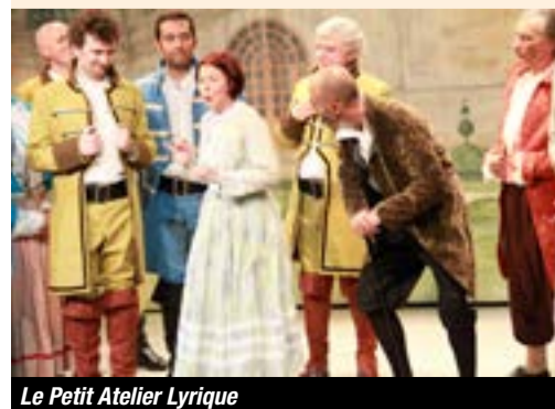
Le Petit Atelier Lyrique

RENSEIGNEMENTS 06 75 01 92 70. http://petitatelierlyrique.free.fr