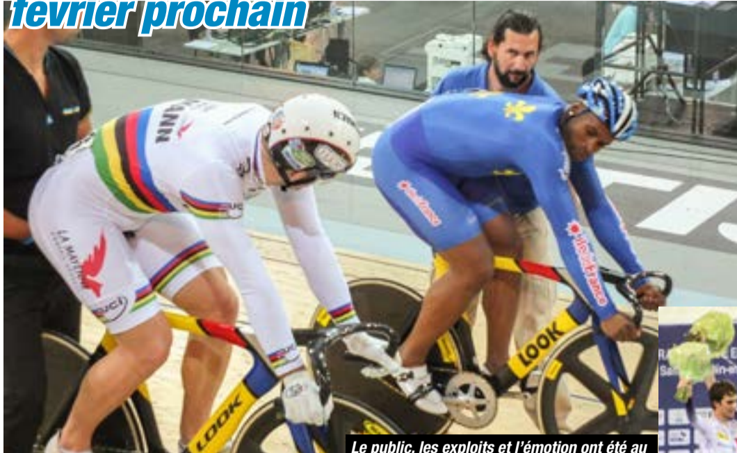
Le public, les exploits et l'émotion ont été au rendez-vous des championnats de France de cyclisme sur piste organisés du 2 au 5 octobre au vélodrome national de Saint-Quentin-en-Yvelines. Les chanceux présents pour l'occasion ont pu aisément imaginer ce qui les attendra lors des championnats du monde organisés à Montigny dans quelques mois (18 au 22 février 2015).