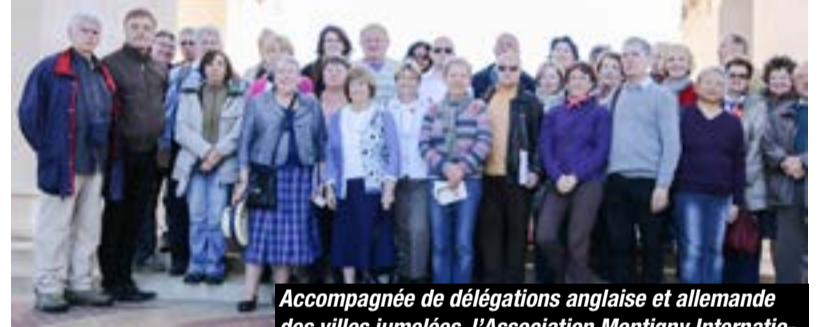
Accompagnée de délégations anglaise et allemande des villes jumelées, l'Association Montigny International s'est rendue les 18 et 19 octobre dans la Somme sur les hauts lieux de la Grande Guerre. Cent ans après le début de la Première guerre mondiale, ce voyage a permis à chacun de se remémorer cette page sombre de l'Histoire et le sacrifice de millions de soldats.