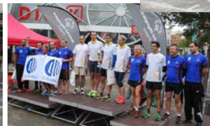
De nombreuses entreprises ont participé le 7 octobre à la 6 e édition de la course relais inter-entreprises organisée conjointement par l'association Spécial Olympics, le centre commercial Espace Saint-Quentin et la municipalité. Les participants ont joué des coudes pour cette manifestation qui aura encore été une magnifique réussite.