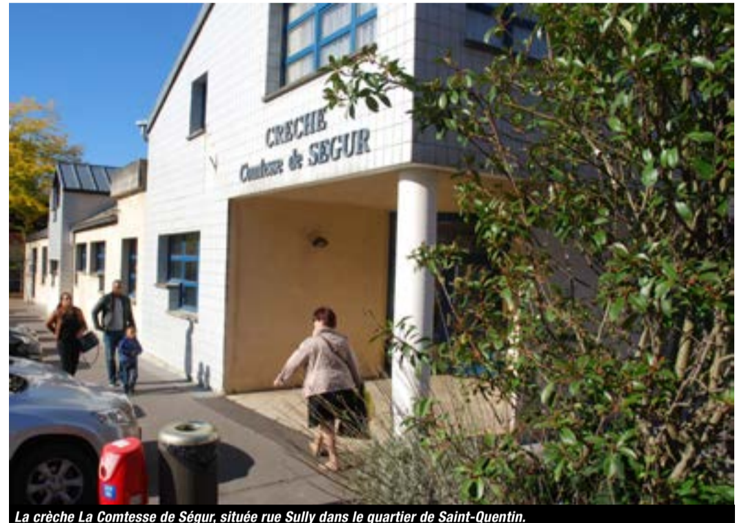
La crèche La Comtesse de Ségur, située rue Sully dans le quartier de Saint-Quentin.