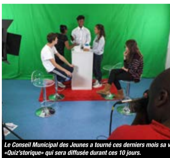
Le Conseil Municipal des Jeunes a tourné ces derniers mois sa vidéo «Quiz'istorique» qui sera diffusée durant ces 10 jours.

Ce programme commémoratif a déjà débuté avec l'organisation par l'Association Montigny internationale (AMI) d'un voyage dans la Somme les 18 et 19 octobre dernier sur les hauts-lieux du front de la Grande Guerre (voir p. 16). Mais durant 12 jours, de nombreux temps forts seront à ne surtout pas rater (voir programme ci-contre). Ce sera notamment le cas pour l'inauguration de la grande exposition