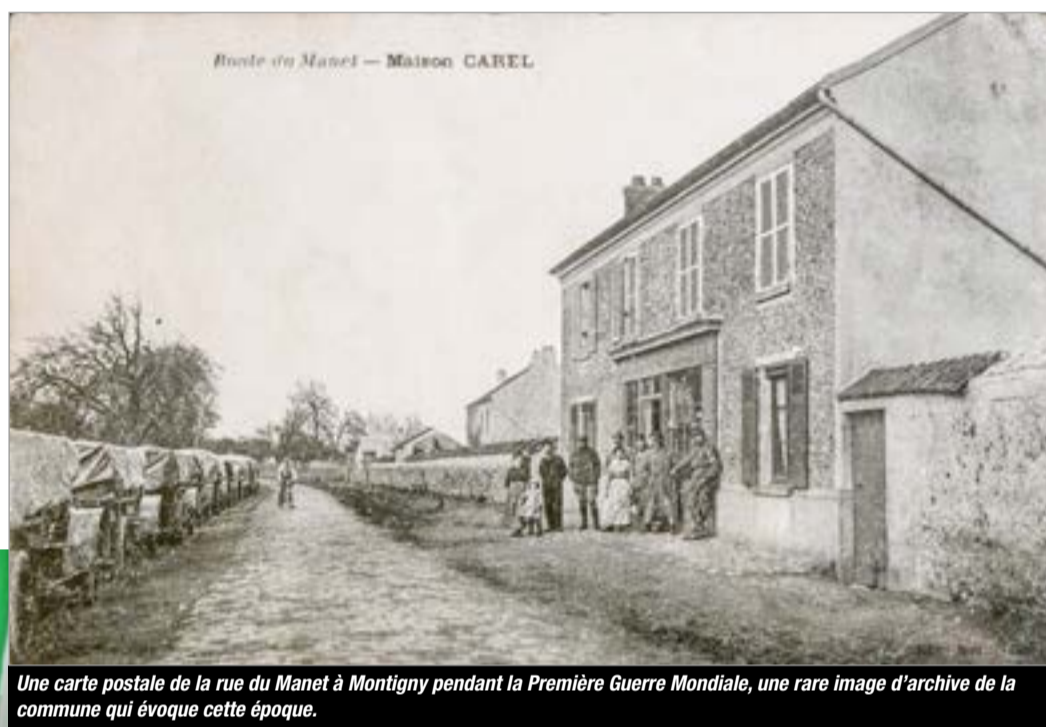
Une carte postale de la rue du Manet à Montigny pendant la Première Guerre Mondiale, une rare image d'archive de la commune qui évoque cette époque.

programmée le 8 novembre à 11h30 au cours de laquelle quelques surprises vous attendront. La cérémonie du 11 novembre en présence des délégations de nos villes jumelles et des 170 élèves des écoles de la ville devrait également être un moment fort (voir p. 5), tout comme la conférence du 8 novembre à la salle Gauguin, le concert du 8 novembre à la ferme du Manet (p. 13) ou la soirée du 10 novembre à la salle J. Brel.