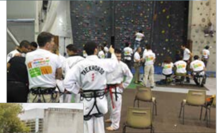
Le mur d'escalade du centre Coubertin a été investi le 12 par les associations CIEL et Handigrimpe, ces dernières permettant aux personnes le souhaitant d'escalader avec un handicap virtuel (yeux bandés, main attachée...).