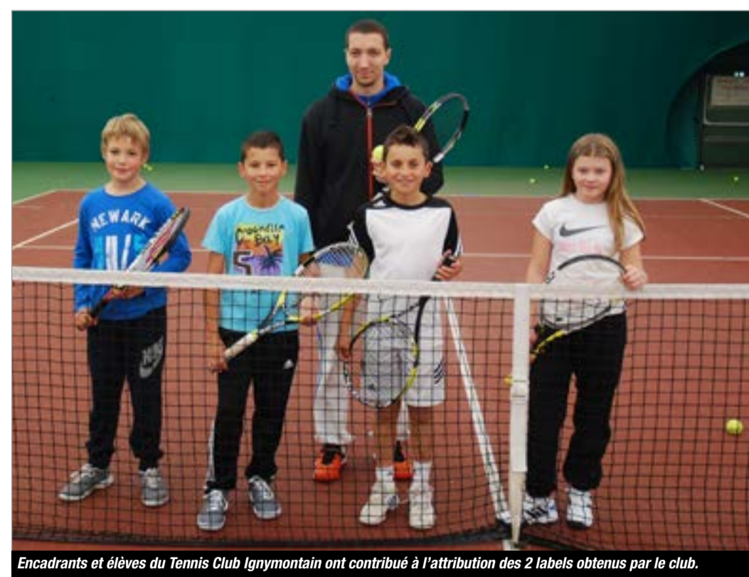
Encadrants et élèves du Tennis Club Ignymontain ont contribué à l'attribution des 2 labels obtenus par le club.