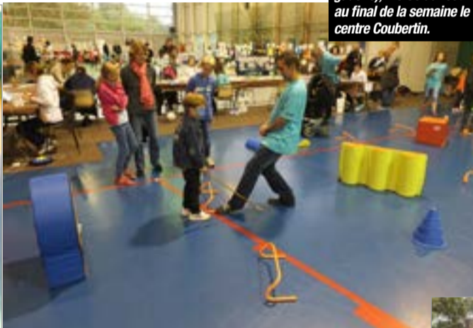
Pour la clôture de cette 11 e semaine du Handicap, l'association Médias Handicaps proposait à nouveau au public de participer à son triathlon de l'Espérance composé de sept plusieurs défis. Pour l'occasion, son président Sébastien Proyart a eu la joie de voir MC Solaar apporter son soutien à la manifestation.