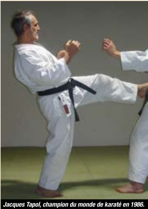
Jacques Tapol, champion du monde de karaté en 1986.