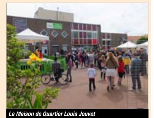
La Maison de Quartier Louis Jouvét