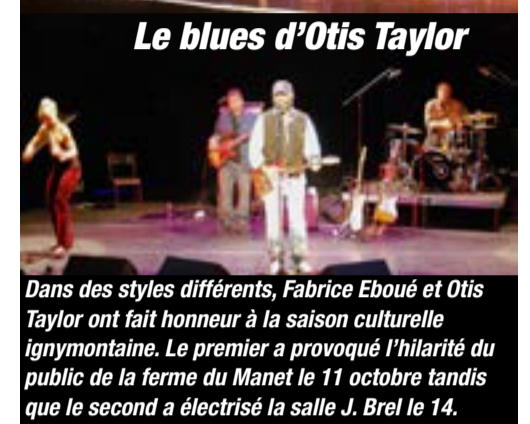
Dans des styles différents, Fabrice Eboué et Otis Taylor ont fait honneur à la saison culturelle ignymontaine. Le premier a provoqué l'hilarité du public de la ferme du Manet le 11 octobre tandis que le second a électrisé la salle J. Brel le 14.