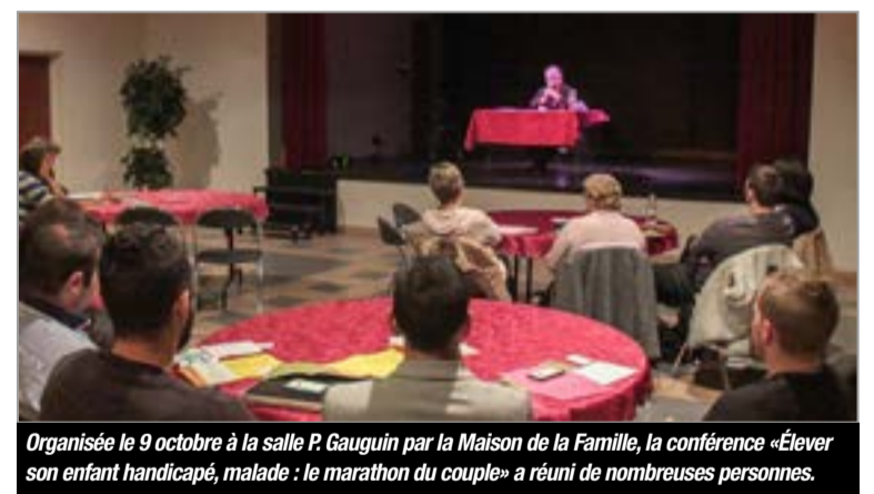
Organisée le 9 octobre à la salle P. Gauvain par la Maison de la Famille, la conférence «Élever son enfant handicapé, malade : le marathon du couple» a réuni de nombreuses personnes.