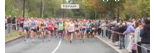
Pour sa 20 e édition, la manifestation sportive Parcourir Montigny a enregistré une belle affluence le 5 octobre dernier avec 661 participants.