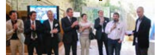
Plus de 40 exposants étaient présents à la ferme du Manet les 18 et 19 octobre pour la 12 e édition d'Art Manet. Celle-ci a permis de remettre 2000 euros à l'association de Guyancourt « Du fun pour tous » grâce aux bénéfices récoltés lors de l'édition 2013 de la manifestation.