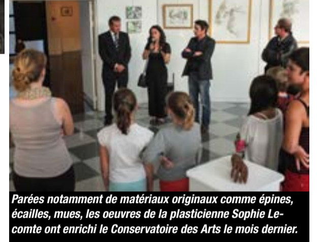
Parées notamment de matériaux originaux comme épines, écailles, mues, les œuvres de la plasticienne Sophie Lecomte ont enrichi le Conservatoire des Arts le mois dernier.