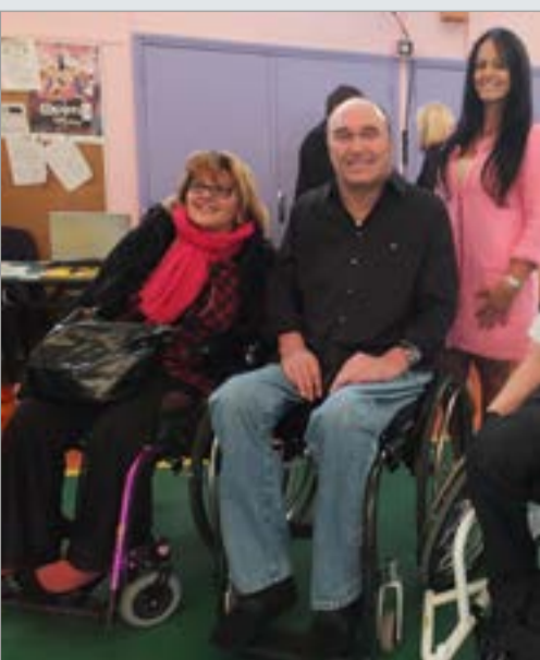
Philippe Streiff à la journée hand au gymnase A. Colas

MC Solaar le chanteur et Philippe Streiff le pilote sont venus apporter leur soutien à la cause du handicap en se déplaçant sur des événements organisés lors de la 11 e Semaine du Handicap (voir page