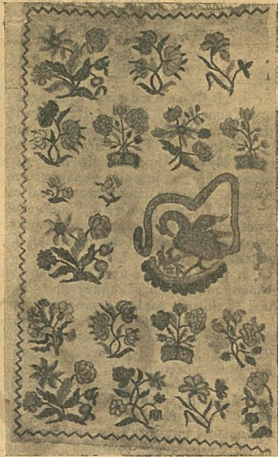
5. Килим, в рослинну композицію якого уведено пелікана.

Заснований в грудні року 1921, Союз-Кустар за такий, порівнююче короткий термін, вже об'єднав навколо себе 140