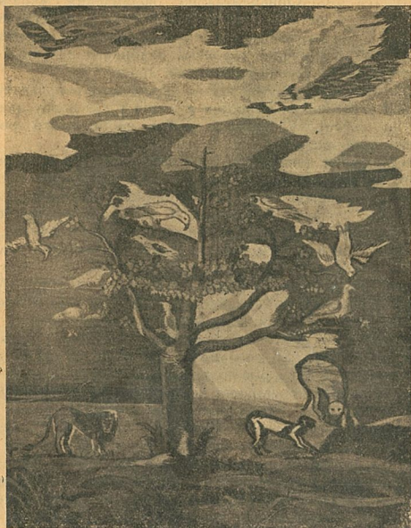
4. Килим гобеленового типу.

Питання тла є, коли б не головним: од нього залежить і підбор малюнка та його розклад, воно творить і загальну гармонію орнаментального оформлення килима.