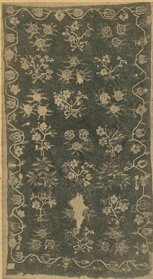
3. Килим панського типу з рослинним орнаментом.