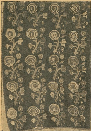
1. Килим з стилізованим рослинним орнаментом.

поспіль чорним, іноді оздоблювався поперешніми кольоровими смугами; вживався, переважно, для постілі. Килим,— робився з фарбованої вовняної пряжі на звичайнім верстаті з 4-ма підніжками; орнамент на килимах укладався, переважно с геометричних елементів; уживався для покриття лав, скринь та столів. Ковер— килим настінний, робився з фарбованої вовняної пряжі на особливому станку— кроснах, з різнобарвним та складним орнаментальним оформленням; уживався для стінних прикрас. Коц— килим із високим стриженим ворсом. Як і килими настінні, коці робилися з одірної фарбованої вовняної пряжі; уживалися для стінних прикрас.