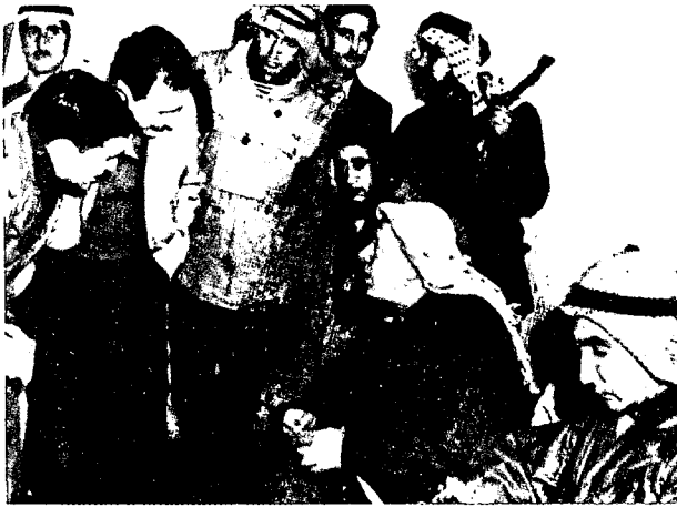
אל קאוקג'י בשיחה עם עתונאים