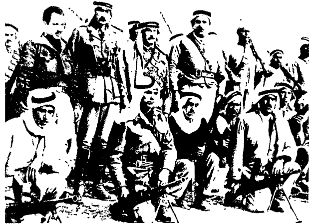
כנופיה ערבית בהרי ירושלים

כוח גדודי, בפיקוד מהדי צאלח, מי שפקד במשמר-העמק על גדוד „קאדסיה“, שהותש או ופורק. משימתו הראשונה של „כוח מהדי“ היתה לאבטח את שיגורו של גדוד „אג'ינאדין“ ליפו, ואחר-כך התמקם בסביבות רמאללה. ב-6 במאי העבירו קאוקג'י לרכס איילון („רכס התותחים“) 42 . כוח זה ערך התקפות חוזרות ונישנות על משלטי „הראל“, מצפון לכביש, בעת הקרבות הקשים לכיבוש בית-מחסיר שמדרום לכביש. כדי להמשיך בתנופת ההתקפות, שנמשכו מה-10 בחודש עד בוקר ה-14, תיגבר קאוקג'י את מהדי בגדוד נוסף 43 . התקפות אלה לא הצילו את בית-מחסיר, אולם מנעו את פתיחת הכביש, תוך גרימת אבידות לשריוניות של „הראל“ ושל „גבעתי“ שהיו פגיעות לתותחי 37 מ"מ של שריוניות „צבא ההצלה“ 44 . מקורותינו מעידים על עוצמת ההתקפות האלה ועל קשיי ההתגוננות במשלטים החשופים.