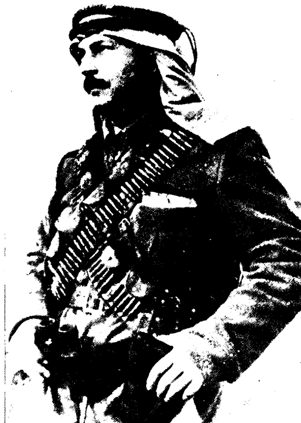
עבד אל קאדר אל חוסייני

לסיכום, על אף המאמץ לרכז כוח יהודי גדול ללא תקדים, בהר ובשפלה, לא השתתפו בסופו של דבר אלא כוחות פלוגתיים מדולדלים ותשושים בקרבות על הקסטל החיוני. למשך 16 שעות, משעה 081400 עד שעה 090600, אף נשמט הקסטל מידיהם. בנסיבות אלה, לא היו הערבים זקוקים לתוספת-כוח גדולה, כדי להטות את הכף לצדם. אך כובשי הקסטל הערבים נטשוהו, ולא יזמו התקפות נוספות. 29