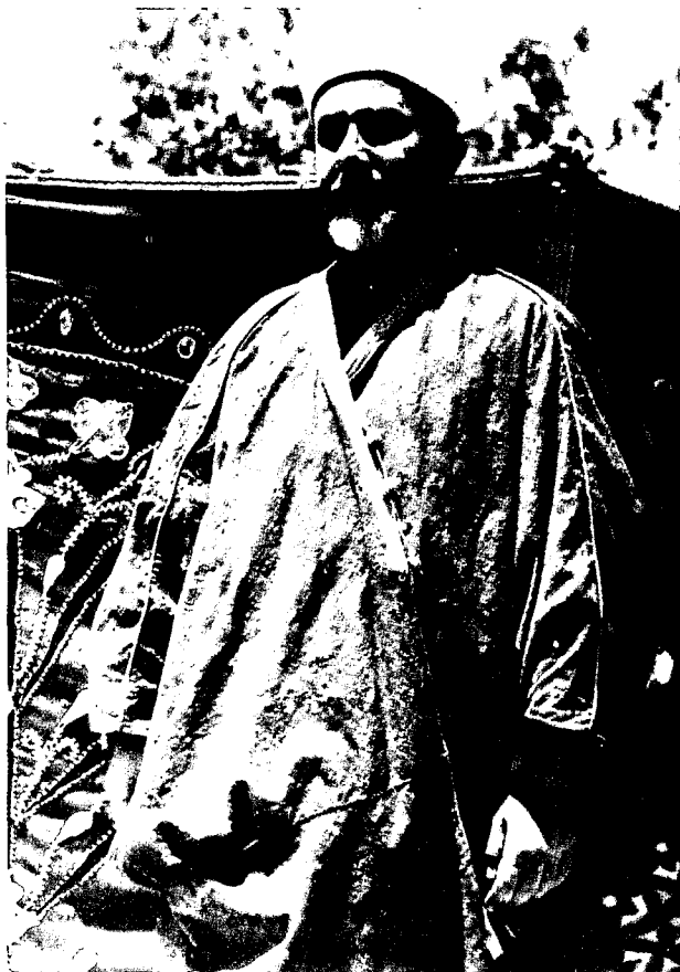
חג' אמין אל חוסייני

אבידן, גיוסם וריכוזם של נהגים על רכבם לשיירות אספקה, תפיסת הקסטל בליל 2—3 באפריל, פשיטה הרסנית על מפקדת חסן סלאמה ליד רמלה בליל 4—5 בחודש, קרבות בשפלה ובהר ששיאם במאבק העקשני על הקסטל.