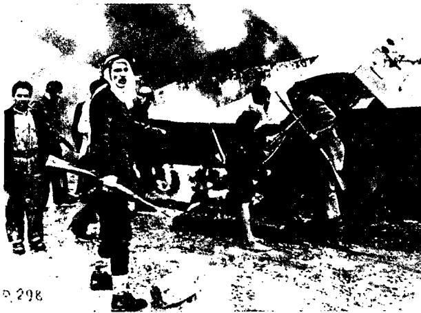
התקפה על שיירה יהודית

קאוקג'י אמר להתחכם לבריטים, ופתח בהפגזה נוספת בערב ה-6 בחודש, אך שוב נכשלה ההתקפה. למחרת הגיע המג"ד הבריטי בראש כוח, ושוב הסדיר הפוגה ל-24 שעות. הפעם פונו הנשים והילדים מהמשק. למחרת היום, ב-8 בחודש, התנהל מו"מ להארכת ההפוגה. קאוקג'י ראה עתה תועלת בהמשכתה, אף כי היהודים דחו את תנאיו, כי הגיעו אליו קריאות נואשות מירושלים להצילה ולסייע לכבוש מידי היהודים את הקסטל. בבוקר החליט לשגר כוח עם סוללת תותחים לחזית ירושלים בליל ה-8-9. באותו לילה הופתעו כוחותיו מהתקפה על אגפו: הגדוד הראשון של הפלמ"ח רוכז בינתים בג'וערה, ויצא לפעולה. בלילה תקפו היהודים ונאחזו בכפרים ובמשלטים, וביום התגוננו ונסוגו מפני התקפות נואשות של הערבים. כבר בבוקר ה-10 באפריל הורה קאוקג'י להחזיר את התותחים