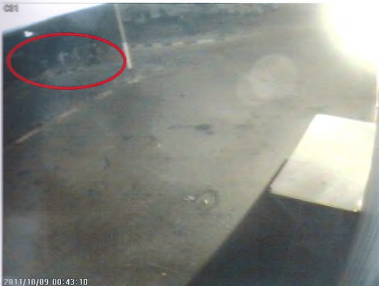
Кадр №5 – появление группы из 7 человек

Они задерживаются, стоят, не принимая каких-либо активных действий. По временному коду 00:43:47 к первой группе присоединяются еще двое людей — они появляются в кадре справа. В момент 00:45:15 между членами группы начинается активное взаимодействие, физический контакт, передвижения, люди толкают друг друга, удерживают, валят на землю. Очевидно происходит драка. В итоге – на момент 00:46:51 один из ее участников остается лежать на асфальте неподвижно. На видео этот человек имеет серый силуэт, то есть и верхняя часть одежды, и брюки на экране выглядят серыми. В представленном эпизоде он принимал активное участие в драке. Первый раз он упал в момент 00:46:17, но затем поднялся и продолжал активно двигаться.