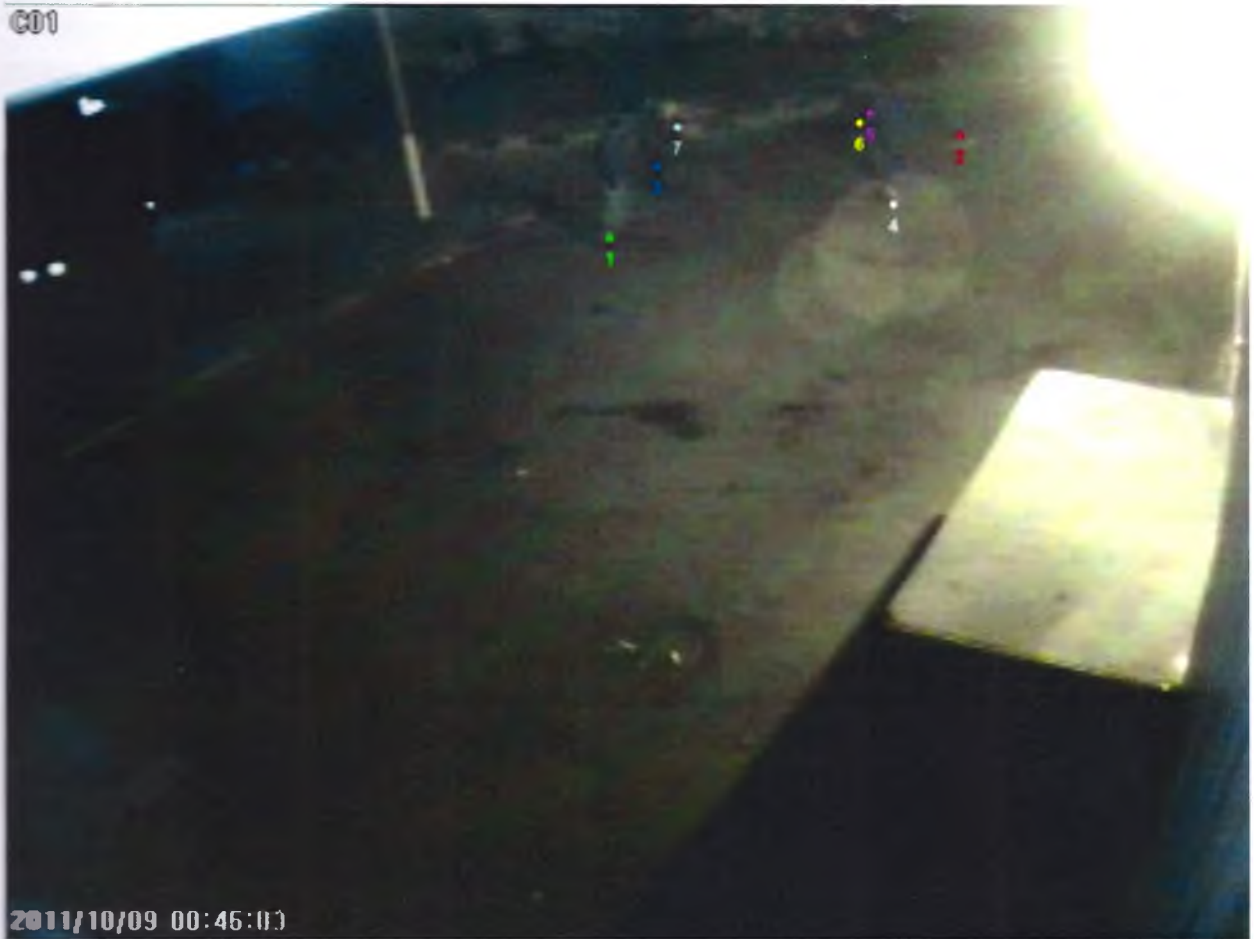
Кадр №3 – объекты помеченные номерами.