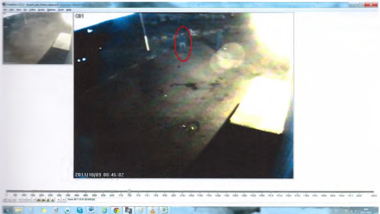
Кадр №4 – объект помечен маркером.