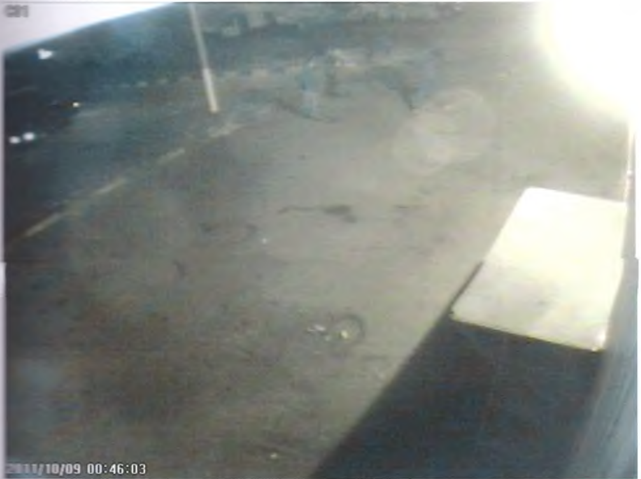
Кадр №1 – изображение видео после конвертации.