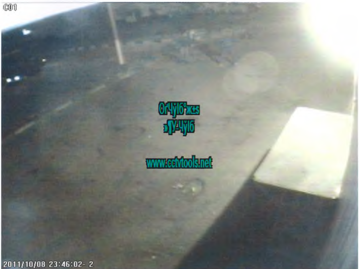
Кадр №9 – мужчина, который больше всего схож с человеком, одетым с светлые джинсы, черную толстовку.

Несмотря на частичную засветку в правой верхней части кадра уличным фонарем, а также низкий контраст изображения, видеозапись, по мнению членов группы, пригодна для идентификации зафиксированных на ней лиц по тону одежды. Группа исследователей единодушно считает, что из всех фигур в эпизоде наиболее схож с мужчиной, снятым на предоставленной адвокатом Яковлевым А.Ю. фотографии, человек, помеченный цифрой 1. Тон брюк на видео соответствует светлым джинсам на фото, в некоторых ракурсах - видны характерная эмблема на груди и полоса на рукаве толстовки. Обувь у этого человека темного цвета, тон светлых брюк в некоторых ракурсах неоднороден, скорее всего на брюках имеются накладные карманы.