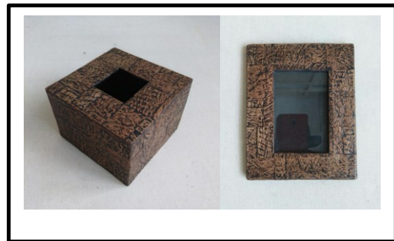
Gambar 4. Produk kerajinan dari kulit kayu Jomok yang direkatkan dengan perekat dari getah blendok .

Tabel 2 menunjukkan nilai delaminasi dari perekat blendok yang diaplikasikan pada bahan kulit kayu Jomok-tripleks. Nilai delaminasi perekat sintetis yang digunakan sebagai pembanding adalah 0%. Pada penelitian ini nilai delaminasi dicapai 0% pada semua perekat hasil penelitian, menunjukkan tidak adanya kerusakan pada spesimen uji setelah mengalami uji delaminasi.