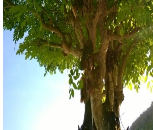
Gambar 1. Pohon kudo ( Lannea coromandelica )

2011). Getah blendok yang keluar dari pohon kudo ini belum banyak dimanfaatkan. Sebagian masyarakat memanfaatkannya sebagai lem namun masih terbatas karena kesulitan dalam penanganannya.