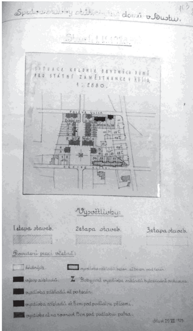
Рис. 1 План «Масарикової колонії»

збудована згодом (у 1933 році) школа. Із протилежного боку, у південно-західній частині, передбачалось влаштування громадського простору у вигляді благоустроєного та озелененого скверу.