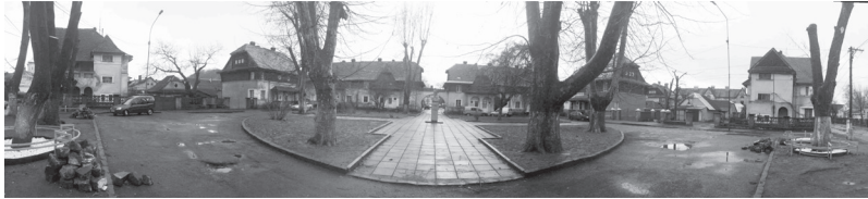
Рис. 3 Перша частина будівництва, що виходила на чотирикутний майдан 1924 рік. Сучасний стан.

Будівництво планувалось здійснювати в декілька етапів. На першому етапі розпочалося будівництво будинків із терасами, які виходять на чотирикутний майдан (рис. 3), пізніше – решта об'єктів північній та південній частині.