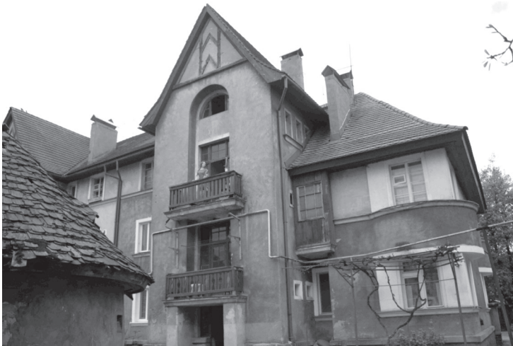
Рис. 2 Хуст. Житловий ...-квартирний будинок на території «Масарикової колонії». 1925 рік. Сучасний стан.

сходових кліток, орнаментальних мотивах та композиціях плитки на підлогах.