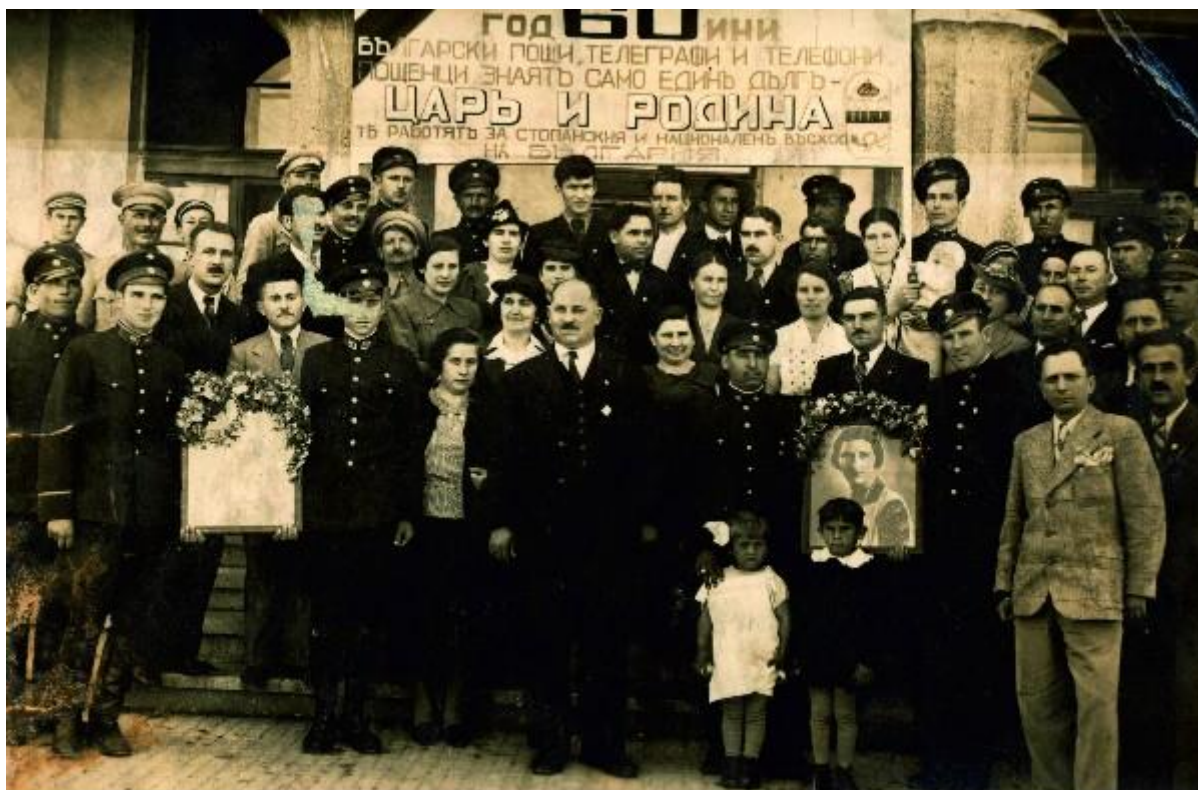
ДА-Кърджали, честване на 60 години от създаването на българските съобщения (1879-1939). Кърджали, 1939 г.

В рамките на петото издание на Инициативата „Мултикултурният град“ утре в 13.00 ч. в салона на Областната пощенска станция може да се види първата художествена експозиция с писма на кърджалийци, с печати и марки от миналия век, съхранявани в частни семейни колекции.