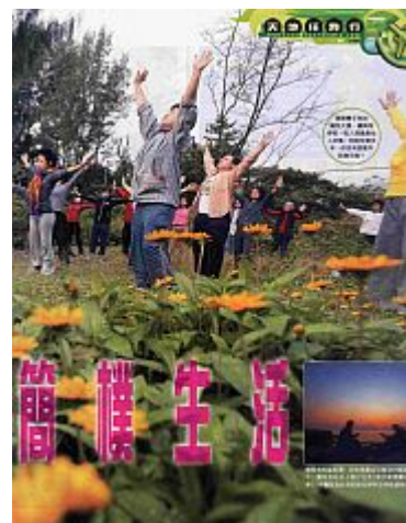
躲在這片隱世淨土，讓人願意放下豐盛，重過簡樸生活。

我們一行三十多人選擇海路前往，從落船踏足島上那一刻，感覺自己像走入了荒蕪之地，沿着沙灘旁的小路步向青年旅舍營地，路上只有我和各參加者，完全不見其他人，數幢度假屋以及一幢建得頗華麗的私人別墅也無人看管，最近的士多，也要步行四十五分鐘才找到，想買食物不容易。