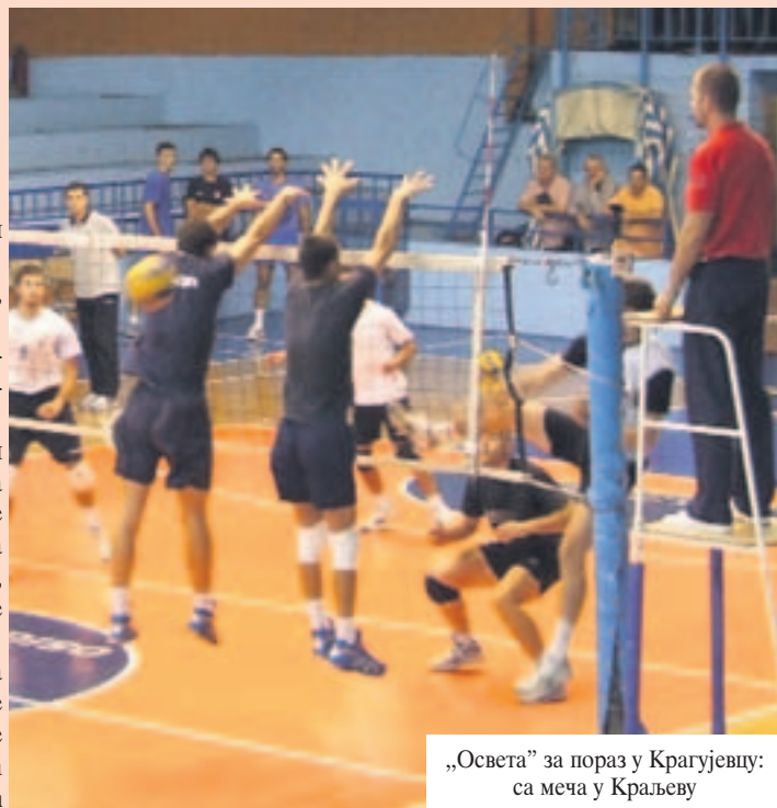
„Освета” за пораз у Крагујевцу: са меча у Краљеву