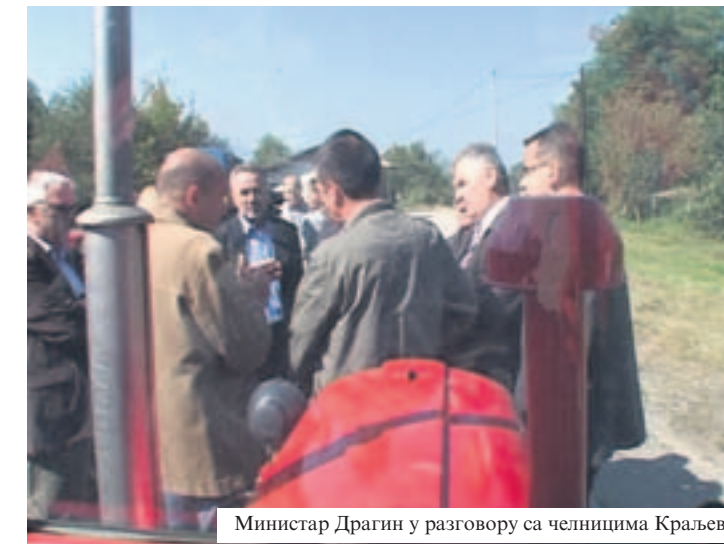
Министар Драгин у разговору са челницима Краљева

Село Стубал махом сточарски крај. Одавде живаљ није одлазио у оној мери какав тренд бележе остала подручја. Улагања у производњу су ипак сходно могућностима, тако да ни резултат често не могу бити репрезент. Оно што је дефицит на селу јесте и механизација, чији је век трајања давно прошао. Ако имате нову механизацију, онда вам је технолошки поступак далеко јефтинији, а агротехника коју радите је далеко исплативија, истакао је Драгин и напоменуо да се у последњих шест година пољопривредна механизација у Србији „значајно подмладила“.