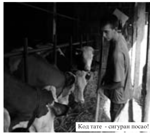
Код тате - сигуран посао!