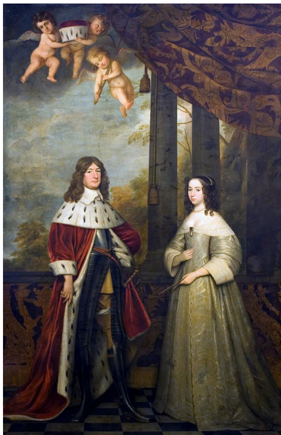
Gerard van Honthorst (1590-1656), Portret van Friedrich Wilhelm, keurvorst van Brandenburg (1620-1688) en zijn echtgenote Louisa Henriëtte van Oranje-Nassau (1627-1667) , 1647, olieverf op doek, 302 x 194 cm, Amsterdam: Rijksmuseum.

In de loop van de zeventiende eeuw sloot de gezeten boerenstand zich steeds meer aan bij de protestantse gemeente. Voor wie economische belangen gewicht in de schaal legden, leek het riskant zich bij doop en huwelijk niet bij de gereformeerde predikant te laten zien. Bij bijvoorbeeld erfeniskwesties moest er een bewijs zijn van de wettigheid van de aanspraken. Als een huwelijk niet officieel door de predikant gesloten was, liep men het risico, dat de wettigheid ervan ontkend kon worden, zodat de kinderen uit zo'n huwelijk voor onwettig werden gehouden. Het ontbreken van een door de predikant afgegeven doopbewijs stond gelijk met het niet kunnen leveren van een wettige geboorte-acte.