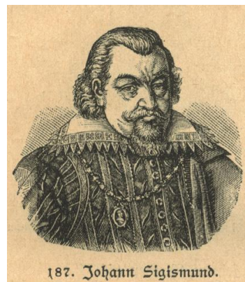
187. Johann Sigismund.