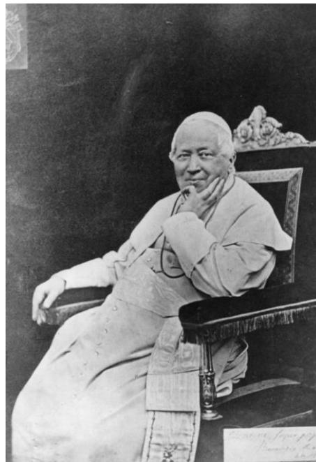
Paus Pius IX, omstreeks 1878.