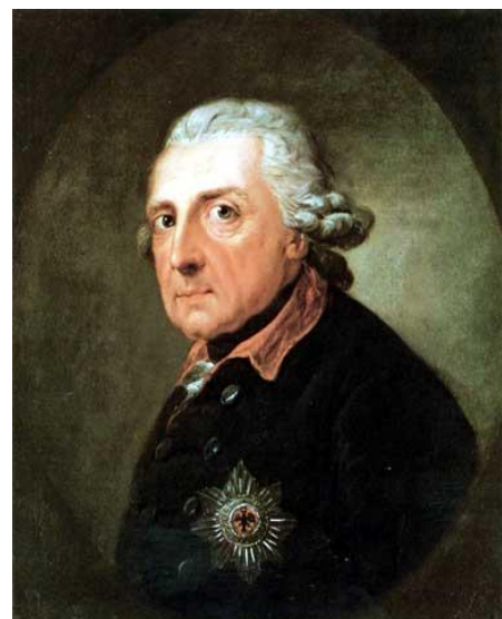
Frederik II (1712-1786)

Terwijl in de achttiende eeuw elders godsdienstoorlogen woedden, stonden in de Liemers rooms-katholieken en gereformeerden vrij tolerant tegenover elkaar. Dit was mede te danken aan koning Frederik II (1712-1786) van Pruisen. Deze wenste geen enkele groep te bevoorrechten. 'Ik kies geen partij tussen Rome (machtscentrum van de rooms-katholieken) en Genève (machtscentrum van de