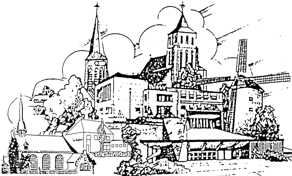
Van links naar rechts: Hervormde Kerk, Gereformeerde Kerk 'De Hoeksteen', Sint Andreaskerk, gemeentehuis, Sint Martinuskerk, Maria Koninginkerk en Buitenmolen.