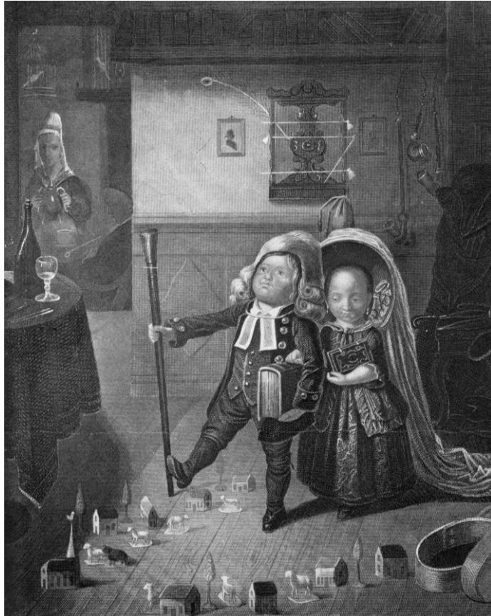
De kinderen van de dominee, omstreeks 1800.

Ds. Otto Gerhard Heldring (1762-1841) prees zich in 1810 gelukkig: ‘Het verdrag alhier is vreedzaam, dewijl over de bezittingen der verschillende kerkgenootschappen geen verschil hier is; als zijnde het bewezen eigendom van elke gemeente en bovendien een goede verdraagzaamheid hier plaats vindt dewijl de Protestantse en Roomse gelijke regten alhier heeft.’ Toen op 8 november 1817 de Reformatie uit 1517 zou worden herdacht, bood het ‘koor der Roomsche zangers’ ‘gulhartig’ aan om aan de viering mee te werken. Dit aanbod werd ‘vriendelijk aangenomen’, ‘tot een zeer algemeen genoegen’ zowel van de gemeente als van menig rooms-katholiek en van alle joden 3 die dit zeer aandachtig hadden gevolgd. Ds. Heldring benadrukte het belang van het zoeken naar eenheid van lutheranen en gereformeerden. Waar hij eens zo welgestemd was over de verhouding tot de rooms-