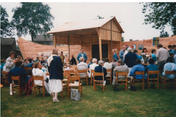
28 mei 2009.