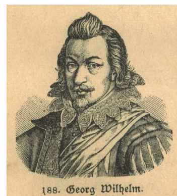
188. Georg Wilhelm.