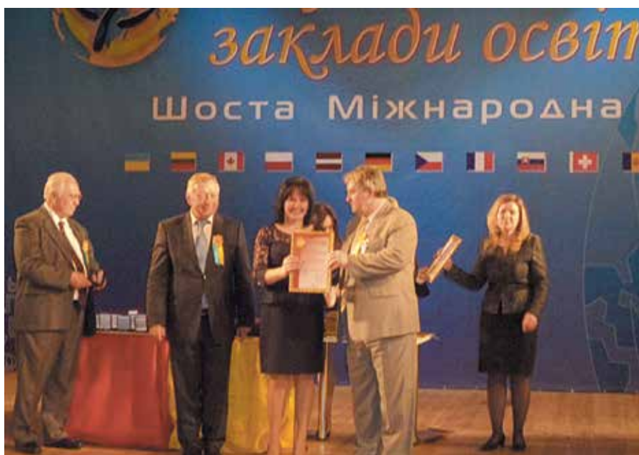
Міжнародна виставка «Сучасні заклади освіти 2015»

Традиційним у роботі закладу є проведення літньої польової екологічної практики для слухачів заочної школи