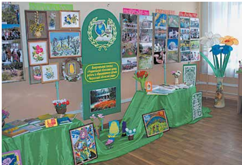
Обласна педагогічна виставка «Освіта Черкащини – 2015»

Протягом всіх цих років заклад гідно виконує місію методичного Центру з питань позакласної роботи з учнівською