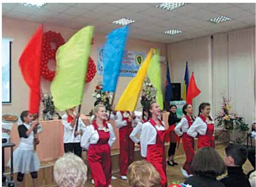
2012 рік. Святкування 85-річчя юннатівського руху на Луганщині (обласний Будинок природи)

На той період ( станом на 01.01.2014 року ) в Луганському ОЦЕНТУМ працювали 21 педагог ( включаючи сумісників ). Вищу освіту ( освітній рівень – «спеціаліст» ) мали всі педагоги Центру, з них магістрів – 3 особи, «Заслужений вчитель України» – 2 особи ( сумісники ). Всі основні педагогічні працівники мали нагороди та відзнаки Кабінету Міністрів України, Верховної Ради України, Міністерства освіти і науки України, обласної ради, облдержадміністрації, управління освіти