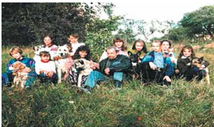
Вихованці гуртка «Юні кінологи»