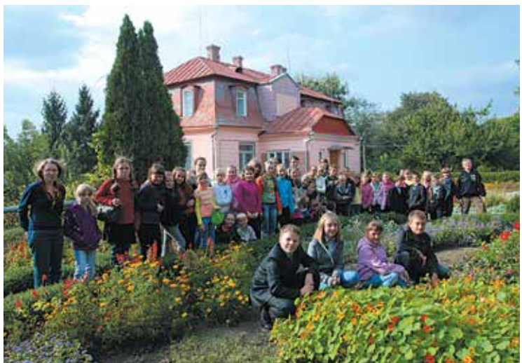
День відкритих дверей

Заняття гуртків проводяться у 16 кабінетах: куточок живої природи; кімнати лікарських рослин, біології та сільськогосподарського дослідництва, квітникарства, фітотельня, майстерні народних ремесел та бджолярства. У кабінеті педмайстерності проводяться семінари для курсантів, керівників гуртків, вчителів біології, заступників директора з виховної роботи. У кімнаті народознавства «Берегиня» зібрано старовинний український одяг та предмети народного вжитку, оформлено куточок бережливого ставлення до хліба.