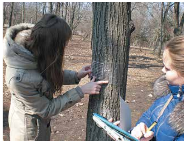
Слухачі гуртка «Юні науковці» проводять дослідження якості повітря м. Одеса за допомогою ліхеноіндикації.