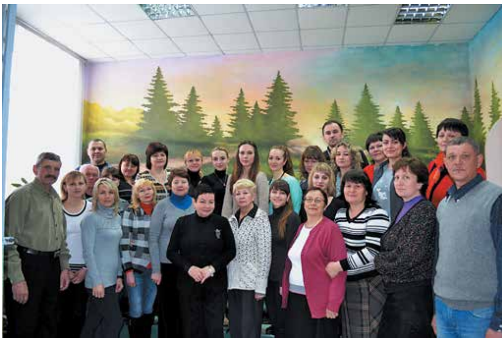
Коллектив Винницької обл. СЮН

Керівництво області орієнтується на європейську модель розвитку, активно долучається до інновацій, сміливо іде на експеримент, з виправданим оптимізмом мріє про доступну позашкільну освіту дітей в кожному куточку області.