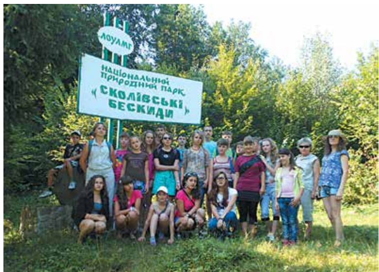
КЗ ЛОР «Львівський обласний центр еколого-натуралістичної творчості учнівської молоді»