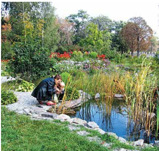
КЗ «Дитячий екологічний центр»

ДЕЦ – це участь в різноманітних природоохоронних конкурсах, акціях, проектах міського, обласного та