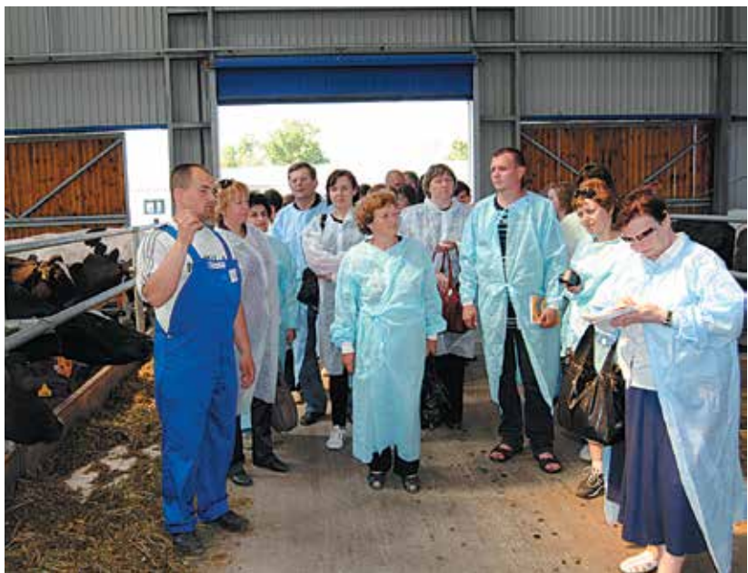
Всеукраїнський семінар з тваринництва

Вихованці Полтавського обласного еколого-натуралістичного центру є учасниками обласних та всеукраїнських природоохоронних заходів, де вони здобувають призові місця. Наші гуртківці – призери I та III Всеукраїнських