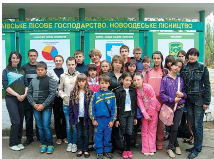
Районна екологічна експедиція

Поряд з природоохоронною роботою на станції поширюються форми екологічної освіти і виховання школярів: навчально-пізнавальні екологічні стежки, комплексні екологічні експедиції, школа молодого еколога.