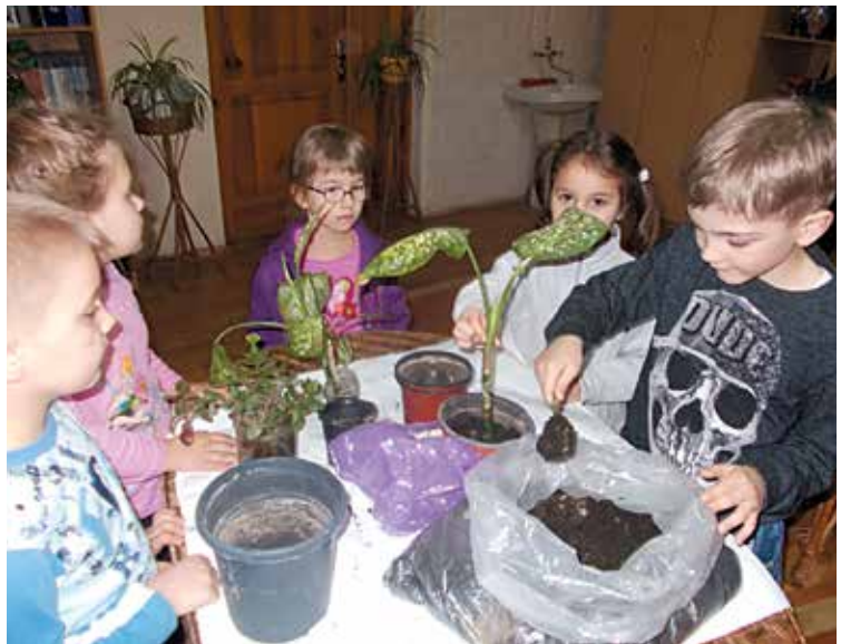
Перші кроки «Юних натуралістів» у квітникарство

ЗОЦЕНТУМ спрямовує роботу 42 учнівських наукових товариств, якими охоплено до 1 000 учнів. Співпраця ЗОЦЕНТУМ та Запорізького національного університету по залученню до