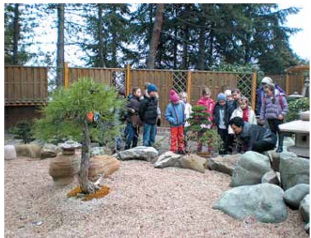
Практичні заняття весняної навчально-польової практики гуртка «Екологічний буквар «Веселка» в ботанічному саду.

У 1977 році на обласній станції юннатів з метою координації природоохоронної та дослідницької роботи старшокласників, цілеспрямованої допомоги їм