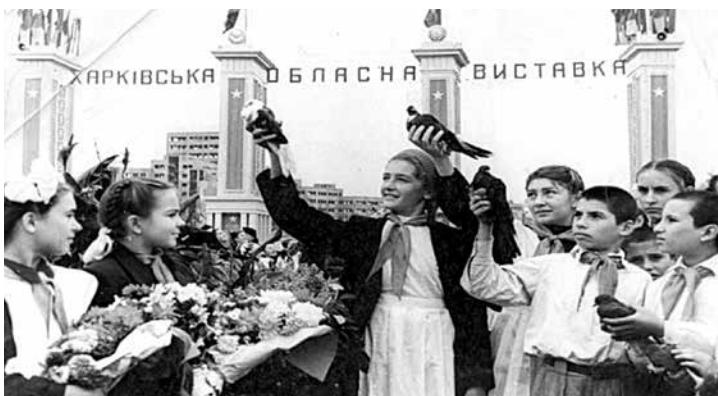
Юннати на Харківській обласній виставці

У 1976 році вперше в Україні в системі позашкільних навчальних закладів у відділі утворено ентомологічний