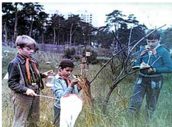
Робота в мікрозаказнику