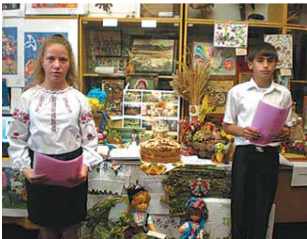
На щорічній обласній виставці «Щедрість рідної землі» юннати кожного району Одещини звітують про свої досягнення.

З 2008–2009 навчального року на базі еколого-натуралістичного центру Суворовського району м. Одеси працює профільна школа «Магістр». Школа