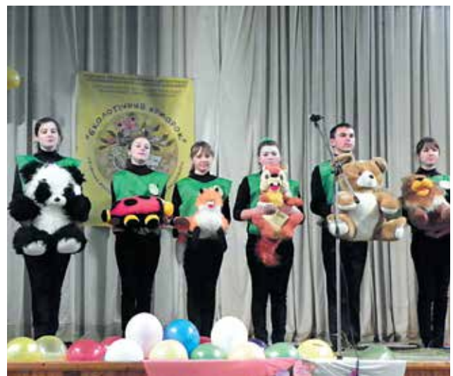
Агітбригада «Еколог» виступає на Одеському обласному фестивалі