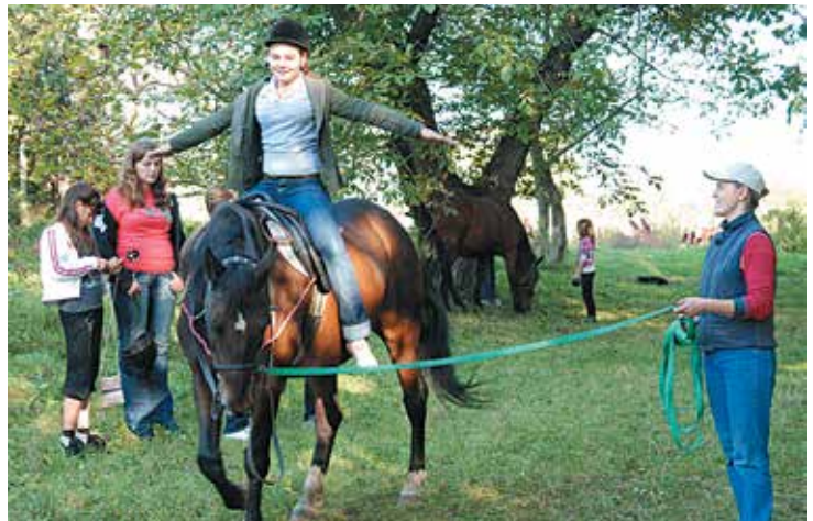
На занятті гуртка «Юні конярі»

На Рівненщині важливу роль у цьому відіграє комунальний заклад «Станція юних натуралістів» Рівненської обласної ради.