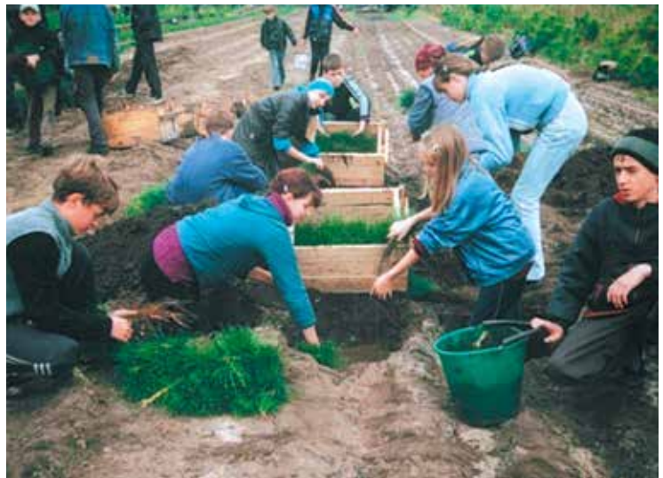
90-ті роки минулого століття.

Найбільшу ефективність в екологічній освіті і вихованні виявляли походи, експедиції, практикуми, польові збори, робота на навчальних екологічних стежках, практична природоохоронна робота в природі тощо. Саме тому у 1998 році Луганський ОЦЕНТУМ розпочав обласний проект «Активні форми роботи