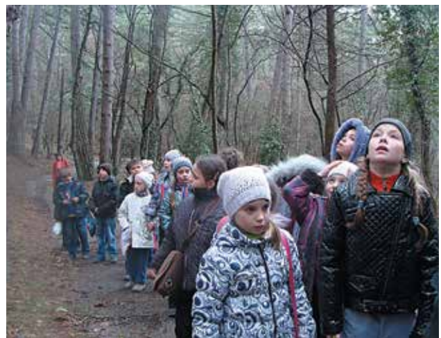
На осінній навчально-польовій практиці гуртка «Екологічний буквар «Веселка» Одеського обласного гуманітарного центру