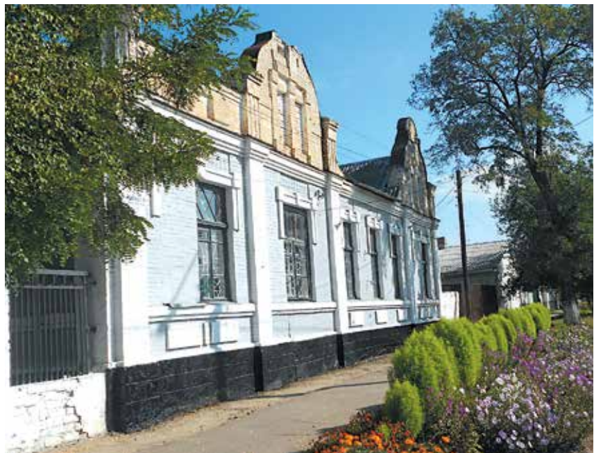
Будівля Павлоградської міської станції юних натуралістів