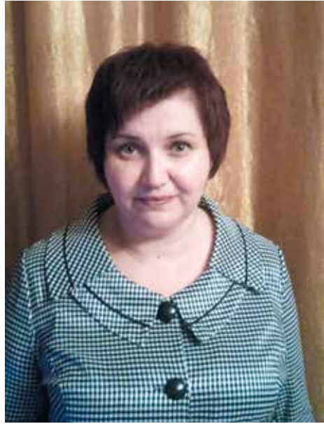
Директор Світловодської міськСЮН

На даний час в закладі працюють 9 педагогічних працівників: директор, методист, психолог і 6 керівників гуртків. Всі мають вищу педагогічну освіту.