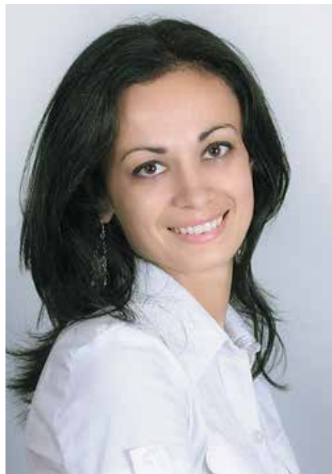
Директор Новоархангельської райСЮН

На сьогоднішній день юннати розміщуються у приміщенні Будинку дитячої та юнацької творчості, налічується загальна кількість гуртків 9, груп – 14, гуртківців – 210. Вихованці закладу мають змогу здобувати додаткові знання за квітково-декоративним (6 гуртків, 9 груп), декоративно – ужитковим (2 гуртки, 4 групи), еколого-натуралістичним (1 гурток, 1 група) напрямками.