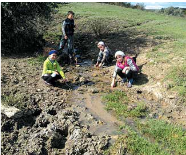
Юні друзі природи розчищають джерела на околицях м. Березівки (Одеська область)