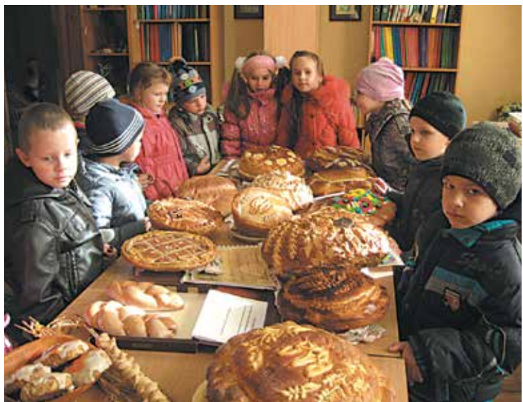
Обласний фестиваль «Українська паляниця»

Юннатівський рух в Приморській ЗОШ № 3 розпочинається після звільнення від окупації. І тоді, щоб підтримати дітей, дирекція школи взяла два гектари землі і вчителі разом з учнями посіяли кукурудзу та зібрали хороший урожай. Його вистачало, щоб протягом