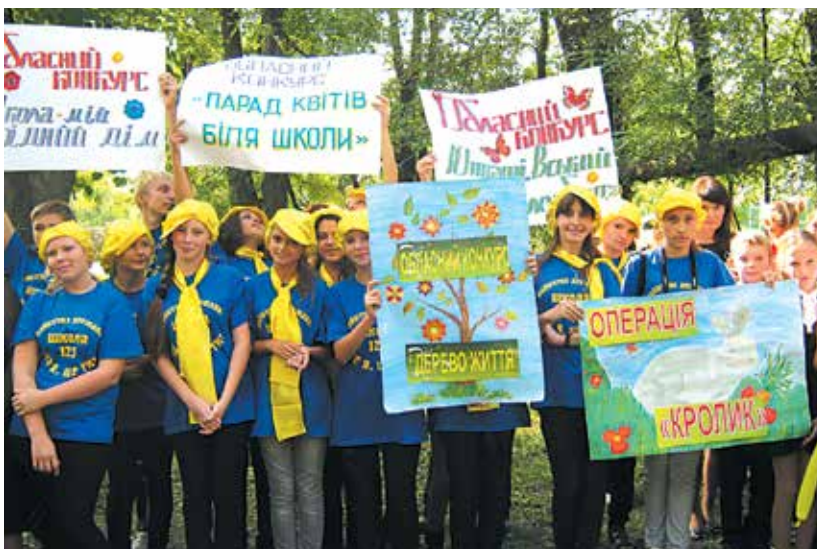
Вихованці СЮН на міському екологічному фестивалі

Гуртківці СЮН є неодноразовими учасниками та переможцями районних, міських, обласних, всеукраїнських масових заходів еколого-натуралістичного спрямування.