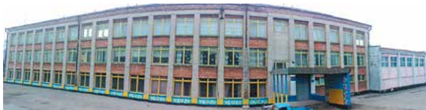
Криничанський Центр учнівської молоді

Відділ організує та проводить очні та заочні заходи: конференції, зльоти, конкурси, змагання, акції та виставки дитячої творчості. Створює необхідні умови для спілкування учнів та батьків, використовуючи різноманітні засоби емоційного впливу з урахуванням вікових особливостей учнів, здійснює пошук сучасних форм роботи, підтримує соціально-значимі ініціативи та рухи, взаємодіє з іншими закладами та установами.