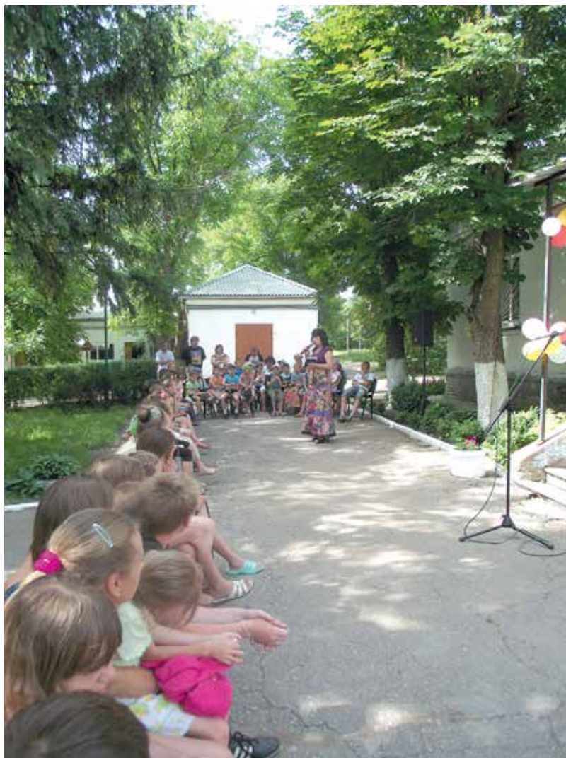
Будні Кіровоградського ОЦЕНТУМ