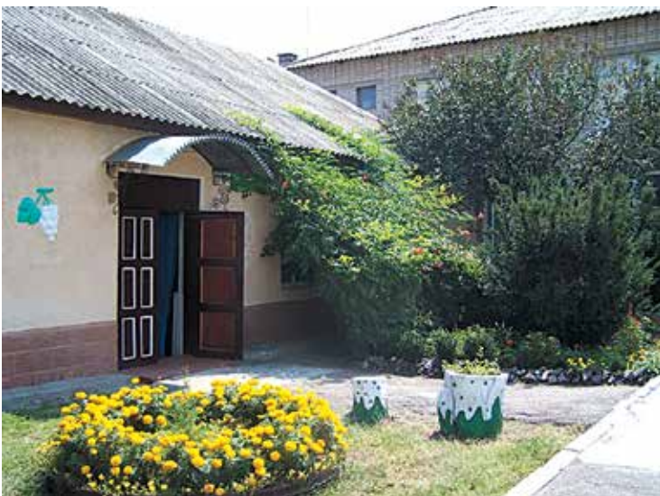
Будівля Павлоградського районного ЕНЦ

За період 1980–1990 рр. учнями і вчителями Вербківської, Межиріцьких №1, №2, Булахівської, Кочерезької, Богуславської, Троїцької та інших середніх шкіл отримано понад 30 медалей учасника ВДНГ.