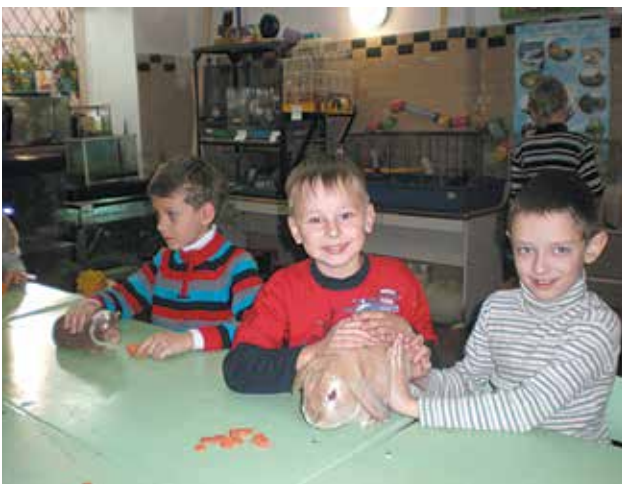
У куточку живої природи еколого-натуралістичного підрозділу Одеського обласного гуманітарного центру.

Еколого-натуралістичний підрозділ є організатором та куратором позашкільної еколого-натуралістичної роботи в області, працює над модернізацією змісту позашкільної еколого-натуралістичної освіти за системою, яка включає: організацію еколого-натуралістичної роботи з закладами освіти області; організація та проведення обласних масових заходах, участь учнівської молоді Одещини у Всеукраїнських заходах; залучення обдарованої учнівської молоді до науково-дослідницької роботи, участі у Національних та Всеукраїнських етапах міжнародних освітніх біологічних проектів. З 2005 року щорічно у грудні, підрозділ організовує та проводить обласний конкурс науково-дослідницьких проектів та авторських розробок з винахідництва «Молодь досліджує світ», що є очним обласним етапом Всеукраїнських освітніх проектів. Робота конкурсу-захисту проводиться по 4 секціях: «Екологія», «Біологічні дослідження», «Сільське господарство та лісництво» та «Винахідництво, енергія і середовище». Проекти-призери конкурсу рекомендуються журі до участі у Всеукраїнських етапах конкурсів та освітніх проектів. Щорічно учні гуртків еколого-натуралістичного підрозділу обласного гуманітарного Центру