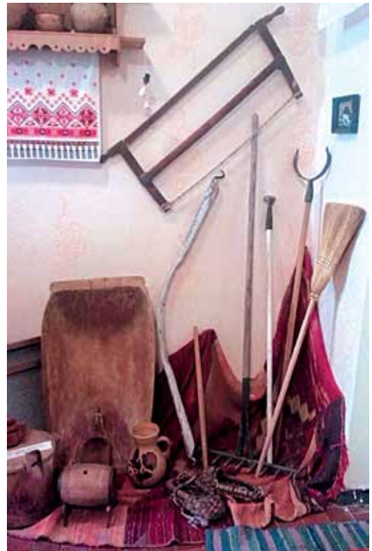
Експонати кімнати народознавства