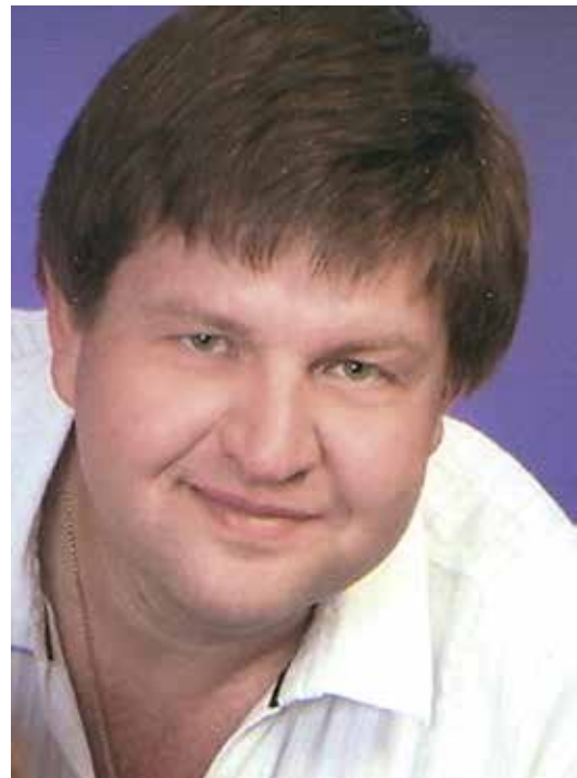
Директор Кіровоградського ОЦЕНТУМ

науково – освітніх проектах, програмах, виставках, конкурсах, зльотах. З цією метою було проведено ряд заходів з школярами області: обласний конкурс – захист екологічних проектів «Вчимося досліджувати та охороняти природу»; обласний зліт учнівських лісництв; зональні та обласний етапи Всеукраїнського конкурсу екологічних колективів «Земля – наш спільний дім»; обласний етап Всеукраїнського фестивалю «Українська паляниця».