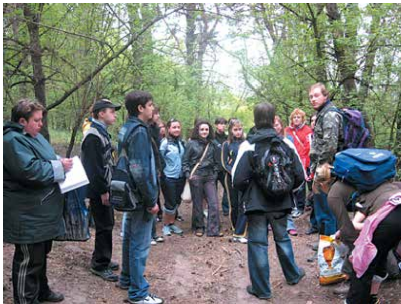
Районна експедиція «Люби і знай свій рідний край»