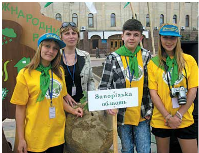
Учасники Всеукраїнського зльоту юних лісників