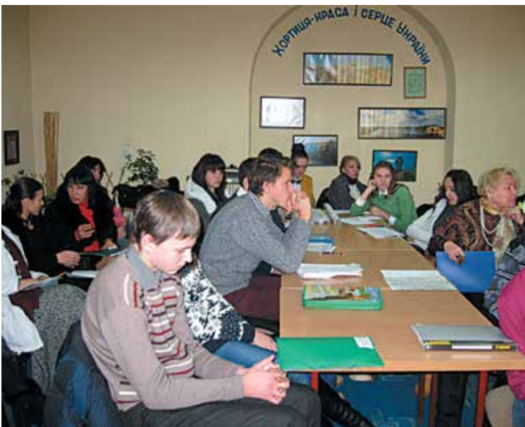
Учасники обласної науково-практичної конференції «До рідної природи з розумом і серцем»

З розбудовою шкіл у місті розпочинається рух по організації юннатівських гуртків. В 1956 році медалью ВДНГ була відмічена робота гуртка юннатів СШ № 1 м. Токмака (керівник