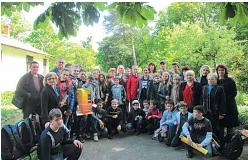
Стрийська міська станція юних натуралістів

Педагогічний колектив станції нараховує 9 працівників. Серед них є педагоги, які працюють на станції понад 30 років та молоді керівники гуртків. На базі СЮН діють такі гуртки: «Юні друзі природи», «Юні квітникарі», «Природа нашого краю», «Знавці лікарських рослин», «Фітотерапія», «Юннати молодшого шкільного віку», «Екологи-краєзнавці», «Кімнатне квіткарство».