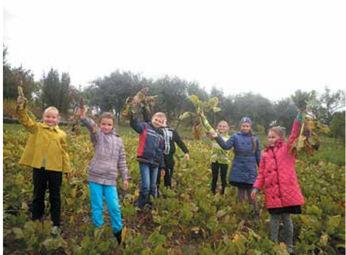
Навчально-дослідні земельні ділянки