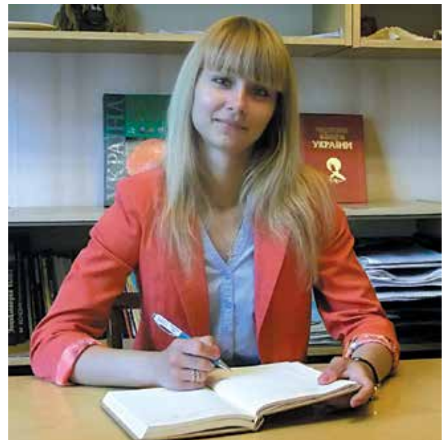
Директор Покотилівської станції юних натуралістів

на селищний, але юннатівська робота в районі продовжувалась. З 2005 року охоплення дітей еколого-натуралістич- ною роботою збільшилось, розширилась мережа гуртків, створився новий педа- гогічний колектив.