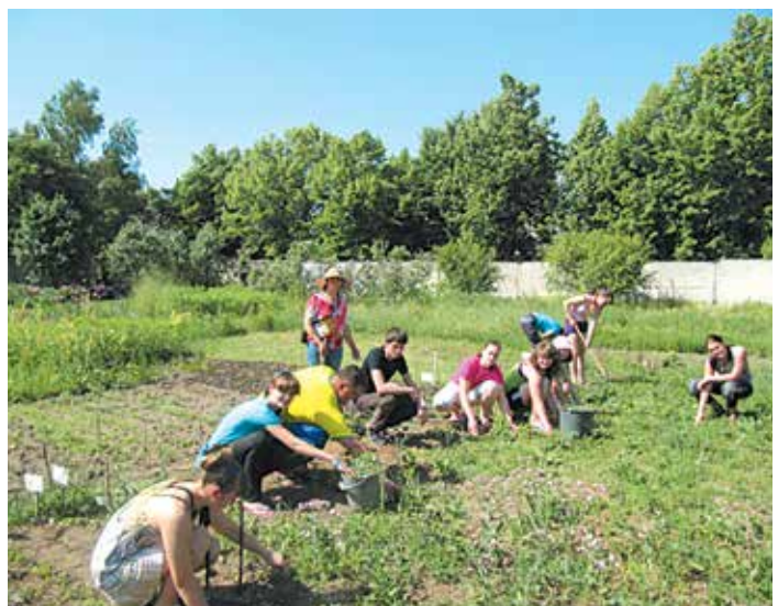
Робота на НДЗД закладу

За ініціативою педагогічного колективу закладу влітку 2014 року на базі СЮН було реалізовано новий міський пілотний проект «Міська літня біологічна школа для учнів 7–10 класів», мета якої – організація безперервної природничої освіти дітей в рамках експедиційної та проектної діяльності, відпрацювання практичних досліджень по єдиним скоординованим методикам.