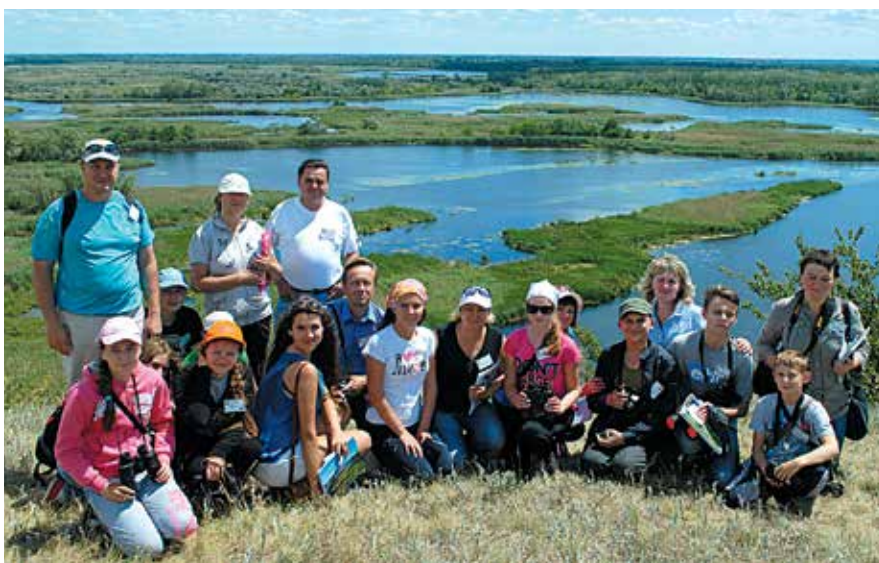
Всеукраїнський збір екологів Полтавська область

Обласний еколого-натуралістичний центр є координаційно-методичним осередком зі здійснення методичної, природоохоронної, дослідницької роботи у школах та позашкільних навчальних закладах області. З цією метою колективом закладу запроваджено проведення спільних педагогічних рад з районними методичними об'єднаннями вчителів природничих дисциплін, семінарів, координаційних рад директорів позашкільних навчальних закладів. На базі обласного еколого-натуралістичного центру проходять семінари-практикуми студентів природничого і психолого-педагогічного факультетів Полтавського національного педагогічного університету імені В.Г. Короленка, а також технології виробництва і переробки продукції тваринництва та факультету ветеринарної медицини Полтавської державної аграрної академії.