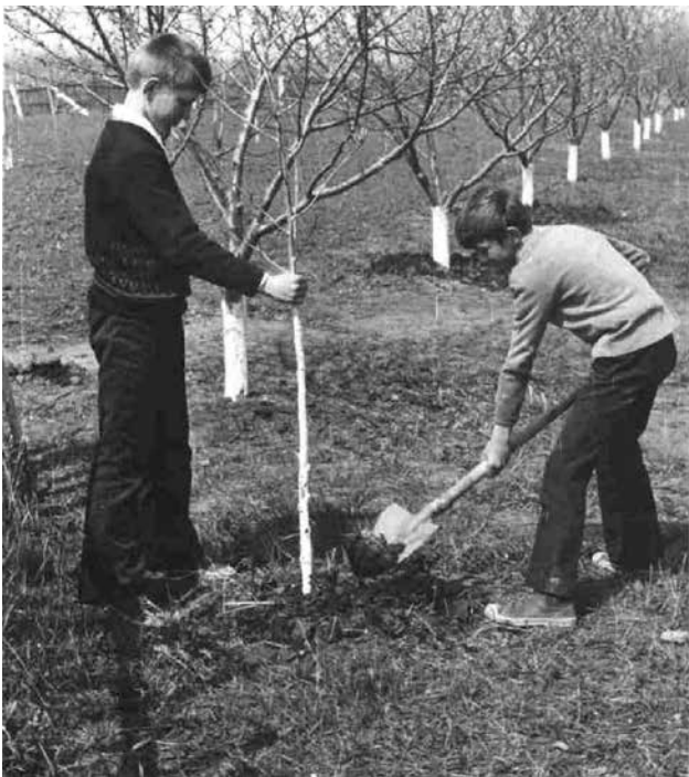
70-ті роки «Юннатівський зеленбуд» на Луганщині.

На початок 80-х років минулого століття в області працювали: 1 обласна, 14 міських і 1 районна станції юних натуралістів. Саме в цей період в області посилюється природоохоронний напрям роботи, що було обумовлено значним погіршенням екологічної ситуації в області. При кожній станції юних натуралістів та понад 150 шкіл були створені екологічні навчальні стежки. Значна увага приділялась вивченню стану водойм, розчистці джерел, обліку птахів, охороні та інтродукції рідкісних рослин та первоцвітів.