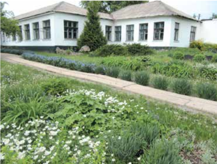
Будівля Жовтневої СЮН м. Кривого Рогу

закладів району в масових заходах; здійснення моніторингу природоохоронної діяльності; вивчення, узагальнення і розповсюдження передового педагогічного досвіду з еколого-натуралістичного профілю.