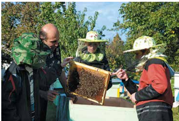
На заняттях гуртка «Юні бджоларі»

У закладі впроваджуються інноваційні технології методичної роботи з педкадрами як стимулюючий процес, що характеризується прагненням педагога репрезентувати власне розуміння цілей навчання і виховання. Більшість методичних заходів проходять в нетрадиційних тренінгових формах, якими успішно оволодівають всі працівники закладу, елементи тренінгів використовуються при проведенні гурткових занять, виховних заходів. Кафедри, «круглі столи» значною мірою урізноманітнюють співпрацю методистів і педагогічних працівників у справі підвищення кваліфікації та педагогічної майстерності.