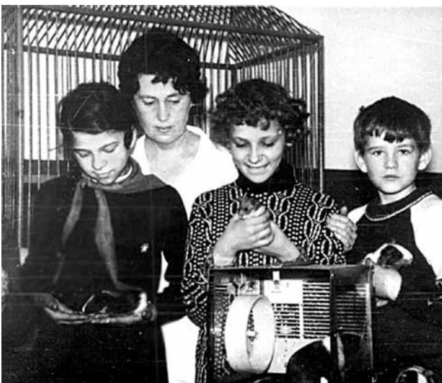
Юннати в куточку живої природи

Використовуючи можливості співпраці з міським управлінням охорони здоров'я, кафедрою екології ІХТ ім. В. Даля колективом закладу реалізуються спільні творчі програми «Знання втілені в практику» та