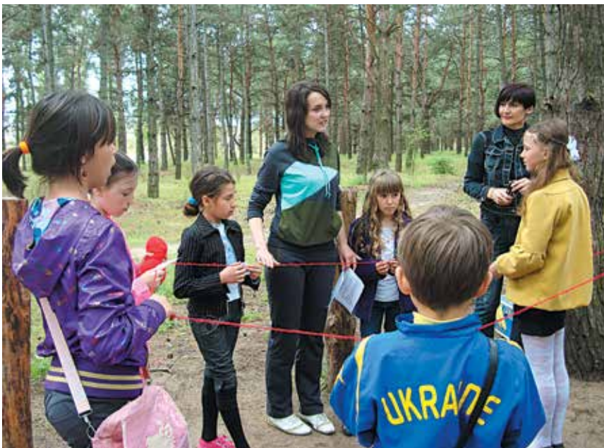
На занятті гуртка

Чимало корисного зробили гуртківці на той період. Вони посадили тисячі декоративних і плодкових дерев та кущів, озеленили парки, сквери, могили, пам'ятники загиблим воїнам. В кожній школі району було організовано секцію охорони природи, почали діяти «голубі» і «зелені» патрулі.