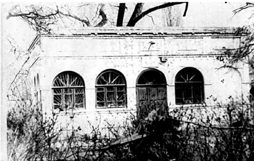
Перше приміщення станції

В 1988 році відповідно рішення Рубіжанської міської ради народних депутатів № 266 «Про переобладнання господарчого блоку середньої школи №11 під станцію юних натуралістів» промислові підприємства виконали відповідну роботу і переобладнали приміщення господарського блоку ЗШ № 11 під майбутнє приміщення нової станції юних натуралістів. Вже через декілька