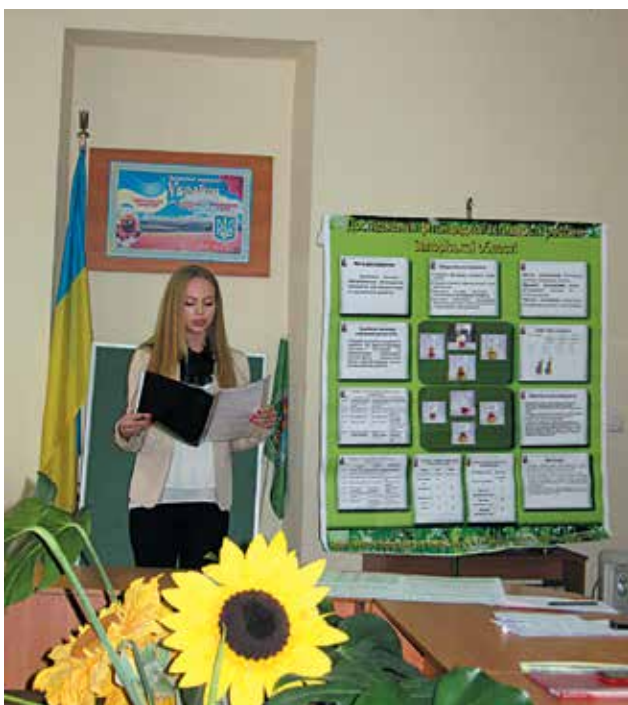
Трибуна юного науковця