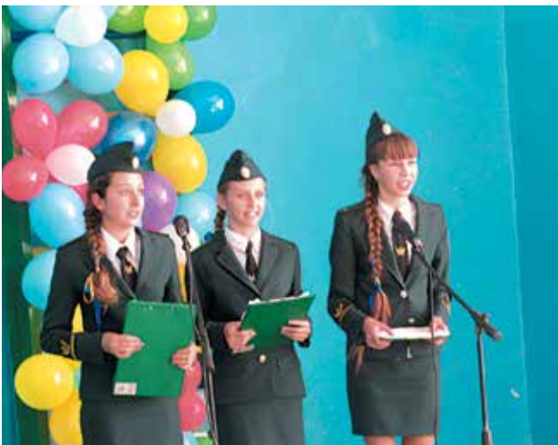
Юні лісівники з Савранського району Одещини розповідають про свою роботу на обласному зльоті.

В 1958 році в Розквітівській школі була створена учнівська виробнича