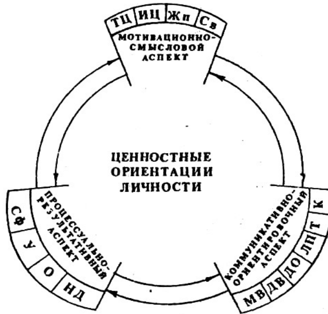
Рис.1. Модель целостного, многоаспектного анализа ценностных ориентаций личности подростков

Результаты исследований (А.Адыкулов, М.И.Бобнева, А.А.Деркач, О.И.Зотова, Б.С.Круглов, Н.И.Рейнвальд, Е.В.Селезнева, В.А.Ядов и др.) указывают на основную характеристику ЦО личности, – их направленность. В модели целостного, многоаспектного анализа использован подход, в котором ЦО подростков анализируются через направленность их компонентов: альтруистическую – эгоцентрическую, предметную (S-O) – коммуникативную (S-S).