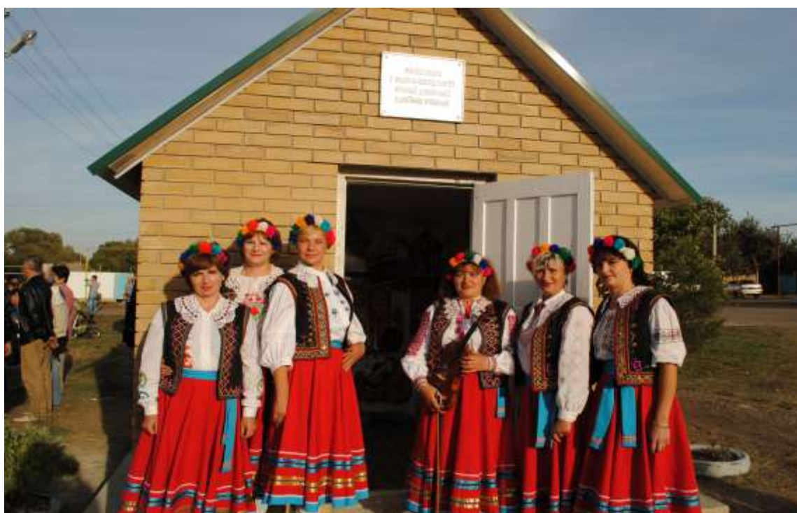
Ансамбль «Паняночка» біля каплички