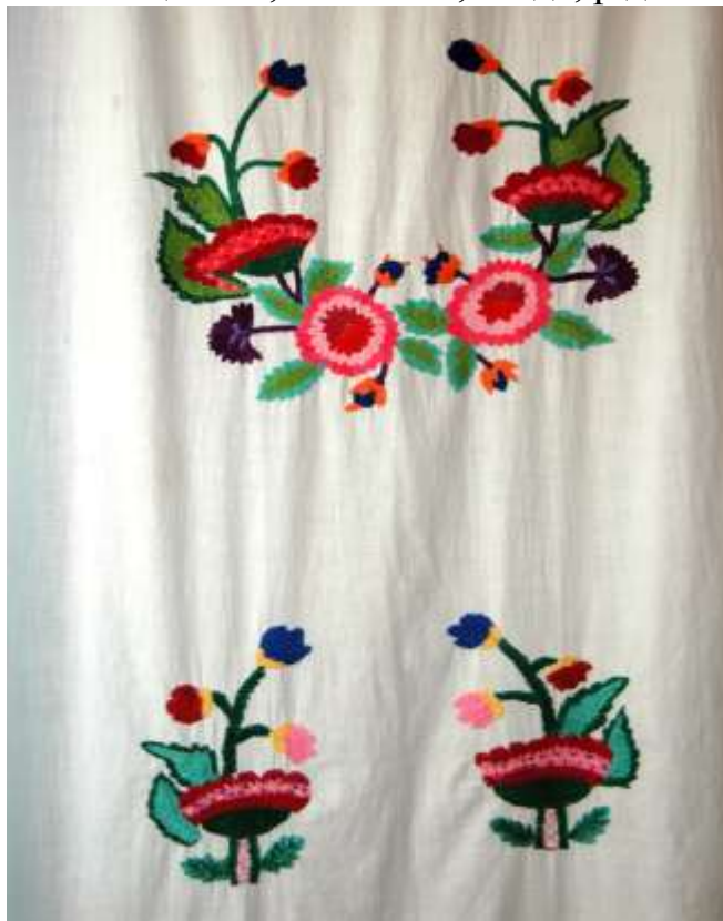
Рушник вишитий в с. Переможне Новийдарського р-ну

У східних регіонах лемківщини можна виділити такі типи вишивок: з геометричними мотивами — ромбами, зубцями, розетками; геометризованими — дерева життя, в яких прямий центральний стовбур, обабіч симетрично розміщені заокруглені вниз спіралеподібно пагінці; рослинними — квіткові, галузкові мотиви з видовженими листочками. Техніка вишивання — ланцюжок, стебнівка, гладь, рідше — хрестик.