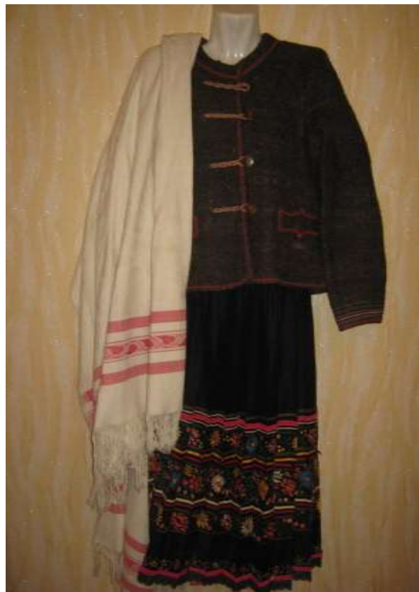
Тепла одяжка. Узимку жінки носять кожушки