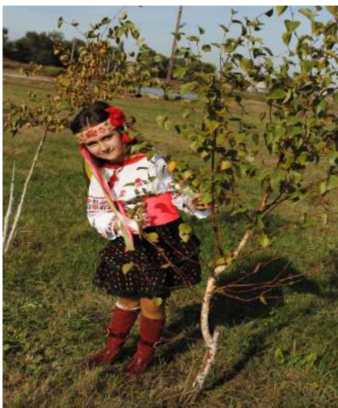
Лемки с. Переможне у національних костюмах