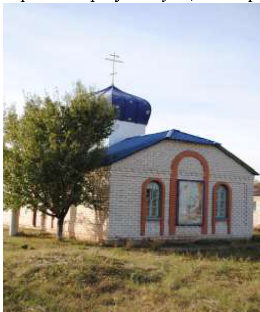
Церква в с. Переможне Лутугинського р-ну

– Тоді в нас не було ніякої іншої Церкви, крім московської, людям нада було кудись ходити, і ми пішли туди, навіть пішки ходили 15-20 кілометрів, бо тут церкви спершу не було, а тепер... Може і тут відродиться наша?