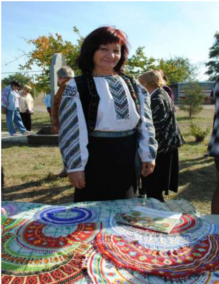
Співачка з Києва заслужена артистка України М.Яницька