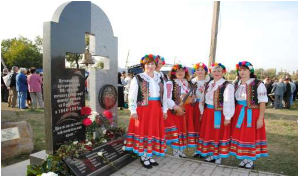
Жіночий вокальний ансамбль «Паняночка» з с.Штурмове Новоайдарського р-ну біля пам'ятного знаку

Урочиста частина свята почалася з виступу почесних гостей і організаторів свята, які підкреслювали в промовах, що, незважаючи на надскладні нелюдські умови депортації, виселення і важкі перші роки облаштування на новій землі, лемки змогли зберегти свою самобутність і культуру навіть в умовах російськомовного сходу України.