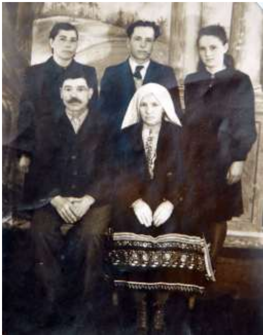
Лемківська родина з с. Переможне Новоадарського р-ну

стрічки, завдовжки до нижнього краю спідниці. Поверху нижніх стрічок обома краями чіпляли зігнуті, наче петельки, стрічки- "засівки", якими покривали плечі. Така прикраса голови, як вінок нареченої, виступала своєрідним акцентом в ансамблі весільного вбрання, надаючи йому монументальної величі, святковості та врочистості.