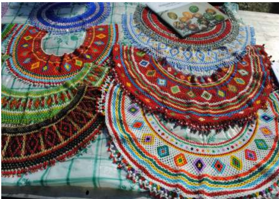
У жіночому костюмі лемкинь виступали прикраси із різнокольорового бісеру — гerdани та кризи