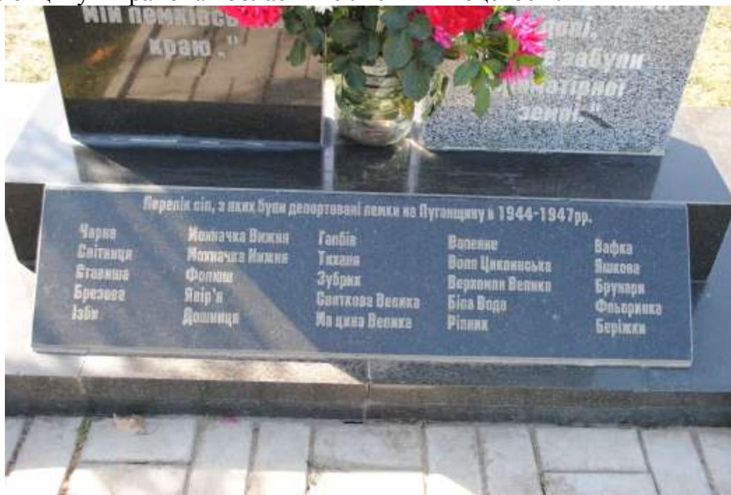
Пам'ятний знак у с. Переможне Лутугинського району. На плиті витісунан перелік сіл, з яких депортовані лемки на Луганщину в 1944-1947 рр.

На місцях виконками обласних рад створювалися групи по розселенню та улаштуванню переселенців з Польщі. Згідно постанови бюро Ворошиловградського обкому партії та виконкому Ворошиловградської обласної ради „Про розселення колишніх польських громадян на території Ворошиловградської області” (липень 1944 р.) передбачалось розмістити переселенців у 12 районах області в сільській місцевості.