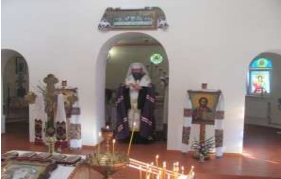
У Парафії "Царя Христа" . Візит Глави УГКЦ Блаженнішого Святослава (Шевчука) в Луганськ

Релігійний дух Лемка відображається і в його щоденному житті й в звичаю. Він звик кожену справу починати і закінчувати з Богом. Наведені нижче різні вірування і звичаї в сутності мають глибокий зміст і служать доказом високої моральності на Лемко-вині.