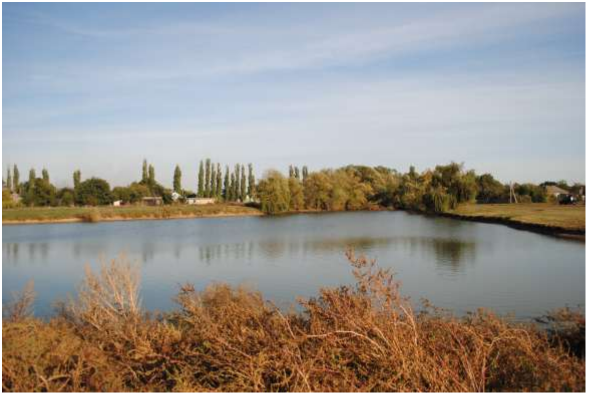
Краєвиди с. Переможне