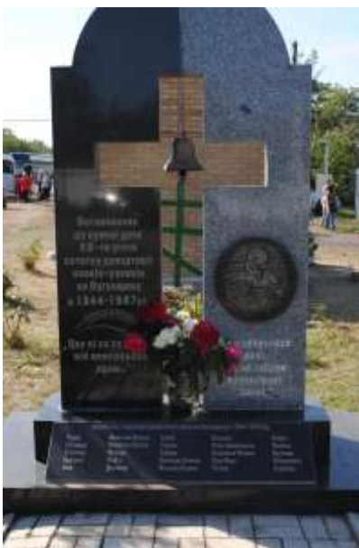
Пам'ятний знак у селі Переможне Лутугинського району Луганської області

Проведення фестивалів, побудова каплиць, пам'ятників, видання книг, краєзнавчих нарисів наближує нас до спільного вивчення сторінок історії України, усвідомлення того, що ця етнічна група «завжди була і залишається частиною української нації».