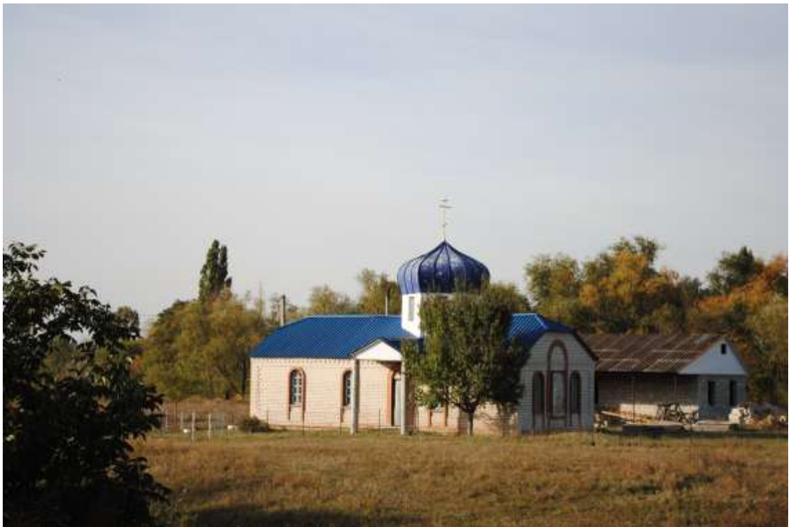
Церква в с. Переможне