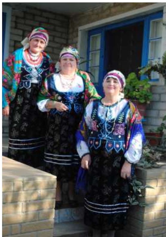
Лемківські жінки завжди одягались красиво, охайно і зі смаком, відповідно до традицій