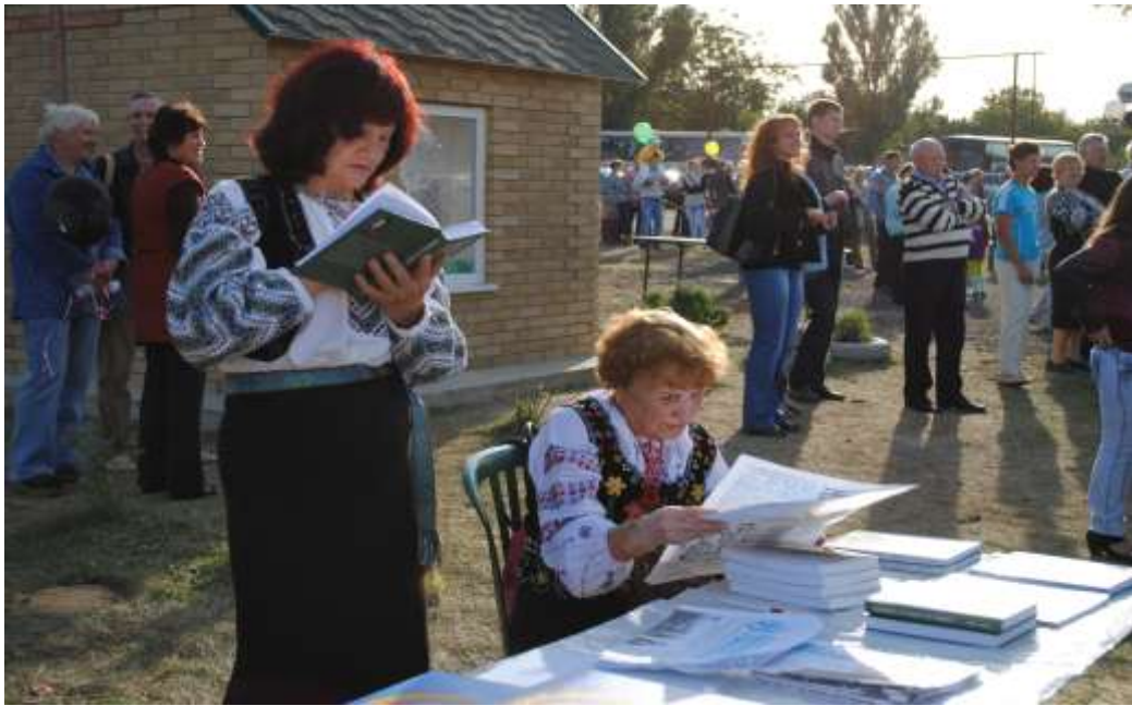
Лемки з Київ привезли лемківські книги, часописи, газети