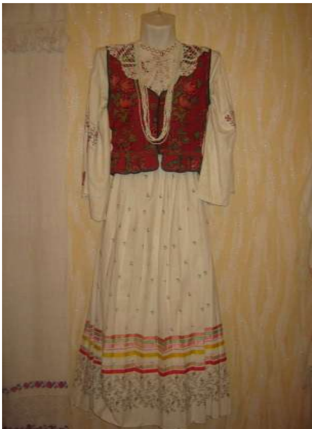
Жіночий лемківський одяг на весілля

Одяг лемків не сплутаєш з одягом інших етнічних груп українців