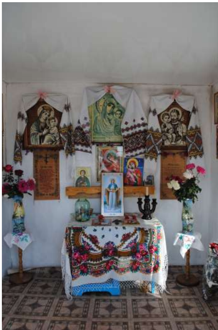
У капличці с. Переможне Лутугинського р-ну

Лемко каже „чужого не хочу, але свого не дарую”; це вартісна прикмета, що найкраще характеризує всіх Українців і Лемка, в минулому й сучасному.