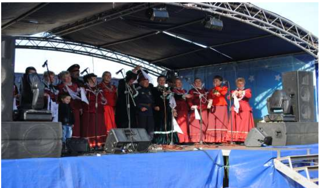
Козачий хор зі Станиці Луганської виконав пісні «Колечко» «Земляничка ягодка» «Солодушка»