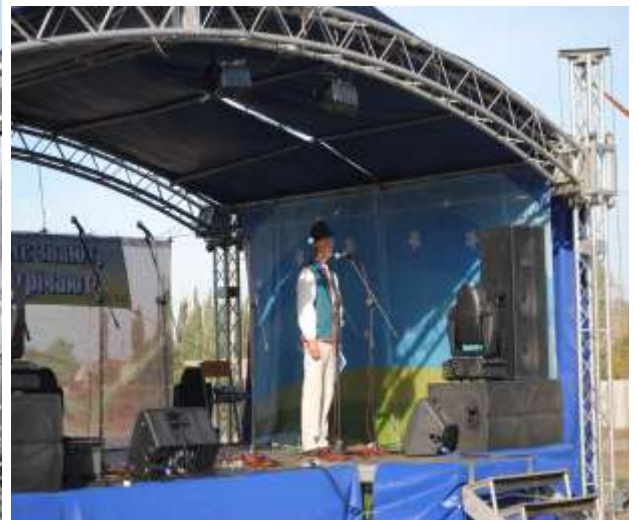
Ведучий фестивалю лемко з Києва

У програмі фестивалю – дитячі забавки на знання історії України та Лемківщини, конкурс малюнків та конкурс на кращий дитячий номер, виступ фольклорних колективів з Луганщини та з інших областей України, виставка декоративно-ужиткового мистецтва «Місто майстрів», народні гуляння.