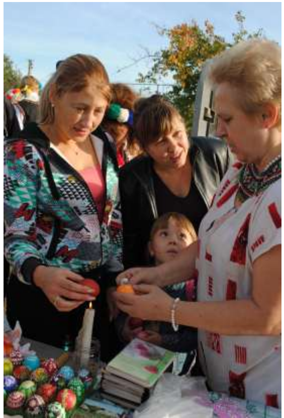
Навчання гостей фестивалю техніці написання лемківської писанки воском