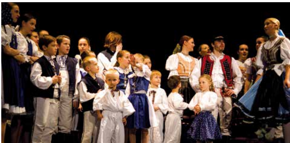
Na pódiu Kulturního centra Novodvorská se se svými velikonočními tradicemi představily soubory etnických menšin.