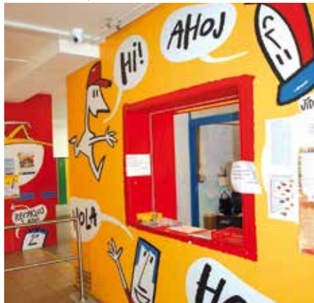
O bezpečnost dětí se starají také vrátní.

Nejdůležitější a také nejtěžší je primární prevence přímo v třídních kolektivech, kterou na základních školách mají na starosti právě metodici prevence a ochotní pedagogové. Ti zde působí proti negativním jevům, jako jsou záškoláctví, šikana a kyberšikana, rasismus či různé dětské závislosti.