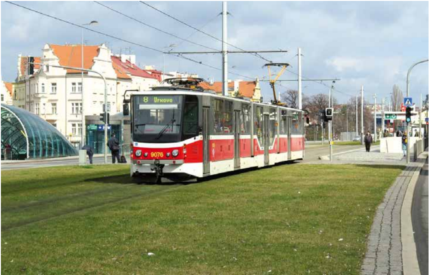
Zatravněné tramvajové těleso pohlcuje prach a tlumí hluk.

V zduch. Bez něho není lidská existence myslitelná. Ovšem musí jít o vzduch čistý, nikoliv zamořený. Takový nám naopak ubírá na délce i na kvalitě života. A bohužel, každoročně tisíce Pražanů zdravotně doplácí na život v metropoli s intenzivním automobilovým provozem, který do ovzduší vypouští škodlivé emise, a je tak jeho největším znečišťovatelem.