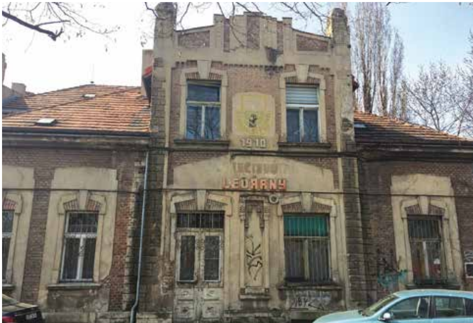
Branické ledárny by si zasloužily generální opravu.

N a břehu Vltavy v Braníku stojí zvláštní stavba – Branické ledárny. Vlastně to není jen jedna stavba, ale komplex budov: ledárna, bývalé stáje a vila, kdysi správní budova, a byt správce. Budova dnes už nepoužívaná obří lednice leží v blízkosti Vltavy, protože v přílehlém zálivu byl v zimních měsících řezán led, kterého se do zdejší ledárny vešlo až 20 tisíc tun. Odtud pak byl led rozvážen do hospod, restaurací, potravinářských provozů i do nemocnic. Výstavbu Branických ledáren iniciovali, jak jinak, pražští hospodští, když původní zařízení na ostrově Štvanice již přestávalo vyhovovat. Jako vhodný pozemek pro stavbu byla vybrána jedna z nejchladnějších lokalit ve vltavském údolí. Stavbu navrhl architekt Josef Kovařovic v secesním stylu. Vlastní stavbu provedla známá karlínská stavební firma Nekvasil. Ta stavěla po celé Praze mnoho industriálních staveb, včetně Branického pivovaru a Podolské vodárny. Stavělo se od roku 1909 do roku 1911. Hlavní budova pro uchování ledu zvaná lednice byla jednou z prvních takto rozsáhlých staveb využívajících železobetonový skelet. Tato železobetonová konstrukce je obehnaná izolační zdí s korkovou izolací a další izolační vzduchovou mezerou. Má také důmyslný systém odvětrávání a odvodu vody z roztopeného ledu.