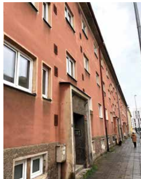
V Matěchově ulici se již řemeslníci chystají na opravu domovních fasád.

„Jsem rád, že dojde k opravě dalšího bytového domu, současný stav totiž rozhodně není dobrý a oprava zaručí obyvatelům těchto domů mnohem vyšší standard bydlení. Zároveň vítám každý další krok k modernizaci bytového fondu v majetku městské části Praha 4,“ shrnul dobrou zprávu místostarosta Lukáš Zicha (STAN-Tučňák), který má majetek městské části v kompetenci. (red)