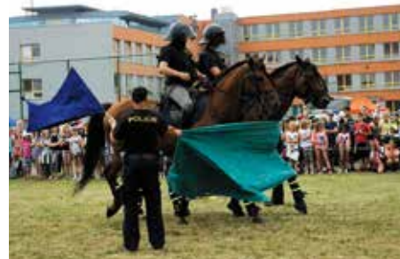
Během akce se žáci v minulých letech také seznámili s vybavením policejních aut, motorkami, radary a dorazila i hlídka jízdní policie na koních.