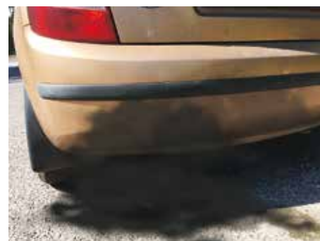
Lidem ve městech škodí nejvíce výfukové emise z automobilů.