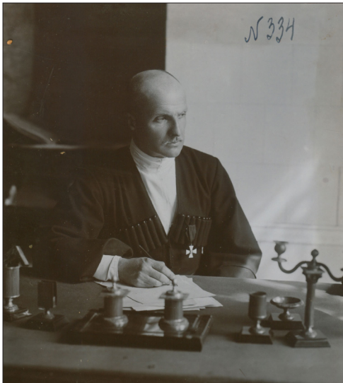
П. Скоропадський в робочому кабінеті.

Ключові слова: Українська Держава; Гетьман; Грамота; унікальний документ; ЦДАВО України.