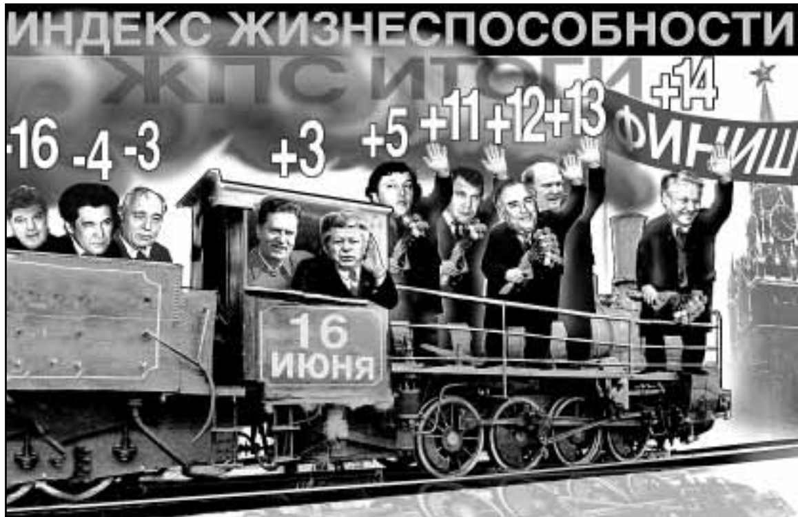
Итак, бабки подбиты. Методом простого суммирования очков мы определили лидеров и дутсайдеров за отчетный период. На взгляд крупье, при всем субъективизме раздачи фишек общая картина получилась достаточно объективной.