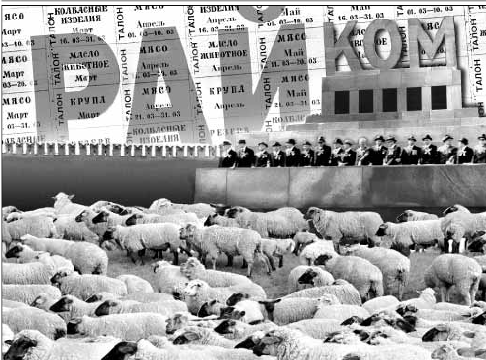
Неужели это мы с тобой?

24 (817) Июнь 1996 г. В розницу цена свободная