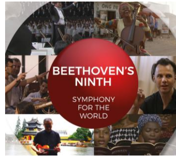
Beethoven's Ninth - Symphony For The World