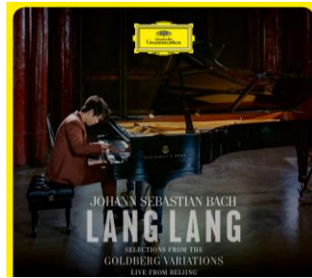
Lang Lang J. S. Bach – Goldberg Variations