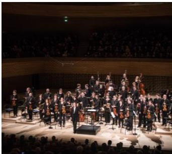
De Barbeyrac / Van Oostrum / Skerath / Laurence Equilbey / Insula Orchestra