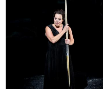
Nina Stemme / Antonio Pappano / Orchestra of the Royal Opera House