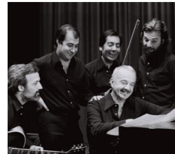
The Years of the Shark – Astor Piazzolla