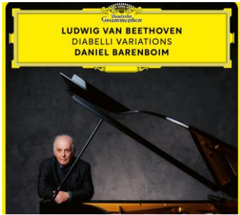
Daniel Barenboim Diabelli Variations (Visual Album)