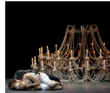
Romeo and Juliet