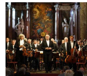
Valery Gergiev / Münchner Philharmoniker