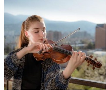
What To Do With All This Love