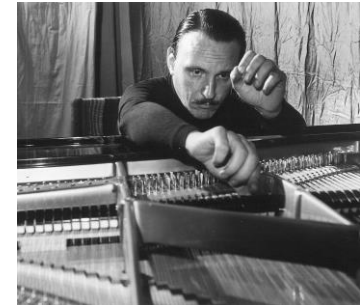
Arturo Benedetti Michelangeli Beyond Perfection