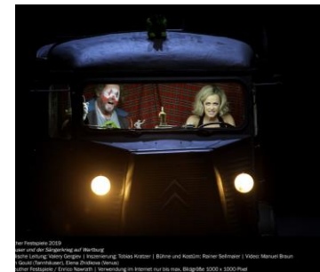
Lise Davidsen / Valery Gergiev / Chor und Orchester der Bayreuther Festspiele