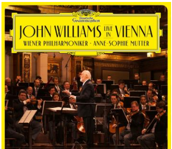
John Williams / Anne- Sophie Mutter / Wiener Philharmoniker