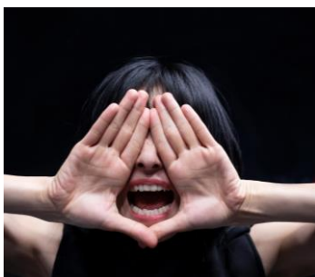
Force and Freedom - Beethoven zwischen Zwang und Freiheit