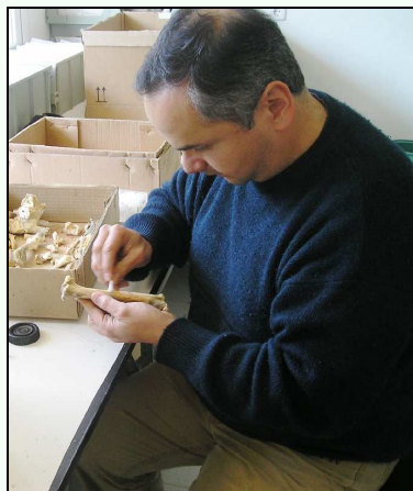
Netejant ossos de Myotragus a l'IMEDEA (març de 2009).

Ha assistit a nombrosos congressos i aquí, ha col·laborat amb l'organització d'algunes Jornades del Medi Ambient de les Balears organitzades per la Societat, i també com a membre del comitè organitzador del Simposi Internacional Insular Vertebrate Evolution: the palaeontological approach , organitzat per l'IMEDEA i la Societat el setembre de 2003, fruit