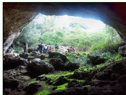
Aturada a la cova des Coll des Pastors, serra de na Burguesa.

A mig camí es va fer una aturada on es van explicar el valors mediambientals de la serra; una de les qüestions que més va sorprendre als assistents va ser que la serra de na Burguesa estigui exclosa del Paratge Natural de la Serra de Tramuntana, tenint en compte que n'és una part important.