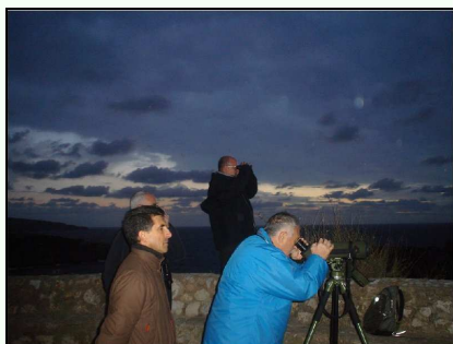
Observació crepuscular del virot petit.

Igualment com es va fer a La Mola, es va fer una dissertació sobre l'espècie, els seus sonogrames, diferenciació de sexes, problemàtica de l'espècie, etc.