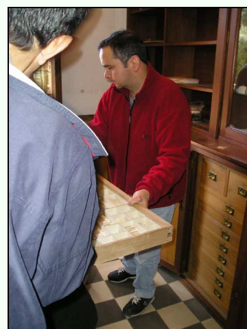
Durant el trasllat de la col·lecció Cuerda