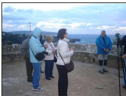
Des del Mirador, els assistents albiraren els aucells.

assistents albirarem els aucells. Es va armar un telescopi, i també amb els prismàtics dels participants s'observà el moviment dels aucells. El renou de les ones feia impossible la seva escolta, però si es veren individus solitaris de virot petit volant a la zona, a més de gavines i corbs marins. L'activitat s'inicià a les 17:30 i finalitzà a les 22:00.