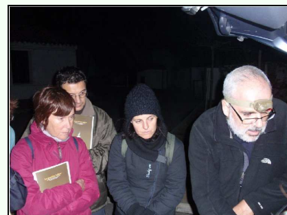
Els assistents es mostraren molt interessats en el tema.

Caminant anàrem fins a un primer punt d'escolta vora el far de senyalització. El temps no va acompanyar, feia vent i no facilitava l'escolta. Als assistents se'ls va repartir un llibret sobre el virot petit i un full resum elaborat expressament per a l'activitat.