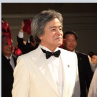
ガバナーエレクト L大石誠