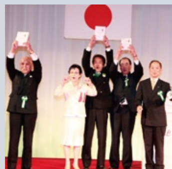
ガバナーズアワード表彰風景