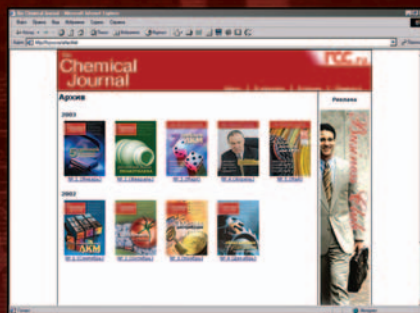
В разделе «Архив» — обложки всех вышедших номеров.

Оформление подписки через сайт — http://tcj.rcc.ru/subscribe.html