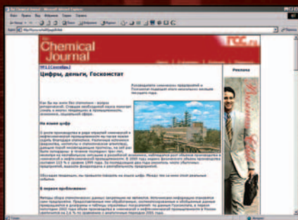
Материалы первого номера опубликованы на сайте полностью.