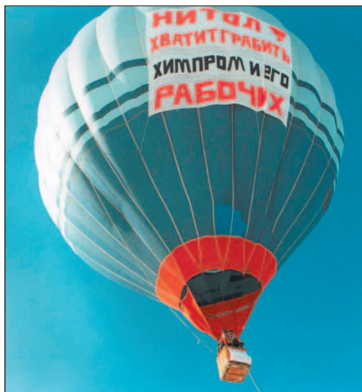
Компания «ТАИС» использует самые неожиданные средства в борьбе с оппонентами

Ранее «ТАИС» уже выигрывала арбитражный суд по аналогичному отказу руководства ОАО «Усольехимпром» предоставить информацию акционерам. Компания ▶