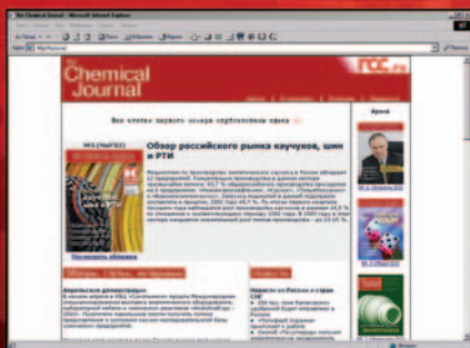
На первой странице сайта можно ознакомиться с оглавлением последнего номера.