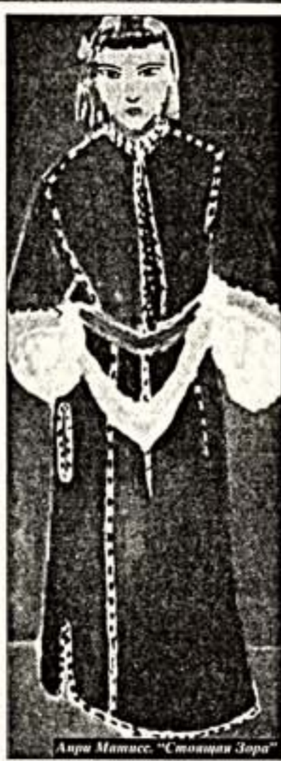
Анна Матисса. "Стоящая Зора"