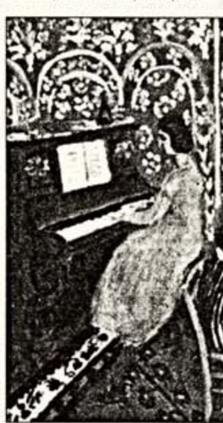
"Планистка и игроки в шахматы"