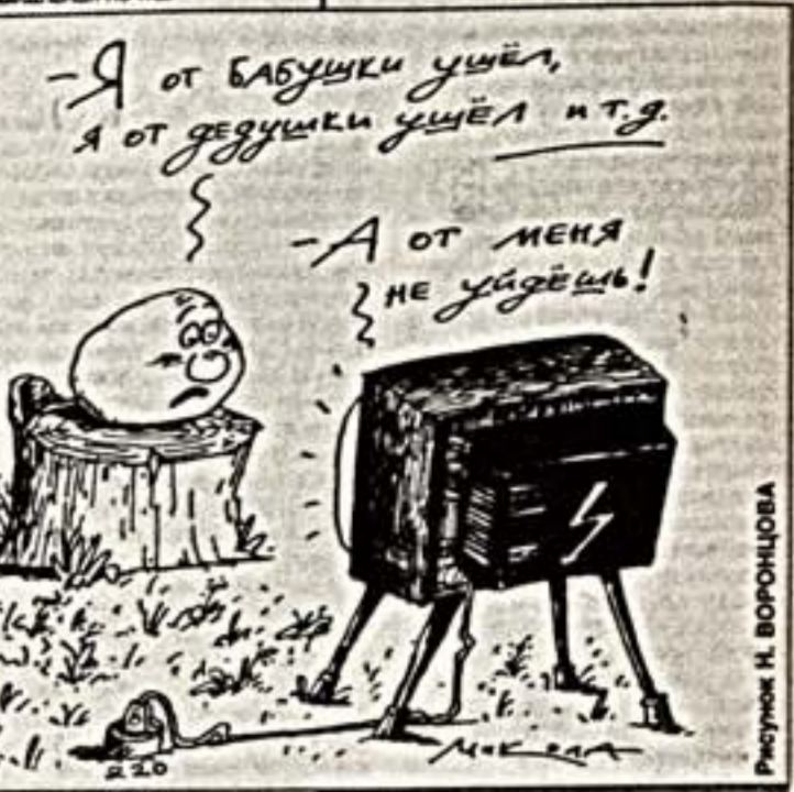
Рисовал Н. ВОРОЦОВА

1 КАНАЛ 8.00 Х/ф "РЫБЫ ГРЫШ". 9.40 Лотто-Миллион.