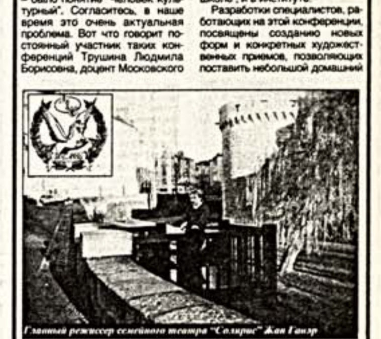
Главный режиссер семейного театра "Солярис" Жан Гавра

С 16 по 17 февраля 1998 года в Театре "Солярис" на проспекте Вернадского проходили V-я международная научно-практическая конференция и декада, посвященные 170-летию со дня рождения известного французского писателя Жюль Верна.