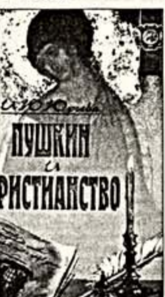
Имя Пушкина в истории культуры - это имя, которое было вечно актуальным. Имя Пушкина...