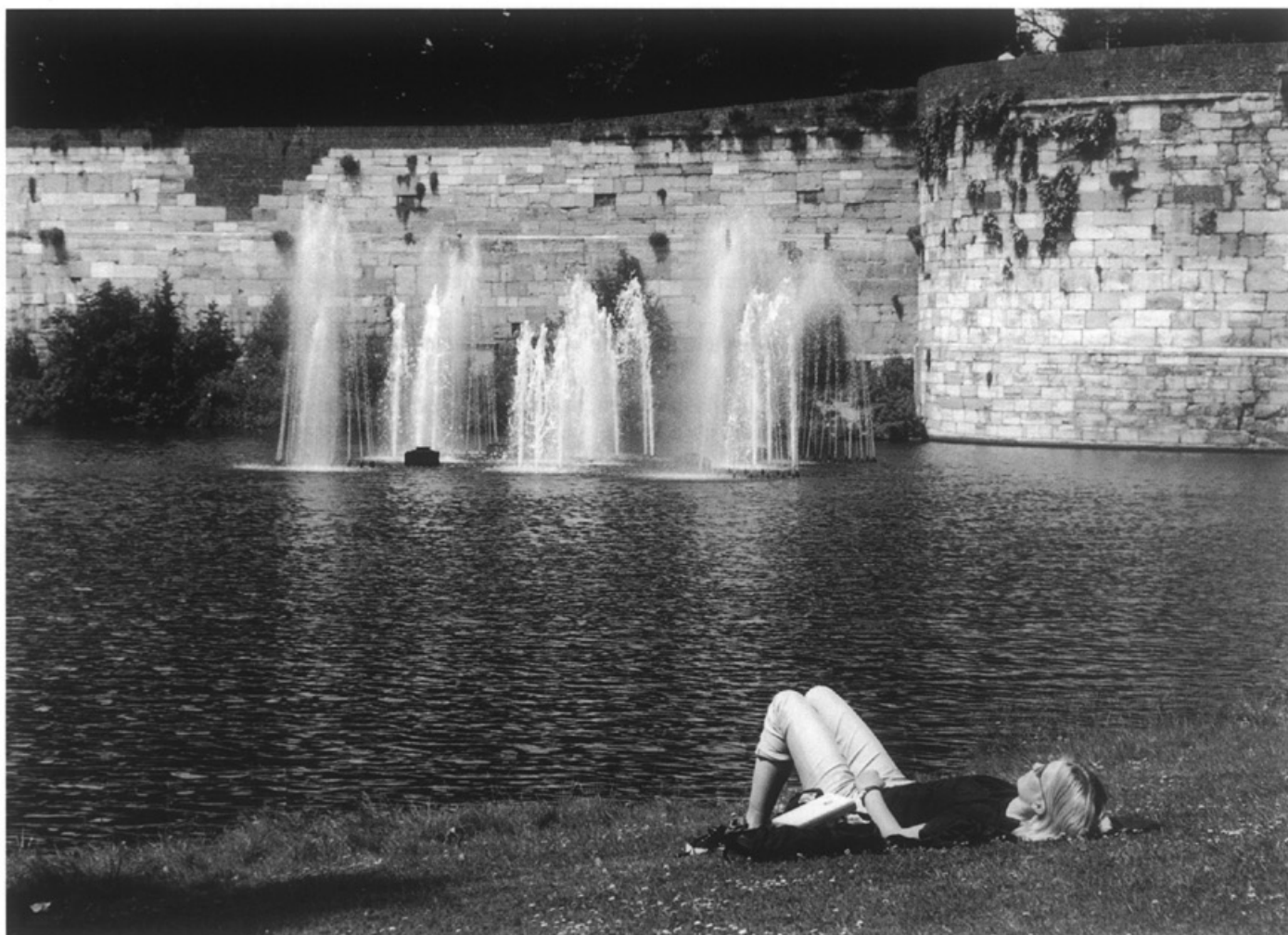
Zomer 1998, lekker relaxed • Foto Focuss 22