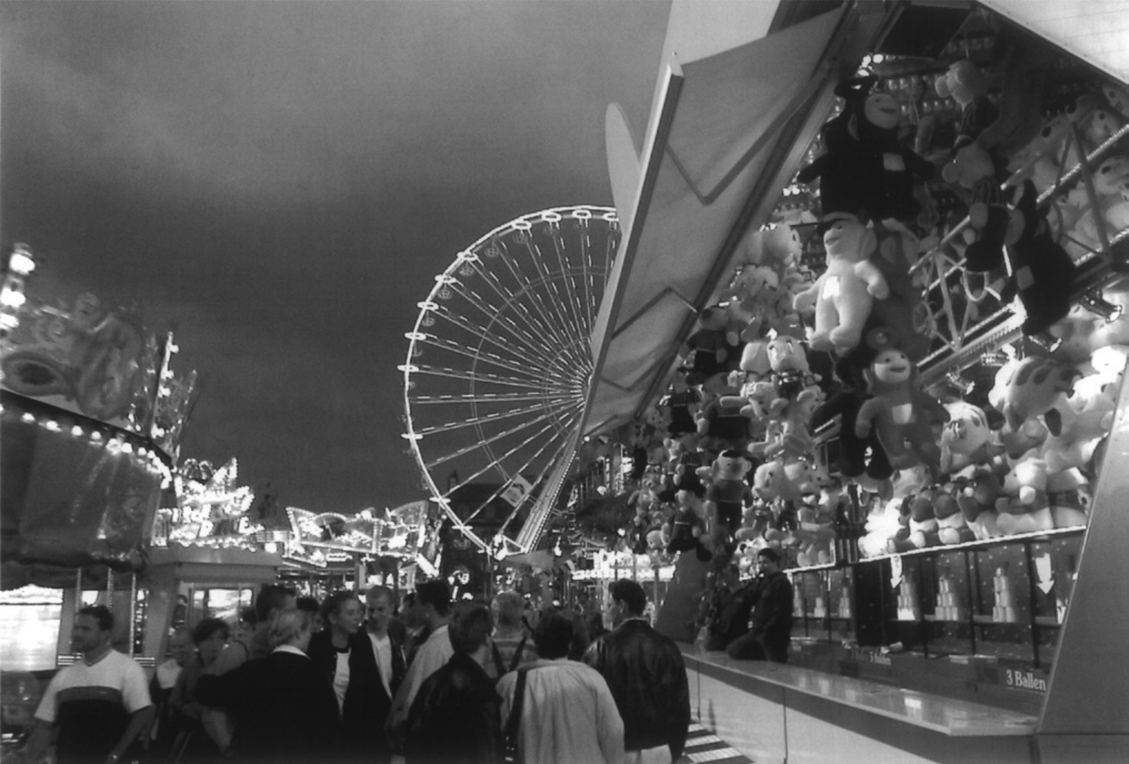
De kermis in Maastricht • Foto Focuss 22