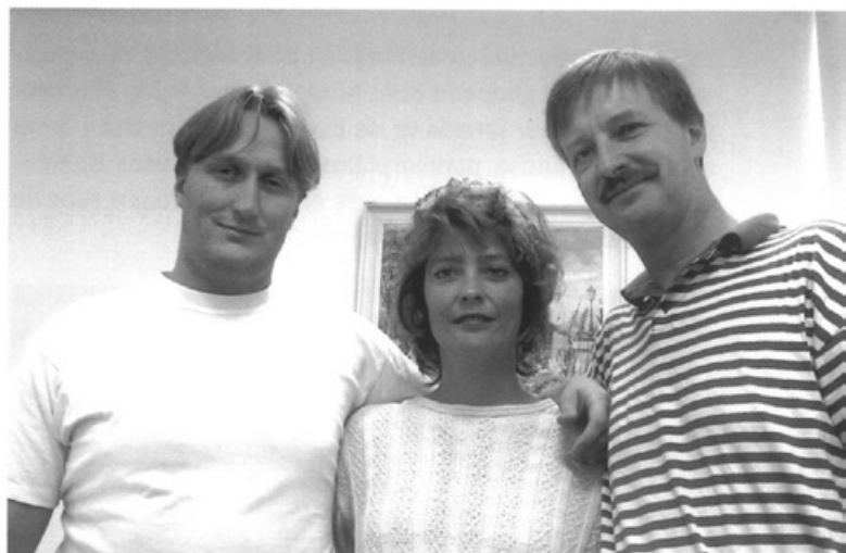
Het team van de Dakloze Jongeren Opvang

Het Project Opvang Thuisloze Jongeren van de Stichting Jeugdhulp Maastricht wordt genomineerd voor de Hein Roethof prijs. Alleen al de nominatie levert f 10.000,- op. Het Ministerie van Justitie heeft deze prijs ingesteld om kansrijke projecten te stimuleren. De Opvang Thuisloze Jongeren is bestemd voor jeugd tussen de 12 en 25 jaar die drie maanden geen vaste verblijfplaats meer gehad heeft. In het najaar wordt de winnaar van vier genomineerde projecten bekend gemaakt.