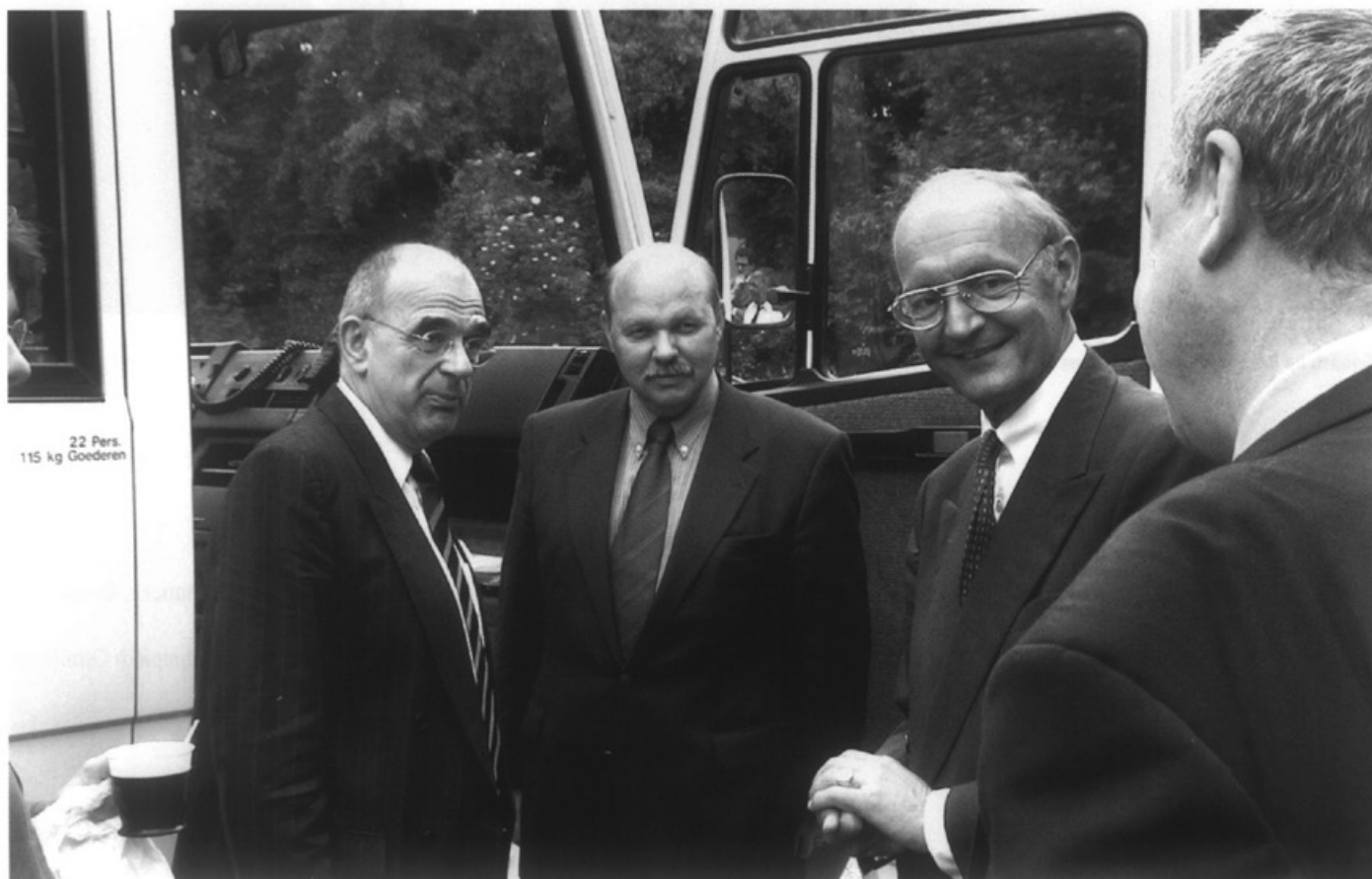
Minister Pronk in Maastricht

Minister Pronk bezoekt op 31 mei Maastricht. In de 'Knoke- febrik' was gelegenheid hem vragen te stellen. Voor wie niet weet waar die febrik ligt: op de Lage Frontweg aan het weg- getje naar beneden, richting havenkom. Het gebouw is thans de beoogde huisvesting voor Studenten Vereniging Circumflex.