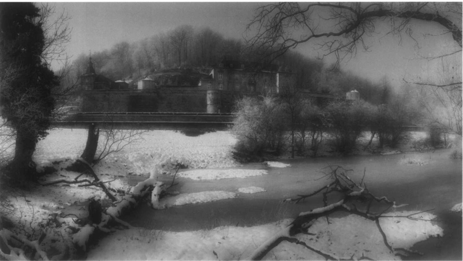
Kasteel Neercanne