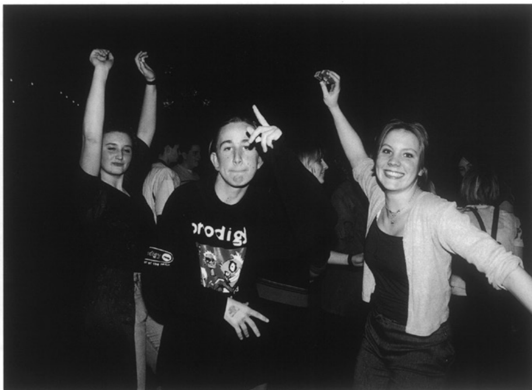
Popconcerten in Maastricht blijken mogelijk, gezien deze 'Hiemelparty' in de Platte Zaal op 26 februari