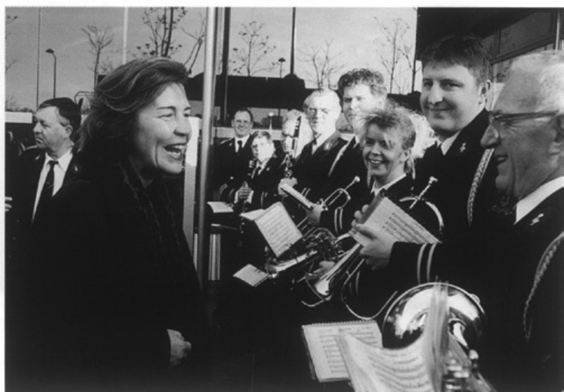
Minister Netelenbos had bij de opening van het Rijkswaterstaatgebouw nog even tijd voor een praatje

Minister Tineke Netelenbos van Verkeer en Waterstaat opent op 18 januari het nieuwe gebouw van Rijkswaterstaat op het Céramiqueterrein. Het gebouw is ontworpen door de architect Hubert-Jan Henket. Voor de 500 werknemers zijn slechts 90 parkeerplaatsen beschikbaar in de hoop dat de werknemers meer van het openbaar vervoer gebruik zullen maken. Het oude gebouw van Rijkswaterstaat aan de François de Veijestraat zal worden aangekocht door de gemeente Maastricht, om daar straks bij de uitvoering van het Markt-Maas project haar ambtenaren te kunnen huisvesten.