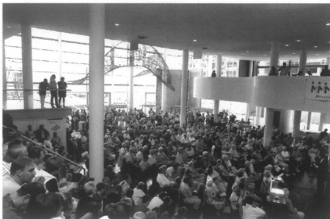
De bewoners van Heugemerveld maken op 7 juni massaal gebruik van de mogelijkheid om in het Centre Céramique van Lei Meisen voorlichting te krijgen over de toekomst van hun wijk

Op 22 juni vindt het stedelijk muziekfeest plaats. Alle door de gemeente gesubsidieerde drumbands, klaroenkorpsen en majorettegroepen moeten hier acte de présence geven willen zij voor deze subsidie in aanmerking komen. Tevens wordt dit feest gebruikt om de beste vereniging uit te kiezen. Dit jaar krijgt voor het eerst in het bestaan van de stedelijke muziekfeesten een majorettegroep de eerste prijs: de majorettes van fanfare Sint Martinus.