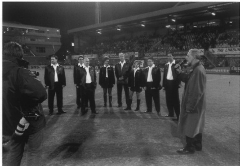
't Merretkoer wordt bij MVV gehuldigd