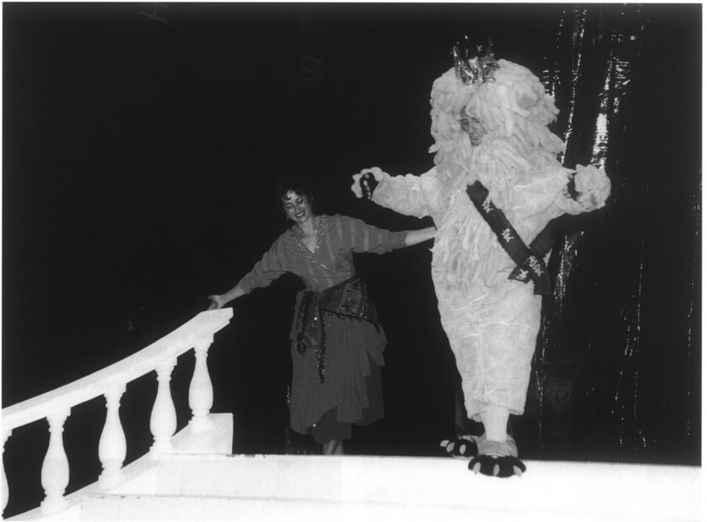
Op 23 oktober viert Opéra Comique Maastricht haar 10 jarig bestaan met een hilarische modeshow in La Bonbonnière