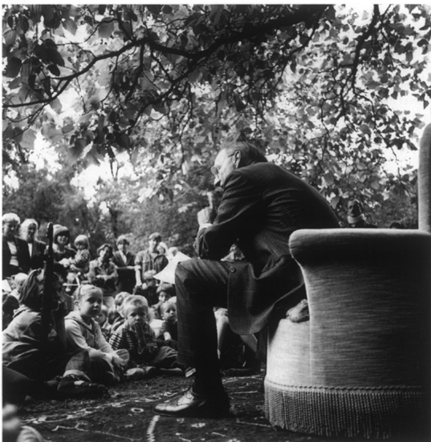
De burgemeester leest voor