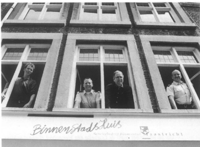
Op 18 november wordt het 'Binnenstadshuis' geopend, een politiepost op de Markt