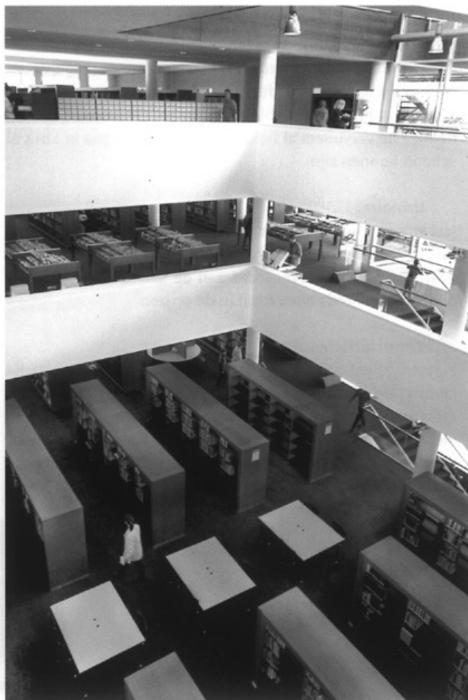
Het Centre Céramique • Foto Focuss 22

Na de openstelling loopt het op 31 mei mis. Spontaan begint een spoeikop van de brandbeveiliging te werken en er ontstaat behoorlijk wat waterschade aan de bibliotheekcollectie en inventaris. 3.000 natte boeken en vele tonnen schade.