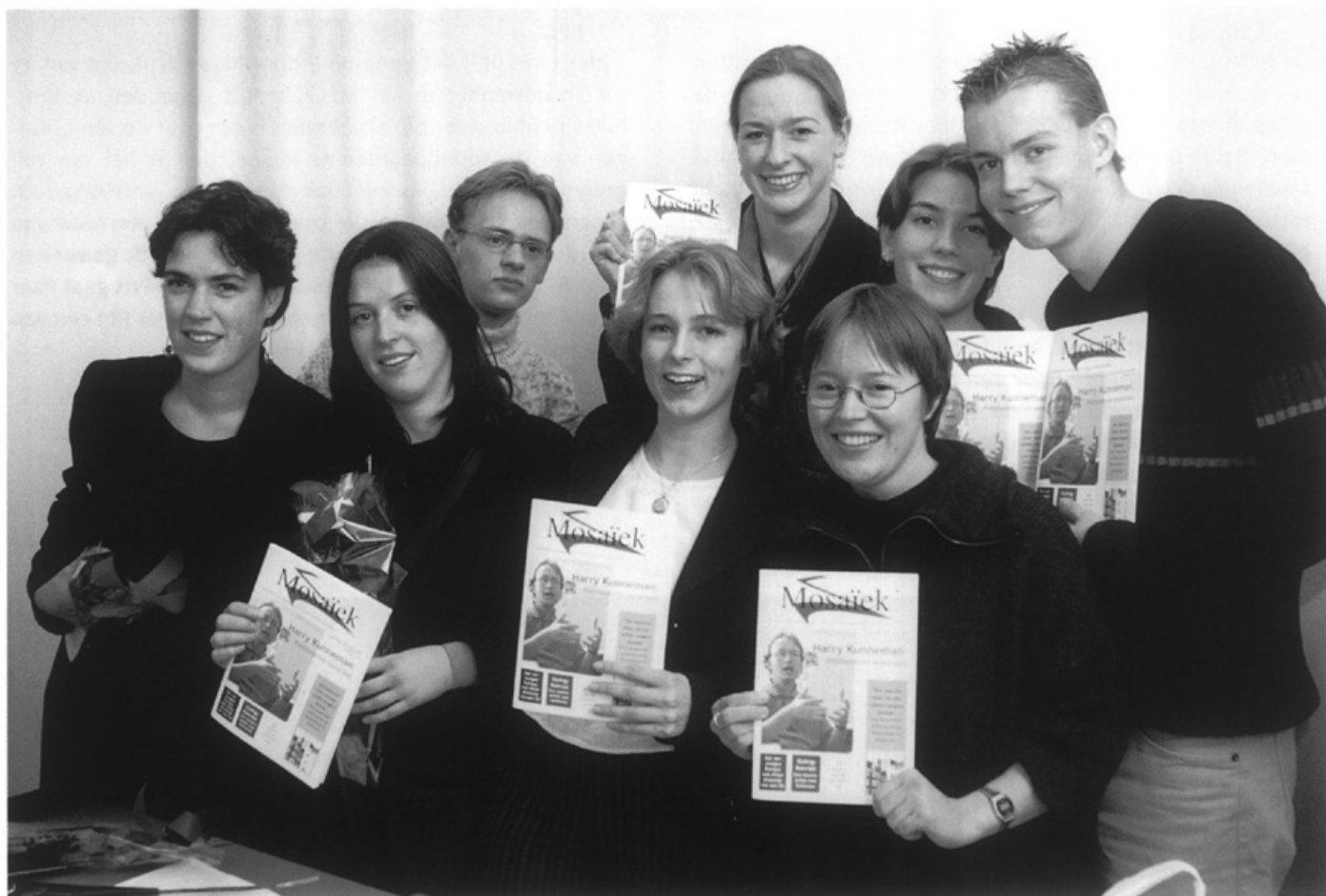
Op 1 december wordt een nieuw universiteitsblad door de trotse redactie in het Bonnefantenmuseum ten doop gehouden: Mosaïk • Foto Focuss 22