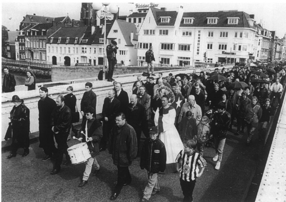
De stille tocht voor Kosovo • Foto Focus 22