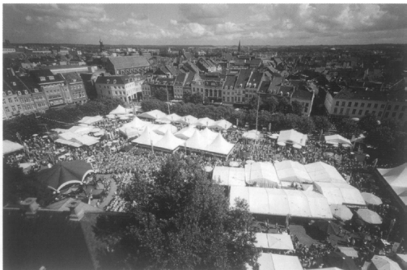
Preuvenemint • Foto Paul Mellaert