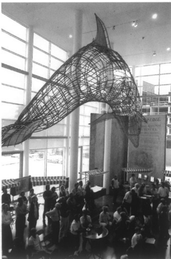
Het Centre C ramique