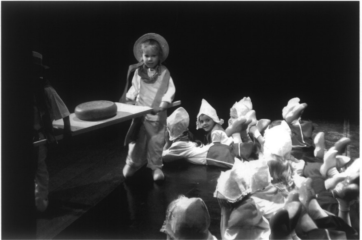
Het Ambinoballet in actie

komende illegale taxibedrijven: zogenaamde snorders. Deze bedrijven zoals Taxi Frenske, Quick service, Taxi Bennie en Taxi Huubke rijden zonder vergunning en betalen geen belasting. Door hun lage tarieven halen zij klanten bij de bonafide taxibedrijven weg.