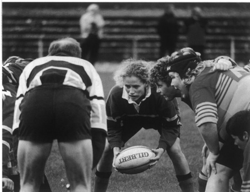
Maastricht heeft een eigen vrouwenrugbyteam: De Margrieten