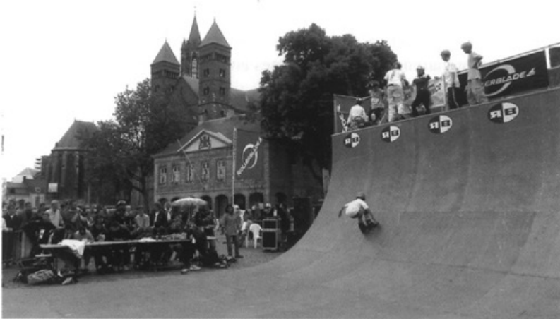
Inline skating • Foto Focus 22

Op 24 mei wordt in Maastricht een 5 km lang parcours uitgezet, voor een marathon van 42 km voor 2.000 tot 3.000 skaters, de moderne vorm van rolschaatsen. De finish is op het Vrijthof waar tevens demonstraties zijn van een stuntteam, inline skate modeshows en een hindernisparcours. De commercie in de vorm van Radio Veronica en Liptonice is nadrukkelijk aanwezig.