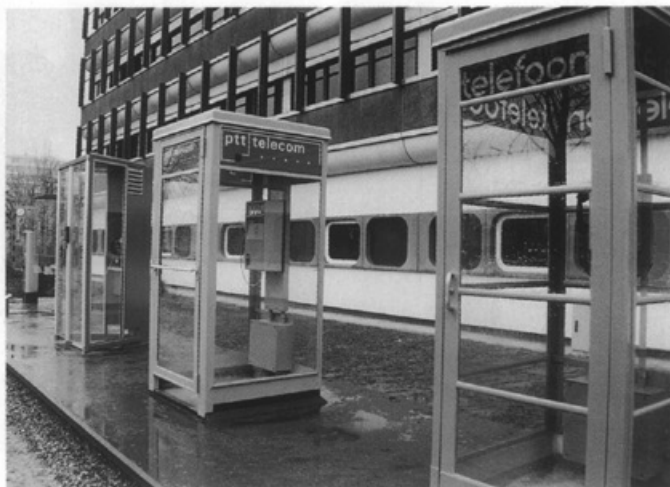
Bij het afscheid van Theo Westgeest, als directeur van PTT Telecom Maastricht, wordt op 29 januari een 'telefoocellengalerij' geopend op het terrein van PTT Telecom

De BBB, de jaarlijkse horecavakbeurs in Maastricht, een der grootste beurzen in het MECC, kent eind januari alleen maar superlatieven. Het grootste aantal bezoekers ooit: 34.676. Er werden 725 parkeerboetes uitgedeeld, slechts 2 bekeuringen voor alcoholgebruik op een controle-aantal van 35 en 1.100 deelnemers aan een preventieve alcoholcontrole. Tijdens de beurs wint Roger Spee van café Murphy's aan het Vrijthof de prijs voor het best getapte pilsje.