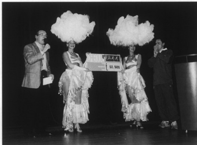
De overhandiging van de cheque van 'Zweit veur Leid' aan Rapid • Foto Focuss 22

Op 8, 9, en 10 januari vindt de 12de VIB, de vakantiebeurs in het MECC plaats. Dit jaar is het vloeroppervlak van een hectare, wegens succes met 10.000 vierkante meter uitgebreid, verdubbeld dus.