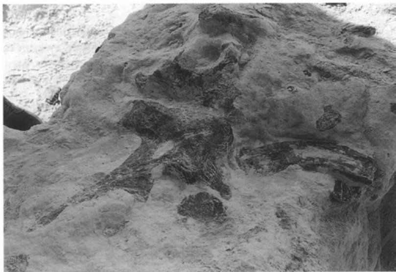
Mosasaurusresten in de mergelgroeve

Paleontologen vinden op het terrein van de ENCI de resten van een heuse mosasaurus. Naar schatting zijn ze 65 miljoen jaar oud. In de 18e eeuw werd ook een mosasaurus gevonden, maar die werd in 1794 door de Fransen meegenomen naar Parijs en is nooit meer teruggekomen.