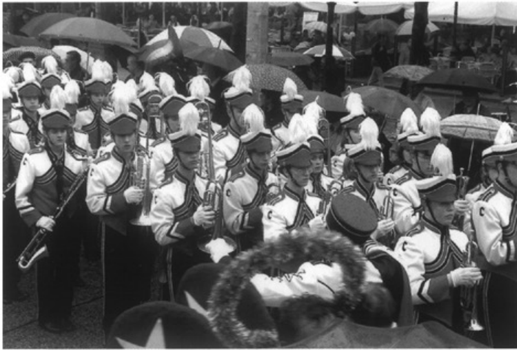
Easter Parade • Foto Focuss 22