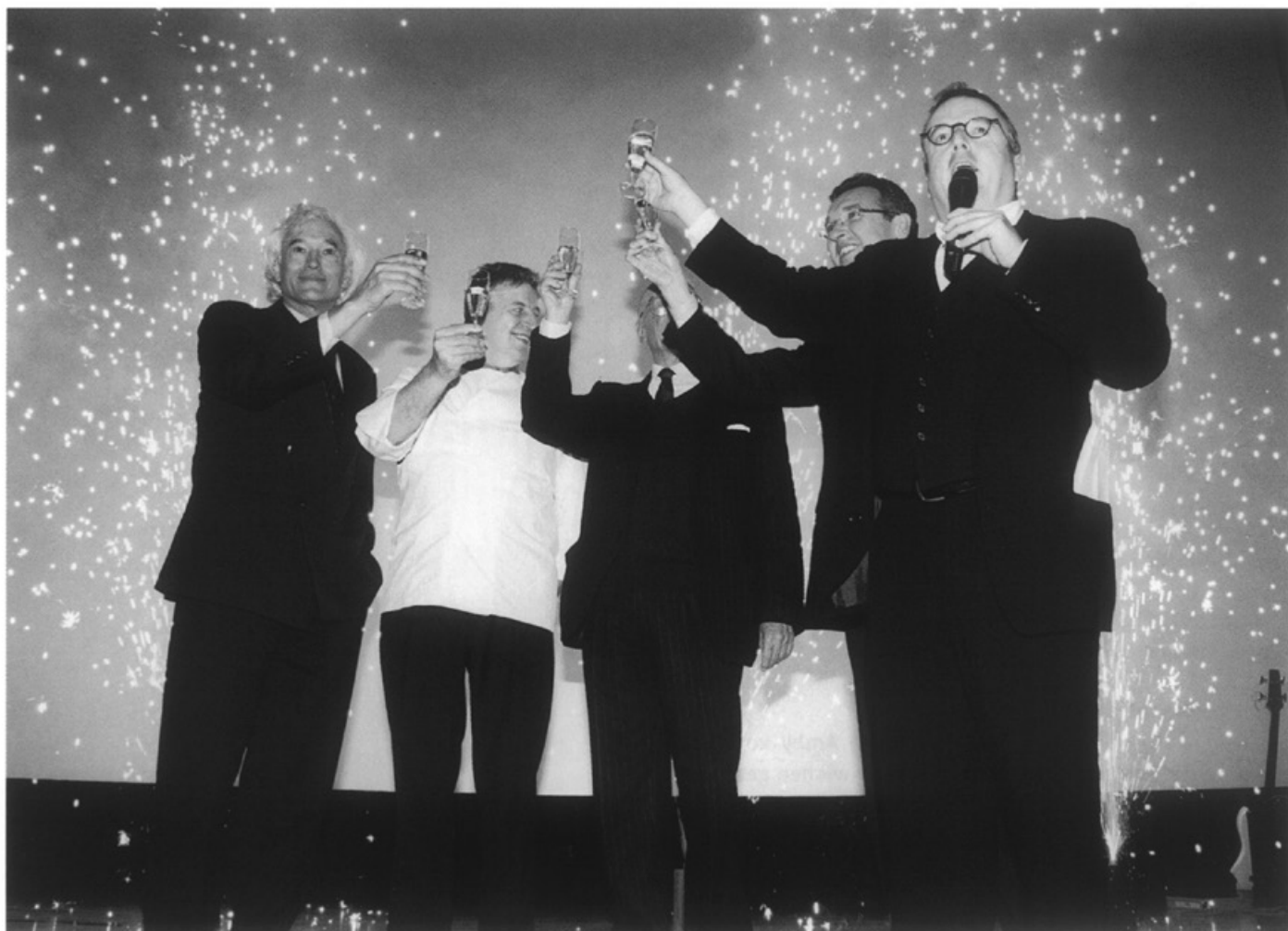
De officiële opening van de Westhal van het MECC op 1 februari