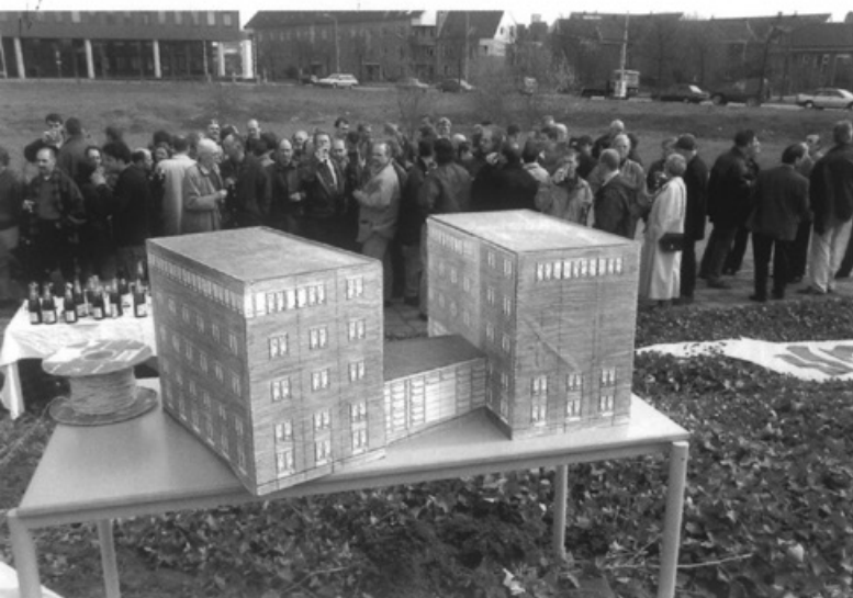
Zo gaat de nieuwe vestiging van Woonpunt er uit zien

Op 17 maart maken de Woningstichting St. Matthias en Woningvereniging Beter Wonen bekend dat zij per 1 januari 2000 zullen gaan fuseren. Zij willen zich vestigen in het plangebied Noordwest-Entree. Deze locatie komt pas op termijn beschikbaar. Vooruitlopend hierop vestigen de vereniging en de stichting zich op het Randwyckterrein in een door RO groep/Codacq ontwikkeld kantorencomplex. Hier van nemen St. Matthias en Beter Wonen er twee in beslag. Om de fusie daadwerkelijk tot uitdrukking te laten komen worden de gebouwen op de begane grond en eerste verdieping met elkaar verbonden. De nieuwe organisatie gaat Woonpunt heten.