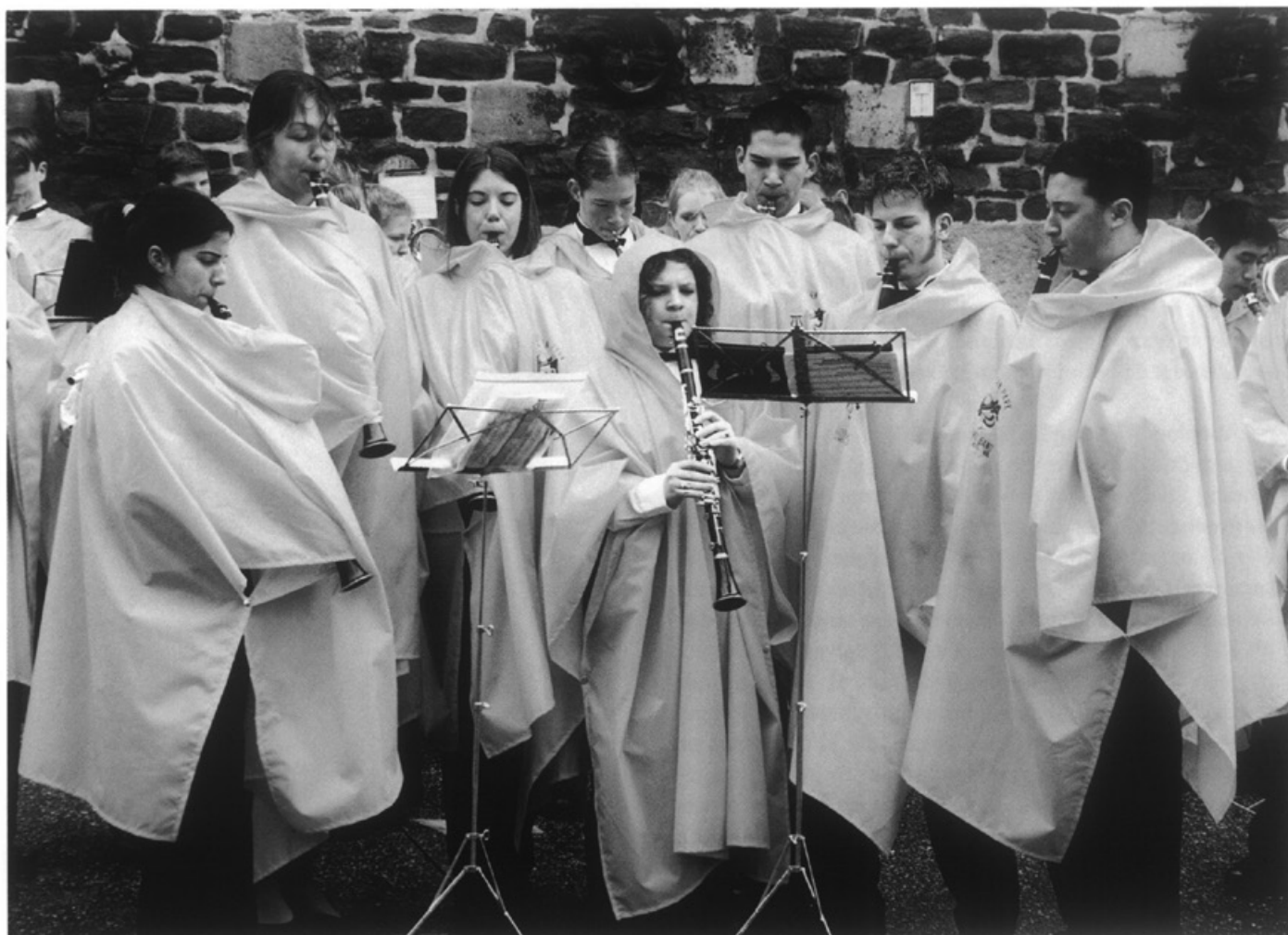
Easter Parade • Foto Focus 22