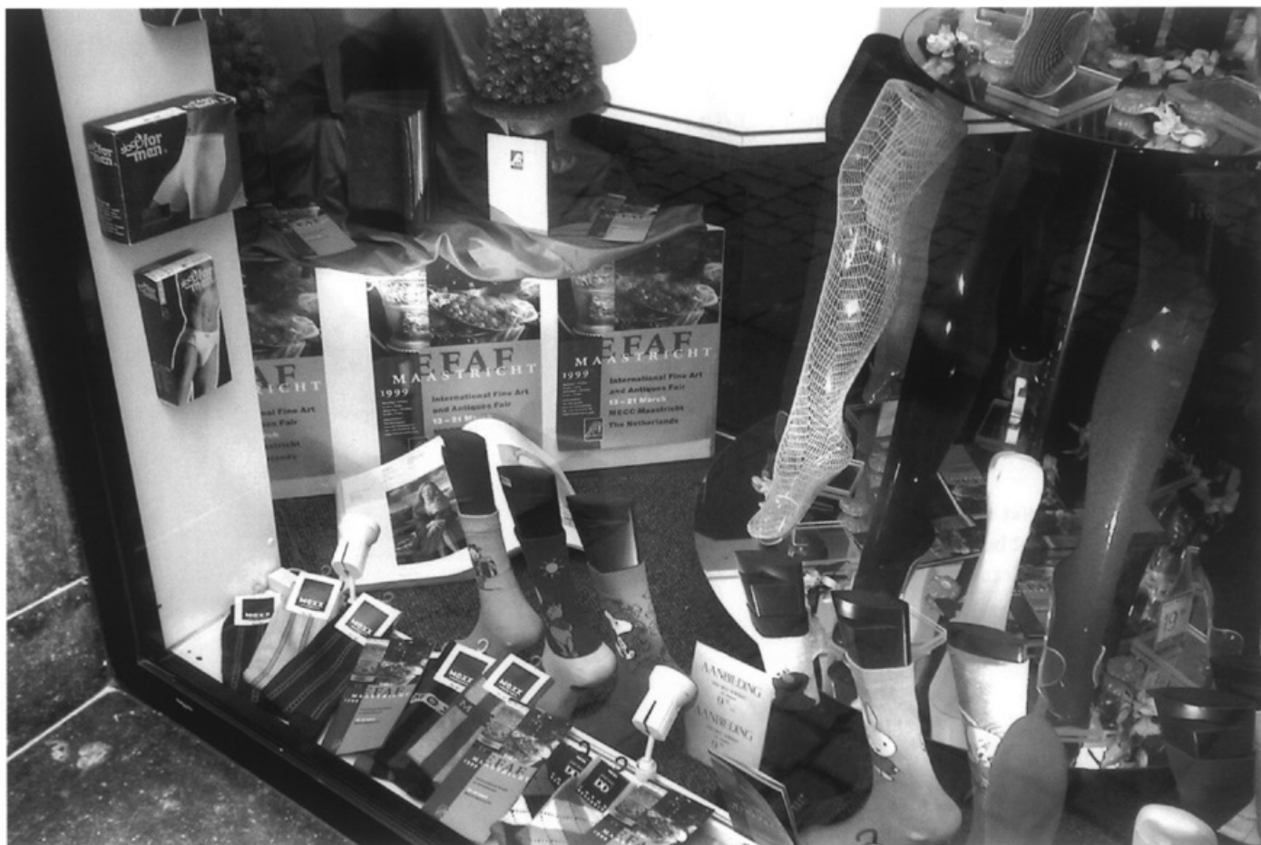
In de stad wordt een TEFAF etalagewedstrijd gehouden