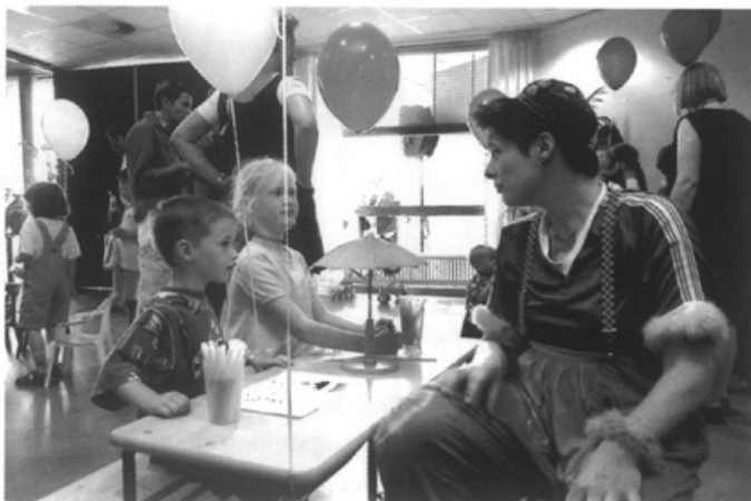
De opening van het Griendpark