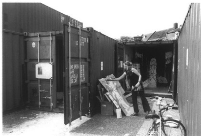
Coup Maastricht

Het Centre Céramique krijgt een goede start. Sinds de opening hebben zich 600 nieuwe leden aangemeld bij de Stadsbibliotheek. Het Sint Maartenscollege huurt twee verdiepingen in het centrum om de schoolbibliotheek te herbergen en enkele keren per week een tachtigtal leerlingen op te vangen. Deze kunnen niet langer op school terecht, vanwege de aanpassingen en verbouwingen die de school moet uitvoeren om het 'studieland' te realiseren, de nieuwe bovenbouw van havo en vwo. Ook na de verbouwing ligt het in de bedoeling dat de leerlingen gebruik blijven maken van de faciliteiten van het centrum. Centre Céramique hoopt dat meer scholen dit voorbeeld zullen volgen.