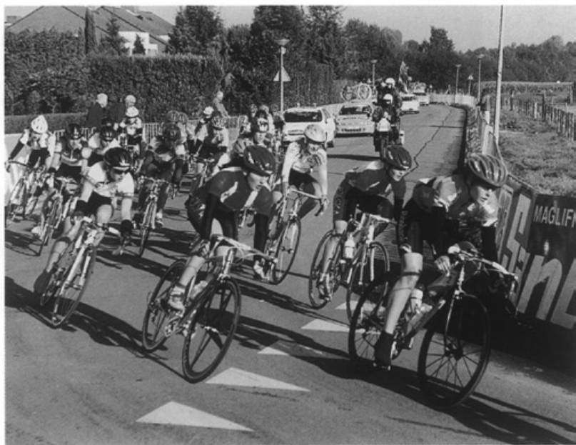
WK wielrennen •