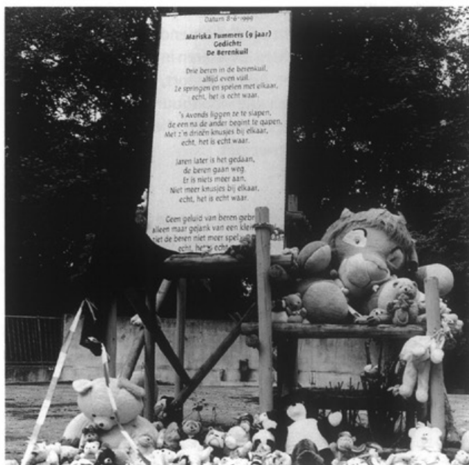
De berenknuffels en andere bijdragen van kinderen aan het vertelfestival