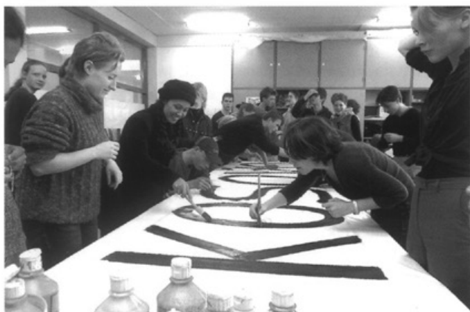
De Bernard Lievegoedschool aan het werk voor Kososvo