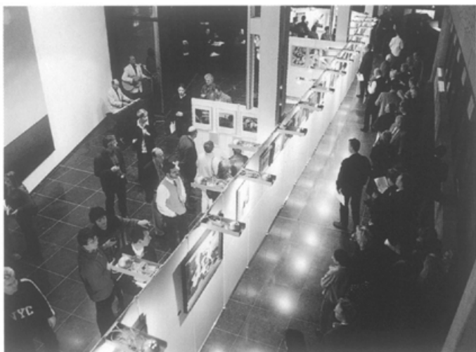
'Blauw aan de muur'. Een fototentoonstelling in het Politiebureau Maastricht op 29 oktober