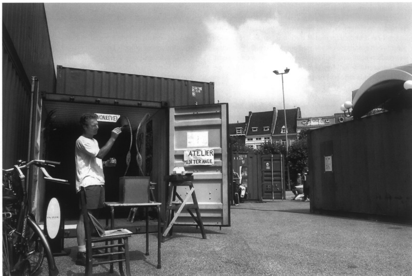
Coup Maastricht