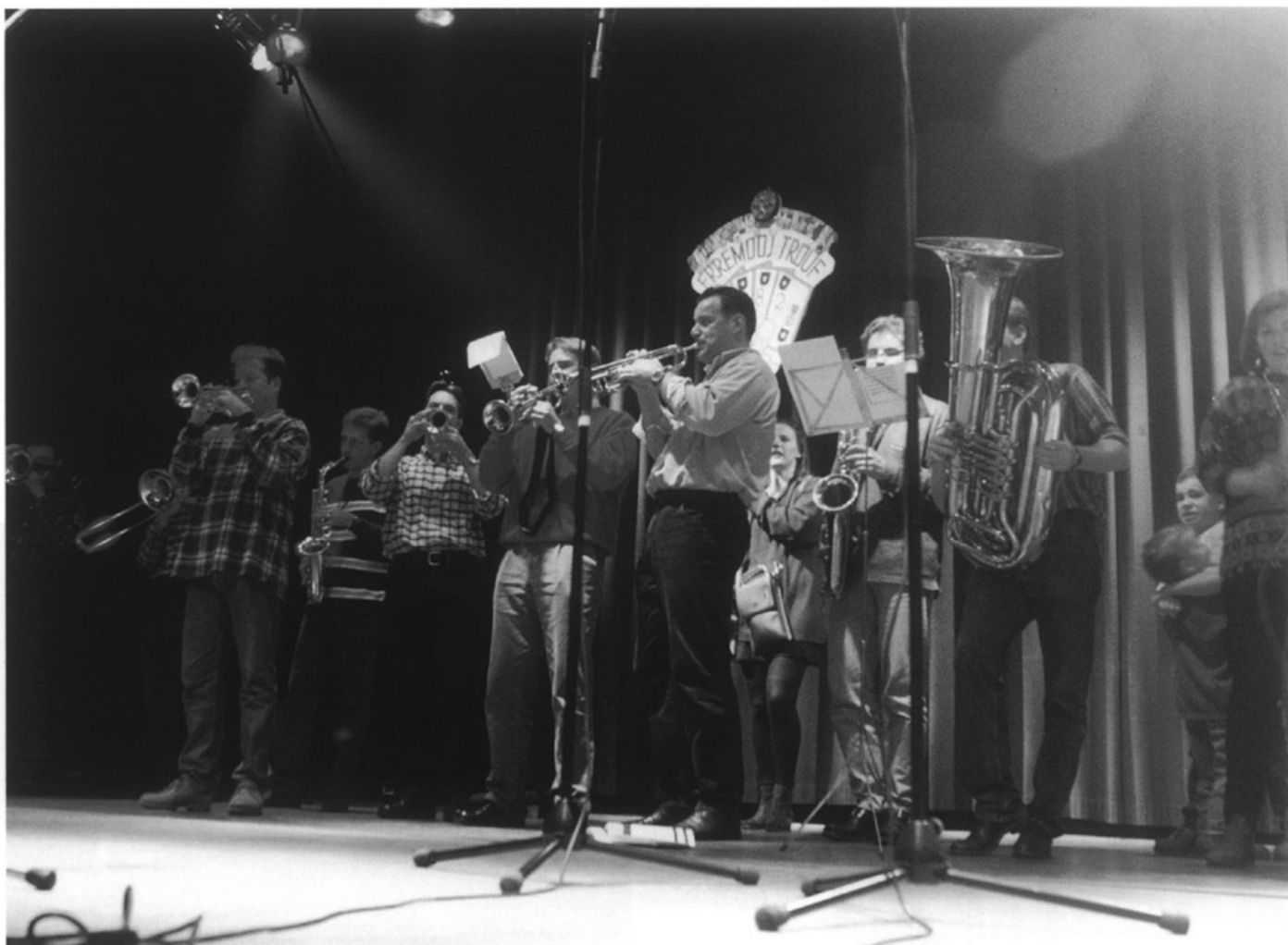
De Zaaite Hermeniekes nemen op 15 november in de Platte Zaal een eigen CD op