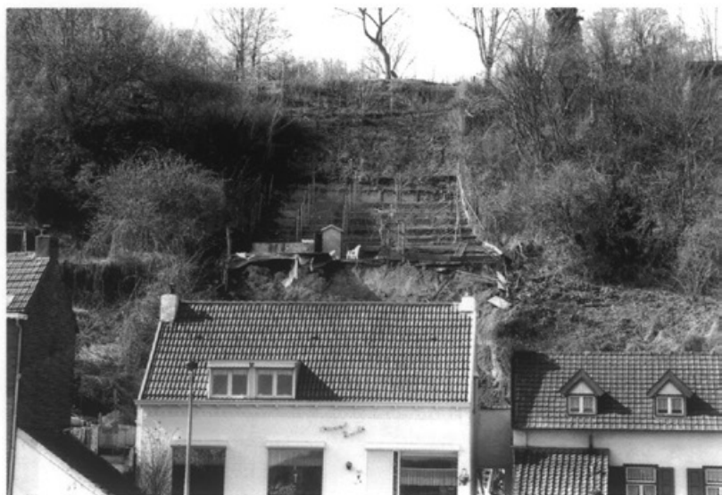
Het ingestorte talud van de Sint Pietersberg

Maas Zicht heeft de ENCI en Bouwtoezicht van de gemeente gewaarschuwd. Deze hebben alleen maar kunnen constateren dat er een levensbedreigende situatie ontstaan is. Vlak daarna komen tientallen kubieke meters grond naar beneden. Deskundigen van de ENCI verwachten dat er minstens 20 meter bergwand afgegraven moeten worden om toekomstig gevaar uit te sluiten.