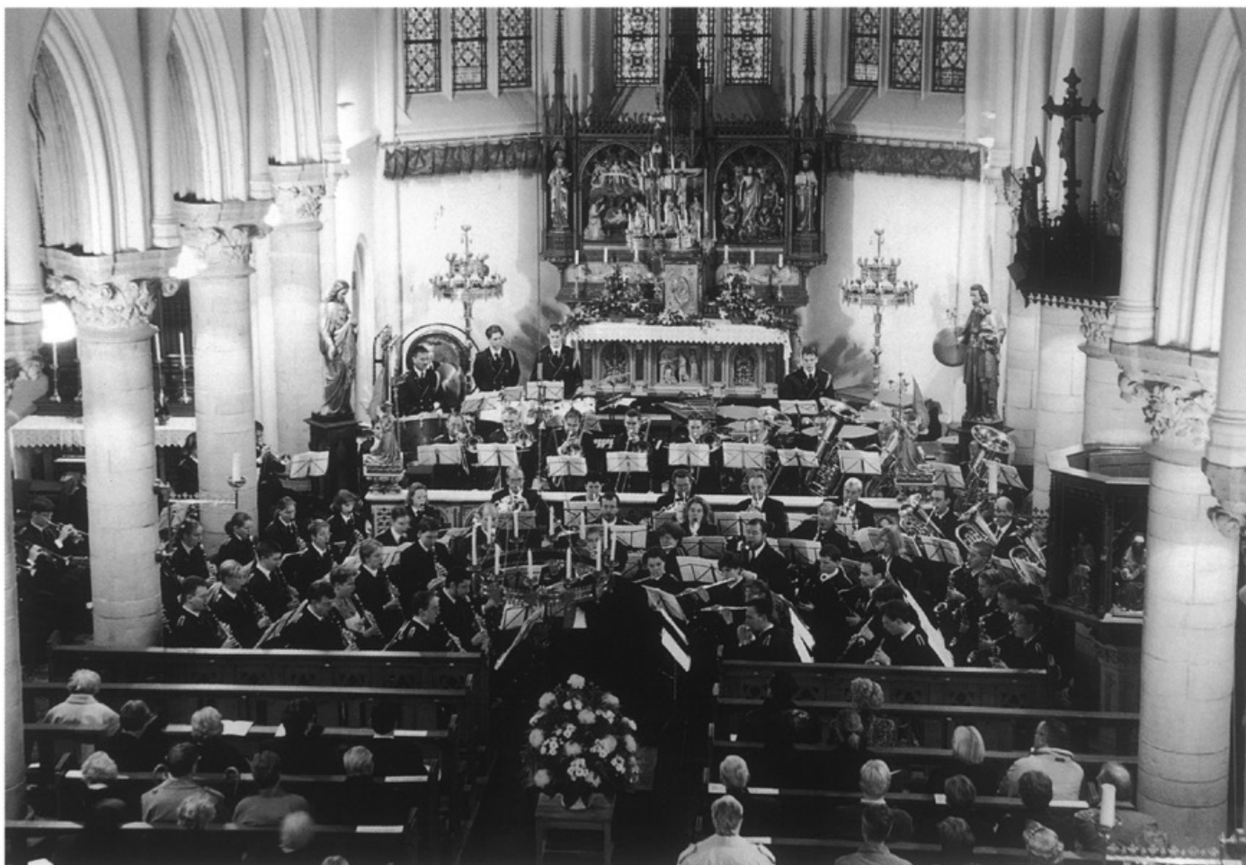
Op 8 november viert Harmonie Wilhelmina haar 90-jarig jubileum