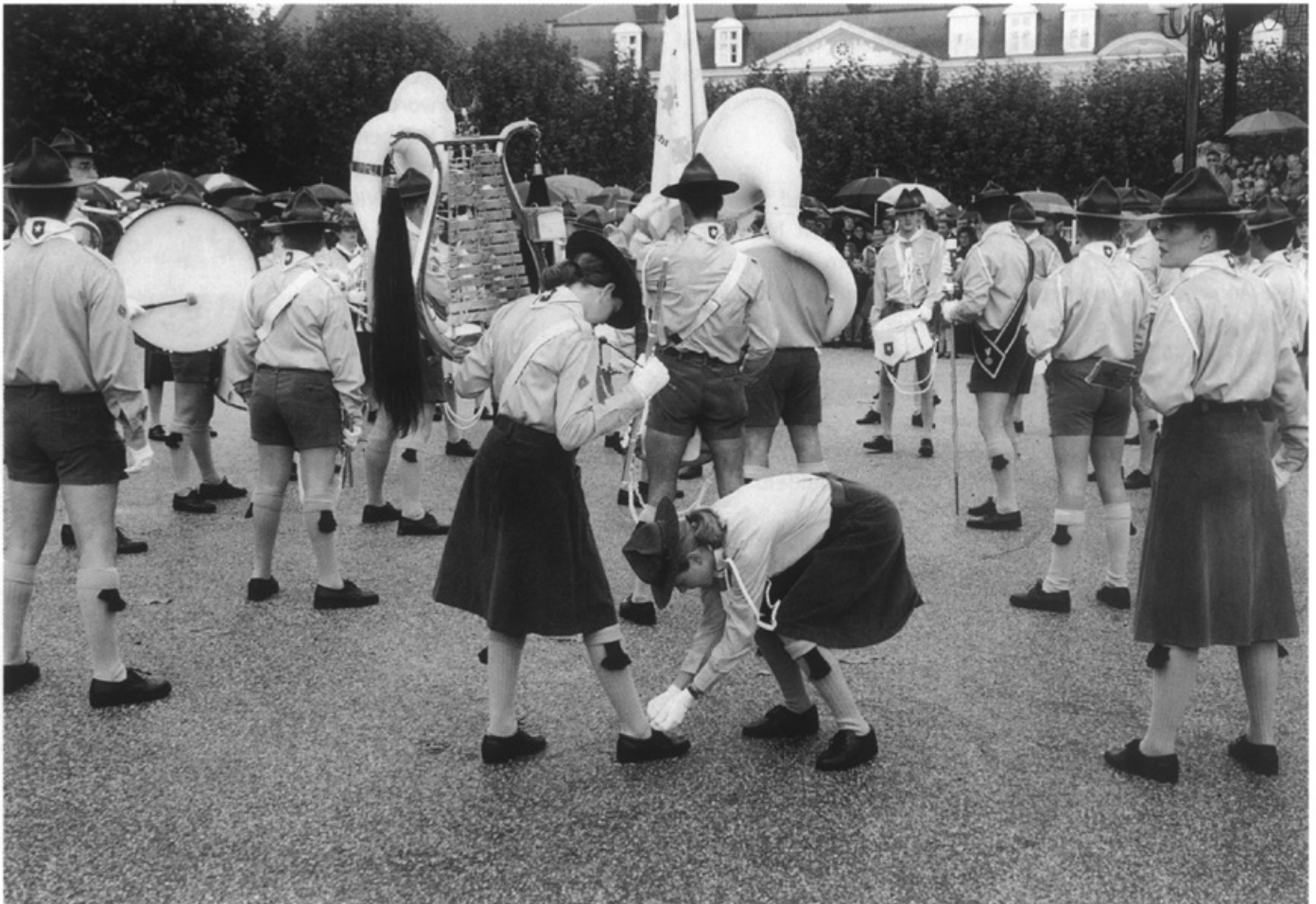
De jubilerende Verkennersband (45 jaar) op het Vrijthof

Van 16 tot en met 18 oktober vindt in 25 café's in het Jekerkwartier het Jeker Jazz Festival plaats. Er doen zo'n 40 jazzbands aan mee en het festival trekt ruim 20.000 bezoekers.