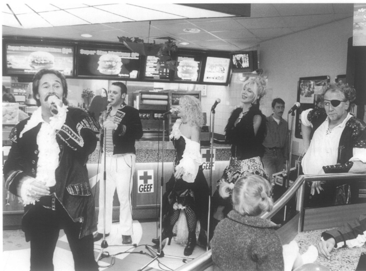
Ziesjoem treedt op in MacDonald's om in samenwerking met het Rode Kruis Maastricht geld in te zamelen voor Kosovo