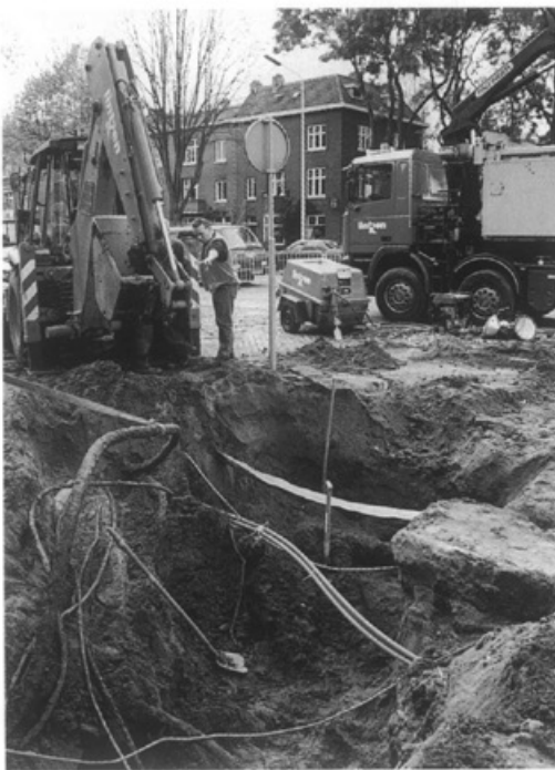
Een breuk in de waterleiding slaat op 8 november een enorm gat in de Hertogsingel

Op 5 november gaat het McLuhan Instituut van start, wederom een internationaal instituut in Maastricht. Het instituut is genoemd naar de Amerikaanse mediagoeroe Marshall McLuhan en gaat zich richten op digitale cultuur, kennisorganisatie en onderwijstechnologie. Het is tot stand gekomen dankzij de samenwerking van de Universiteit Maastricht, Hogeschool Maastricht, Hogeschool Limburg, Universitair Centrum Diepenbeek en het LIOF.