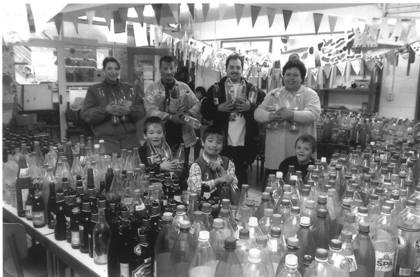
De flessenzamelactie in het Wittevrouwenveld

Wat het Struyskommittee niet meer lukte krijgt het Zweites Deutsches Fernsehen wel voor elkaar. André Rieu speelt nog een keer in Maastricht. Op 18 april geeft hij samen met het Straussorkest een uur lang een gratis concert op het Onze Lieve Vrouweplein. Met geld is alles mogelijk.