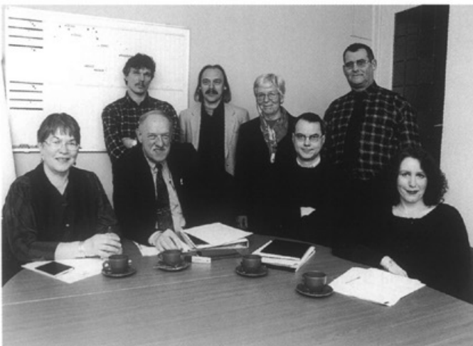
Het bestuur van huurdersvereniging de Servaassleutel

De gemiddelde huurverhoging voor de 12.360 huurders van Woning Stichting Sint Servatius blijft voor het eerst sinds mensenheugenis onder de 3 %. Lage rente en inflatie zijn hier de oorzaak van. Tevens sluit St. Servatius een nieuwe samenwerkingsovereenkomst met de 3.300 leden tellende huurdersvereniging Servaassleutel. Deze vertegenwoordigt nu alle huurders in het overleg met St. Servatius. Er wordt nog een nieuwe vereniging opgericht waar St. Servatius mee te maken krijgt: de Belangenvereniging Inwoners Heugemerveld. De kopers van de woningen, die in plaats van de gesloopte en te slopen 300 noodwoningen in het Heugemerveld komen, gaan hun krachten bundelen. Ook diegenen, die 200 huurhuizen van Sint Servatius in de wijk willen gaan kopen sluiten zich hierbij aan.