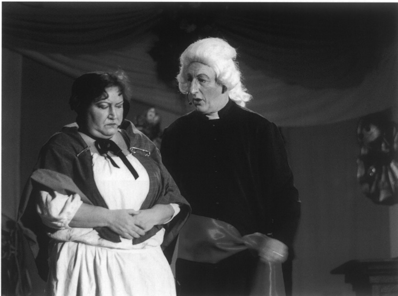
Het Mooswief en Minckelers uit de revue van de Prinsenzitting

moeilijkheden te kampen hebben. Dagelijks hebben in Maastricht ongeveer 200 mannen en vrouwen behoefte aan opvang. Tien huizen in de stad bieden die mogelijkheid.