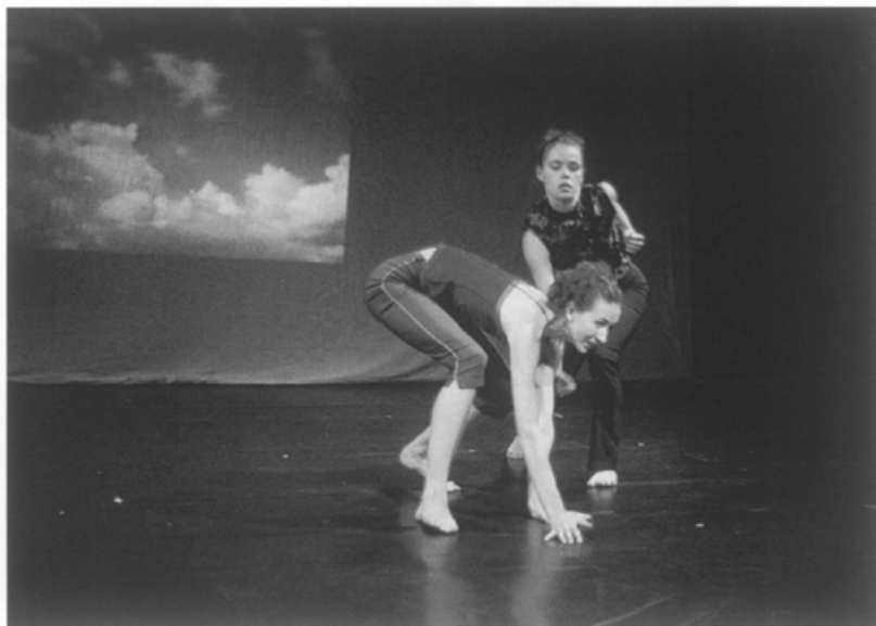
Op 22 oktober 'Trip Tych' internationaal danstheater in het Löss Theater

In de derde week van oktober verhuizen het College van Bestuur en het Rectoraat van de Universiteit, samen met een aantal diensten, naar het gebouw van de vroegere rechtbank op de Minderbroedersberg, dat een grondige verbouwing heeft ondergaan. Het voormalige Gouvernementsgebouw aan de Bouillonstraat zal onderdak gaan verlenen aan de Faculteit der Rechtsgeleerdheid, terwijl alle bibliotheken van de in de binnenstad gevestigde faculteiten zullen verhuizen naar de Nieuwenhof. Deze fase in de 'universitaire verhuiscarousel' vindt plaats zodra de Maastrichtse Stadsbibliotheek naar de nieuwe Stadshal op het Céramique-terrein is vertrokken.