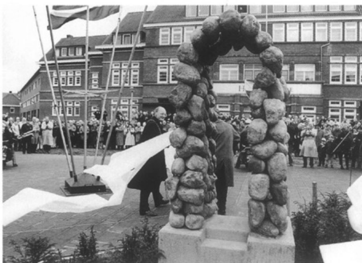
Het Veldeke Memorial