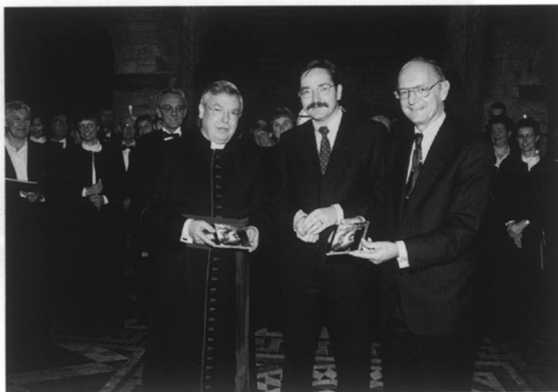
Cappella Sancti Servatii presenteert op 8 november haar Kerst-CD

De gemeente stelt meer dan een half miljoen gulden beschikbaar om de Sphinx-collectie, die nu nog in verschillende depots ligt opgeslagen, onder te brengen in de Stadshal op het Céramique-terrein. Om deze keramische collectie te kunnen exposeren zal in de Stadshal een speciale vitrine van 35 meter lang worden gebouwd. De Sphinx heeft de collectie in bruikleen aan de gemeente afgestaan.