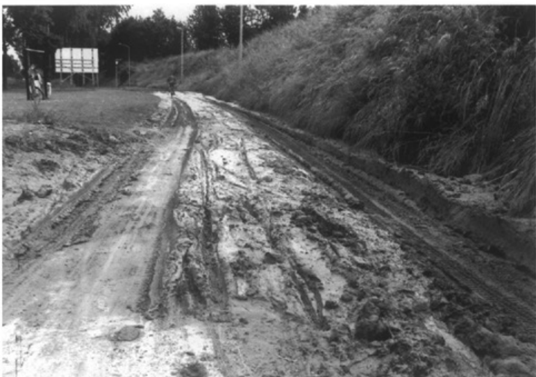
Dank zij de aanhoudende regenval komt in Wolder op 31 mei een mod- derstroom naar beneden