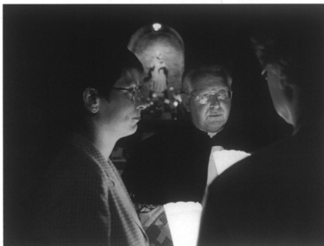
Lichtprocessie in Borgharen • Foto Focus 22

Op 24 september trekt er door Borgharen een lichtprocessie tegen het geweld in de wereld.