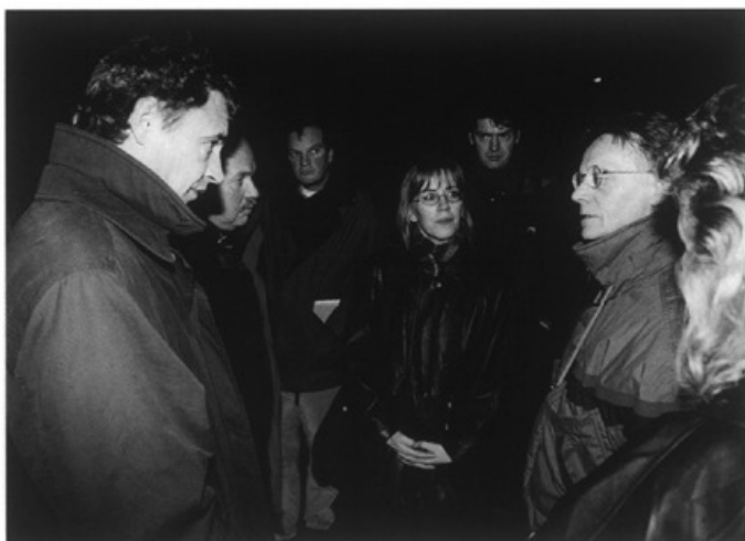
Minister van Boxtel bezoekt het Heugemerveld

Woningbouwvereniging St. Servatius besluit de verhuisprijs voor de gedwongen verhuizing van de bewoners van de te slopen woningen in Heugemerveld na veel touwtrekken te verhogen van f 3.500,- naar f 5.000,- en uiteindelijk naar f 7000,- per verhuizing.