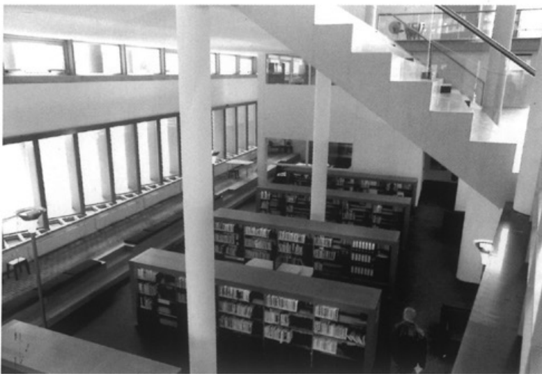
Centre Céramique • Foto Focuss 22