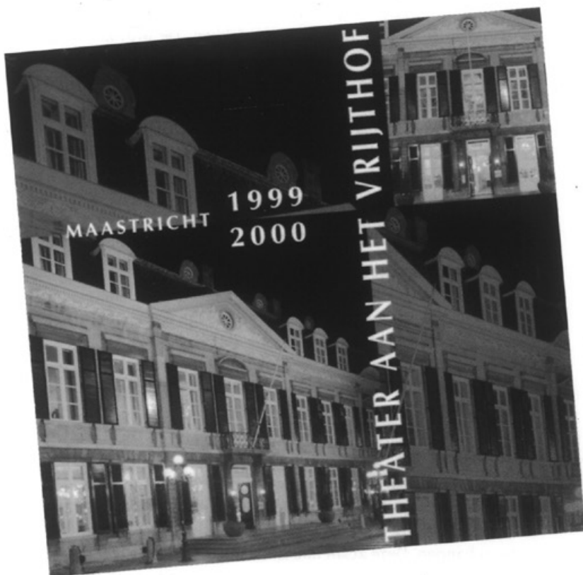
de CD hoes van het Theater aan het Vrijthof

theaterproducties, die het komende seizoen in Maastricht worden uitgevoerd. De CD-Rom kost tien gulden en het publiek krijgt aan de hand van de 300 fragmenten een veel betere indruk dan het programmaboekje kan bieden.