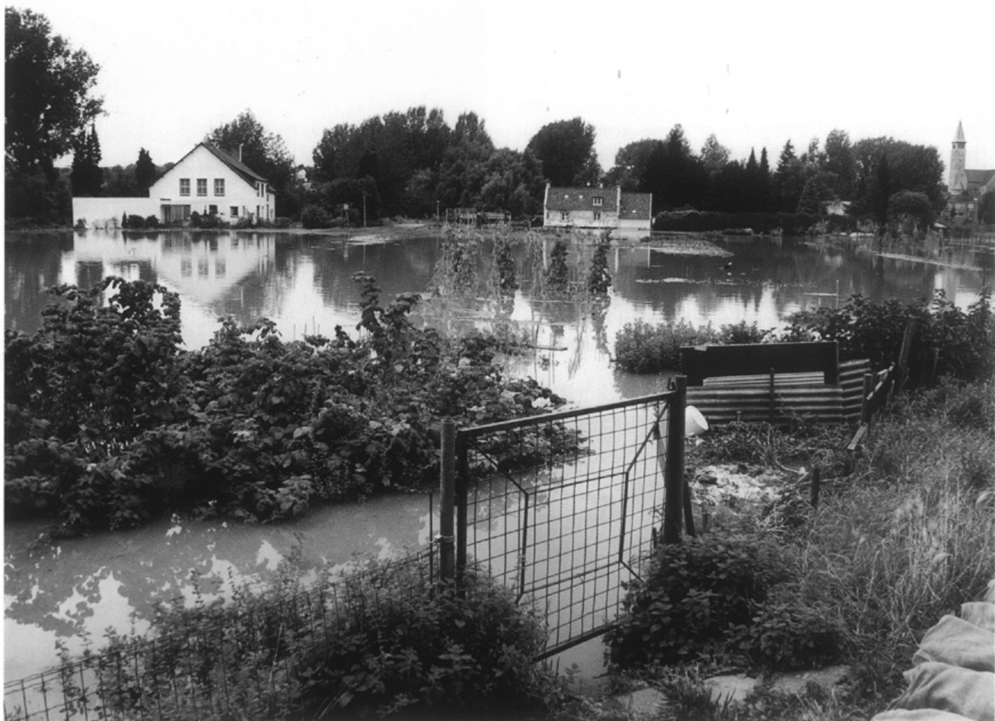
Jekerplas • Foto Focuss 22