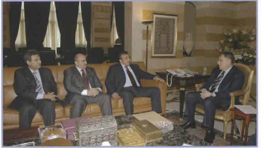
فؤاد السنيورة مستقبلاً الوفد الكويتي

وأضاف ان السنيورة «كان على اطلاع كامل بتوزيع هذه المنحة على كل مناطق لبنان لاسيما الوسط والجنوب، وقدمنا شرحاً للمشاريع التي وقعت سابقاً والتي لم تنفذ والمشاريع وخططنا المستقبلية التي هي قيد التنفيذ في الوقت الحالي»، ونقل عن السنيورة تأكيده أهمية متابعة المشاريع التنموية التي تمويلها دولة الكويت في لبنان.