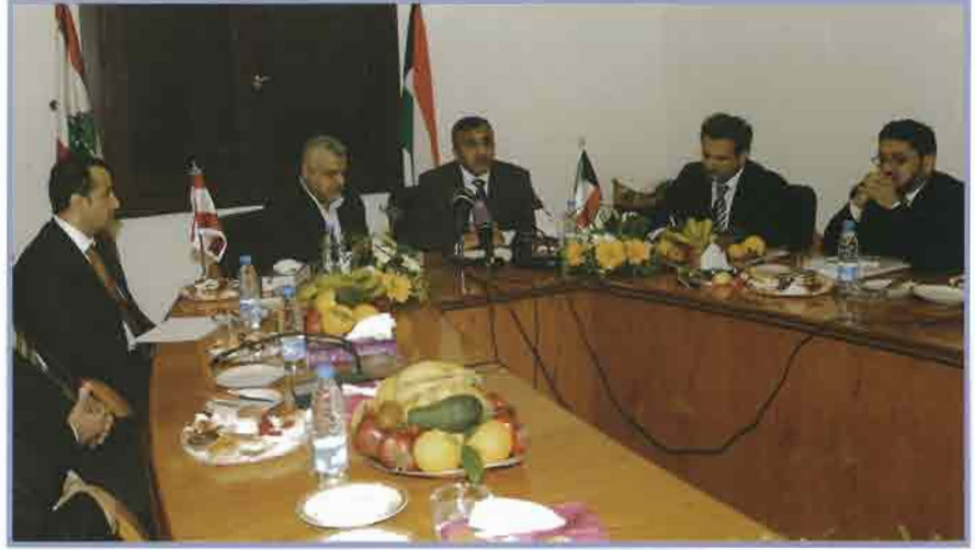
المدير العام خلال مباحثاته مع رئيس وأعضاء اتحاد بلديات الضاحية الجنوبية

ويتكون المشروع من إنشاء مرافق رياضية متنوعة.