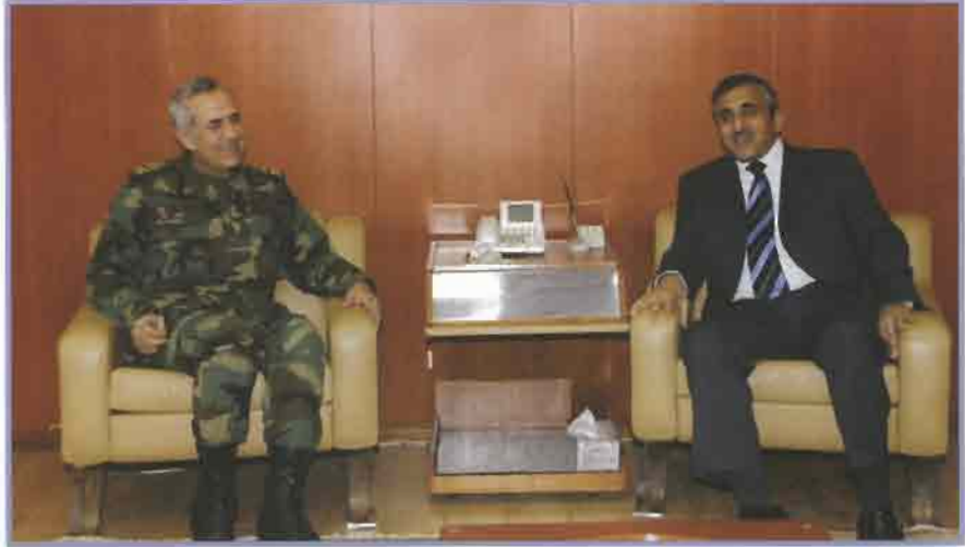
المدير العام خلال لقائه قائد الجيش السابق و الرئيس الحالي للبنان

بمراكز ودور الأيتام ورعاية المياه في صور وبعلبك مشروع لمتحف قانا وتجهيز مكتبة مشاريع منهجة الدراسة الموازية لمدارس بيروت مع وزارة التربية وغيرها من المشروعات.