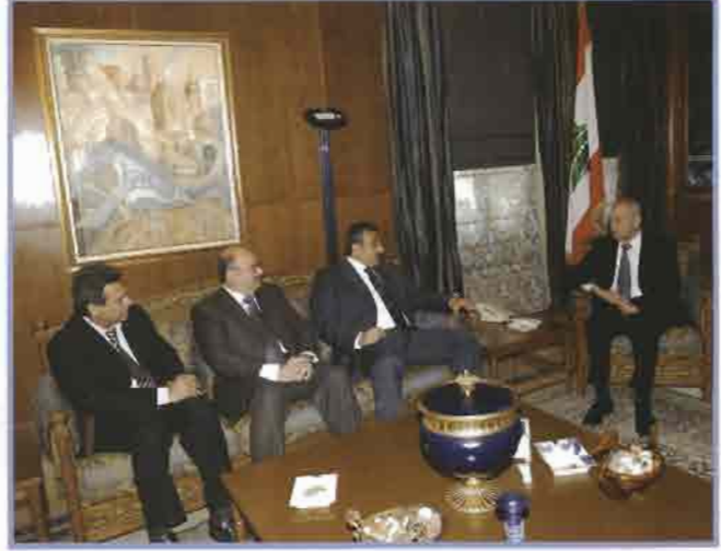
الرئيس بري لدى استقباله البدر