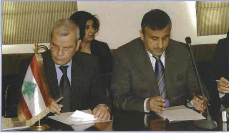
المدير العام اثناء توقيع الاتفاقيات في طرابلس

وقال ان الصندوق الكويتي للتنمية اعطى لهذه التنمية وجهها الحضاري والانساني في وقت لبنان بامس الحاجة الى هذا الدعم.