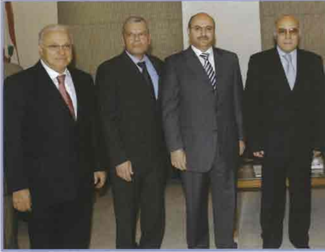
لقطة تذكارية خلال الزيارة