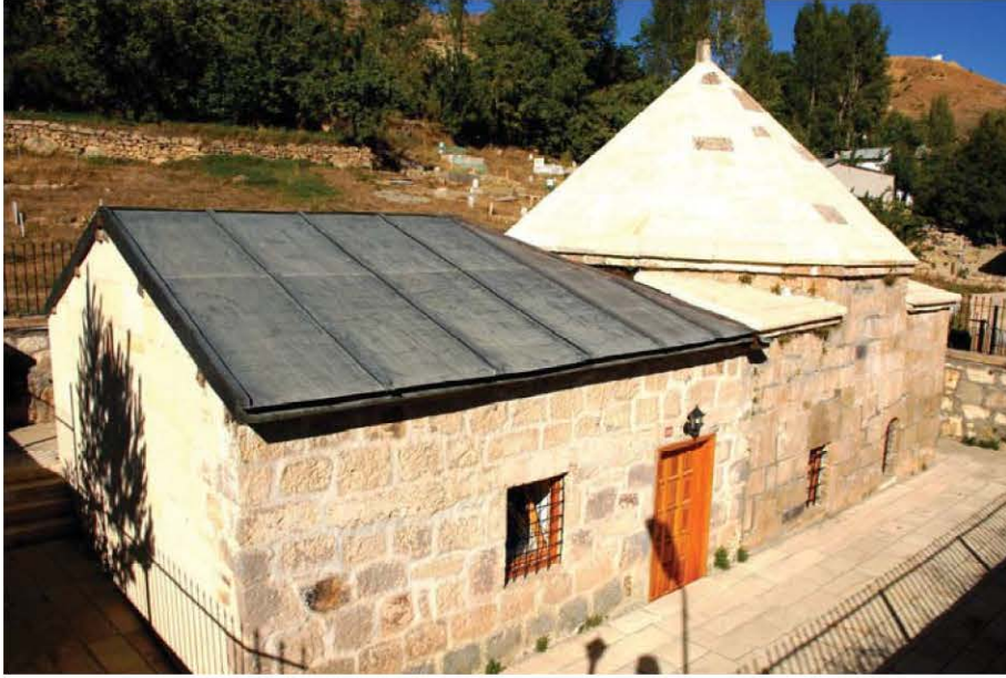
Resim-5: Seyyid Hasan Çağırğan Türbesi (Gümüşhane/Kelkit)

1830-1840 tarihleri arasında düzenlenen nüfus kayıtlarında Taşlıca köyünde oturan aile ve sülale adlarına yer verilmiş, köyün imam, muhtar ve müderrisinden söz edilmiştir. Ancak bu aileler arasında Güvenç Abdal'a izafe edilmiş bir sülale adı bulunamamıştır 66 .