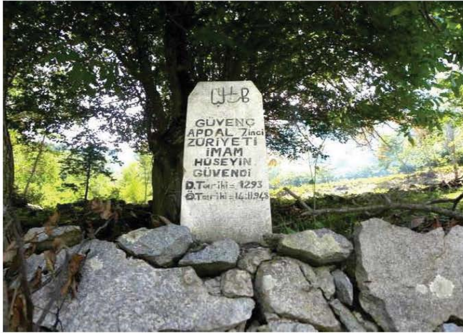
Resim-6: Hüseyin Güvendi Mezarı (Taşlıca)

Osmanlı-İran ve Osmanlı-Rus savaşları sebebiyle sürekli nüfus sirkülasyonuna muhatap olan Taşlıca köyünde oturan ve tekke vakfına bağlı camide imamlık yaptığı ifade edilen Güvendi ailesi mensuplarının künyesiyle ilgili husus ise henüz açıklığa kavuşmuş değildir. Ülkemizin birçok yerinde rastlanabilen “Güvendi” soyadının menşei meselesi 70 , daha kapsamlı bir araştırmanın konusudur. Söz konusu ailenin geçmişte “Güvenç Abdal” meşrebine mensup cemaatin bir bakiyesi olarak, sonraki tarihlerde buraya gelmiş olabilecekleri