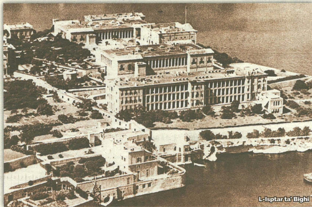
L-Isptar ta' Bighi