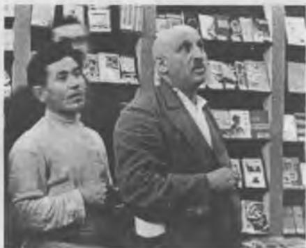
О. Пятницкий и Н. Ежов осматривают выставку Коминтерна в Доме союзов. Москва, 1935 г.