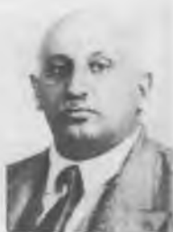
И.А. Пятницкий — оргсекретарь Исполкома Коминтерна