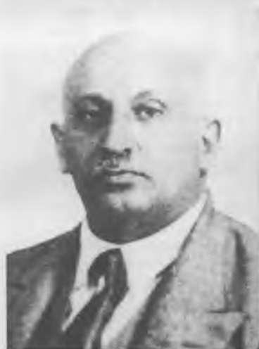
И.А. (Осип) Пятницкий