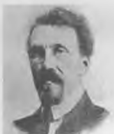
Алексей Иванович Рыков