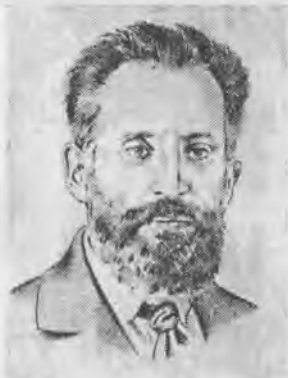
И.А. (Осип) Пятницкий — секретарь МК РСДРП(б), один из основных руководителей московского вооруженного восстания. Октябрь, 1917 г.