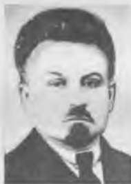
Артур Христианович Артузов — начальник отдела контрразведки (КРО) ОГПУ