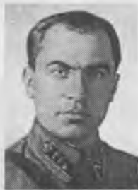
Илья Григорьевич Старинов преподаватель партизанской тактики и диверсионного дела в Военно-политической школе Коминтерна