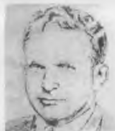
Арнольд Дейч (Стефан Григорьевич Ланг)