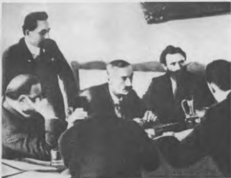
Заседание бюро ИККИ. Стоит Г. Димитров. Сидят: Д. Мануильский, О. Пятницкий и Б. Кун. 8 июля 1924 г.