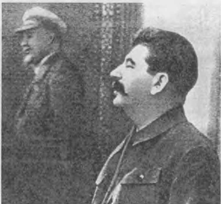
И.В. Сталин — клятвопреступник. Все свои преступления он творил на фоне портрета В.И. Ленина