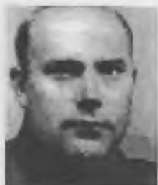
Карл Мартынович Римм (Клаас Зельман)