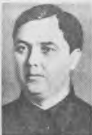
Г.М. Маленков секретарь комиссии