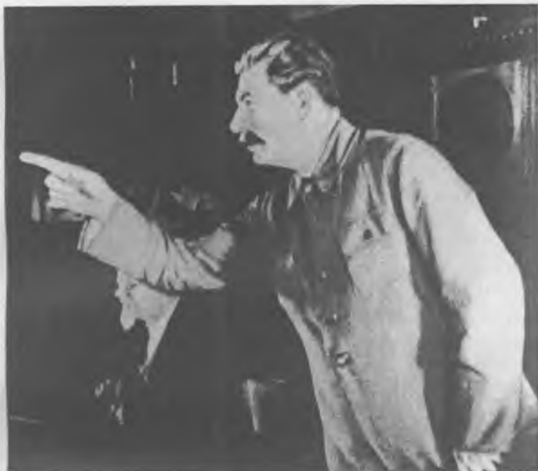
Этот «сухорукий параноик» (определение академика В.М. Бехтерева) уничтожил лучших людей ленинской партии и народов СССР