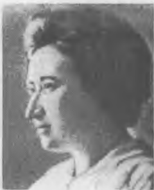
Роза Люксембург деятель германского, польского и международного рабочего движения, одна из основателей компартии Германии