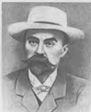
Георгий Валентинович Плеханов один из основателей РСДРП