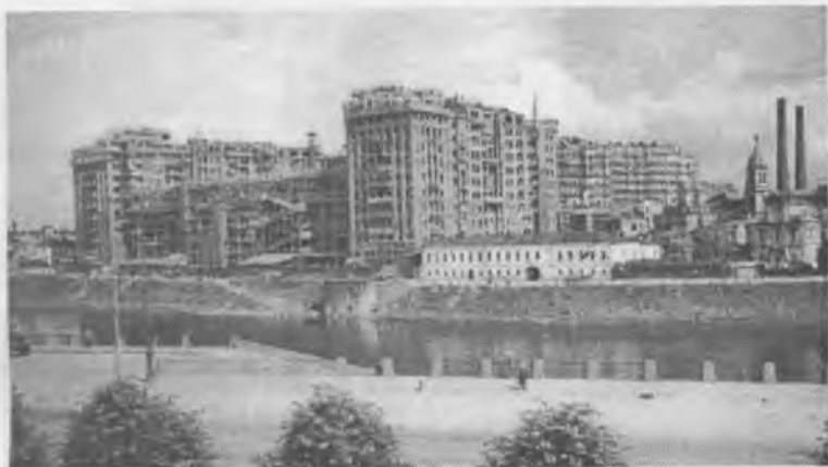
«Дом на набережной». Вид с Большого Каменного моста