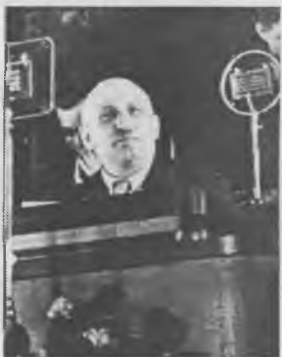
Выступление О. Пятницкого на VII Конгрессе Коминтерна