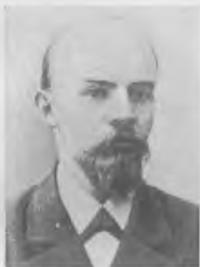
В.И. Ленин (Ульянов)