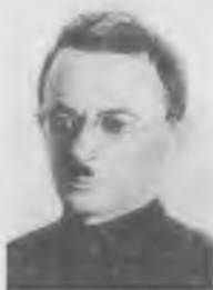
Меер Абрамович Трилиссер — начальник Иностранного отдела (ИНО) внешне- политической разведки ОГПУ