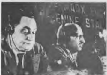
Г. Димитров и О. Пятницкий в президиуме VII Конгресса Коминтерна