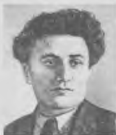
Григорий Евсеевич Зиновьев