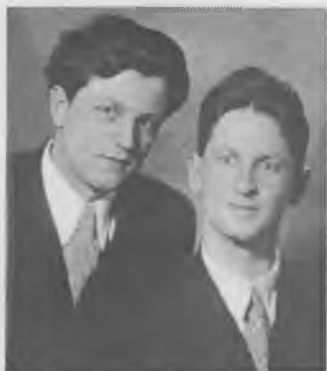
Владимир и Игорь Пятницкие после политической реабилитации отца. Москва. 1956 г.