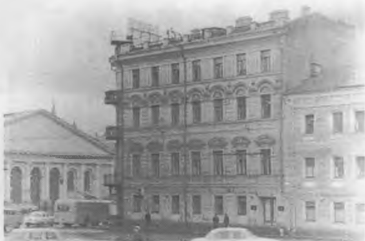
Здание, в котором размещался Исполком Коминтерна с 1920 по 1936 год. Москва, ул. Моховая, 6. Вид со стороны станции метро «Библиотека им. Ленина»