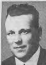
Федор Федорович Раскольников (Петров) — руководитель Военной комиссии Орготдела ИККИ