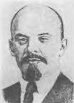
В.И. Ленин (Ульянов)