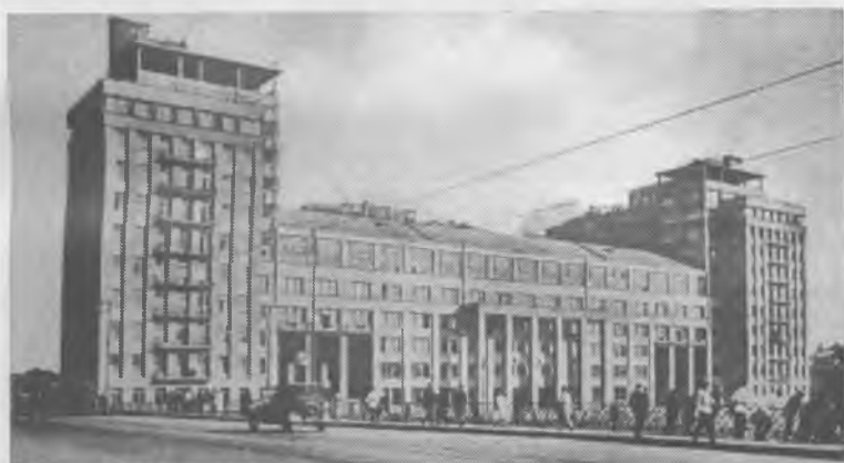
2-й дом Советов («Дом правительства») впоследствии — «Дом на набережной», где с 1932 года проживало большинство руководителей исполкома Коминтерна (Москва, ул. Серафимовича, 2)