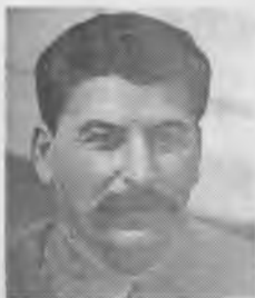
И.В. Сталин председатель комиссии