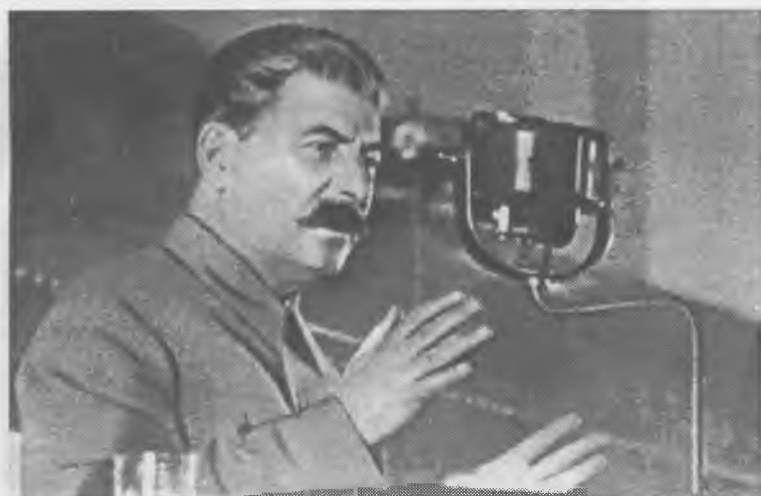
Сталин лгал триста шестьдесят пять дней в году, двадцать четыре часа в сутки и всю жизнь