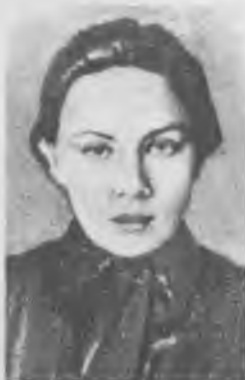
Н.К. Крупская — секретарь редакции