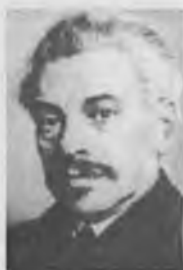
Адольф Варский (Варшавский)

РУКОВОДИТЕЛИ ПОЛЬСКОЙ КОМПАРТИИ, ОБВИНЕННЫЕ В ИНАКОМЫСЛИИ И УНИЧТОЖЕННЫЕ СТАЛИНЫМ