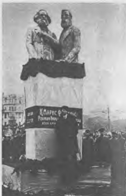
Памятник основателям I Коммунистического Интернационала Карлу Марксу и Фридриху Энгельсу в Москве. В.И. Ленин произносит речь на открытии памятника. 7 ноября 1917 года