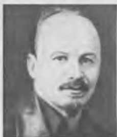
Николай Николаевич Бухарин