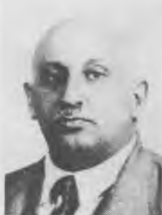
И.А. (Осип) Пятницкий

ЧЛЕНЫ И КАНДИДАТЫ В ЧЛЕНЫ ЦК ВКП(б), ОТКРЫТО ВЫСТУПИВШИЕ НА ИЮньСКОМ ПЛЕНУМЕ 1937 года ЗА УСИЛЕНИЕ КОНТРОЛЯ ЦК ВКП(б) ЗА ДЕЯТЕЛЬНОСТЬЮ НКВД И ПРОТИВ РЕПРЕССИВНОЙ ПОЛИТИКИ СТАЛИНА И ПРЕДОСТАВЛЕНИЯ Н. ЕЖОВУ ЧРЕЗВЫЧАЙНЫХ ПОЛНОМОЧИЙ