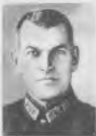
Ян Карлович Берзин — начальник Разведупра Генерального штаба РККА