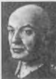
Карл Сверчевский (Вальтер) начальник Военно-политической школы Коминтерна