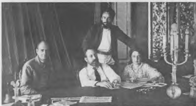
II Конгресс Коминтерна. Сидят (слева направо): Пауль Леви, Менотти Сератти и Анжелика Балабанова. Стоит Карл Бернгардович Радек (Собельсон)