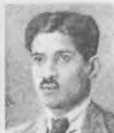
Манабендра Нахт Рой