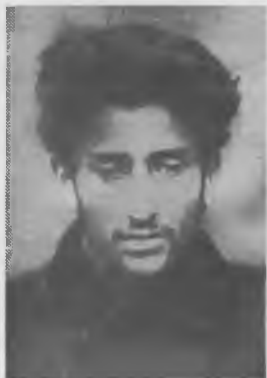
И.А. (Осип) Пятницкий