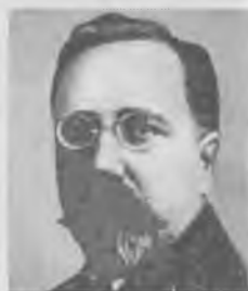
Лев Борисович Каменев