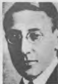
Юлиан Лещинский (Ленский)