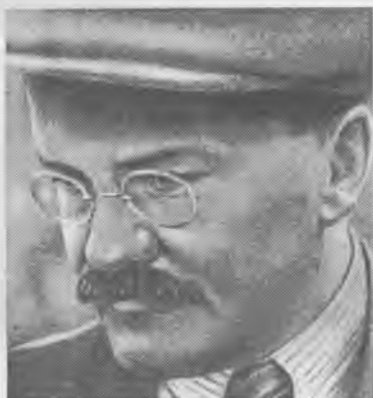
В.М. Молотов — председатель делегации