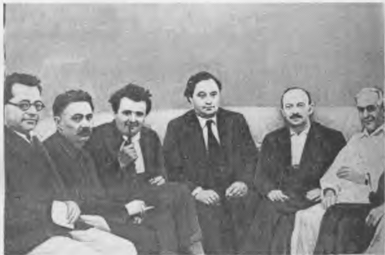
Члены Секретариата Исполкома Коминтерна, избранного VII Конгрессом Коминтерна. Слева направо: П. Тольятти, Д. Мануильский, К. Готвальд, Г. Димитров, О. Куусинен, В. Пик (Другие секретари ИККИ: А. Марти, Ф. Флорин, М. Трилиссер и Ван Мин в свое время были отрезаны цензурой)