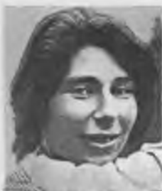
Урсула Кучински (Рут Фишер)