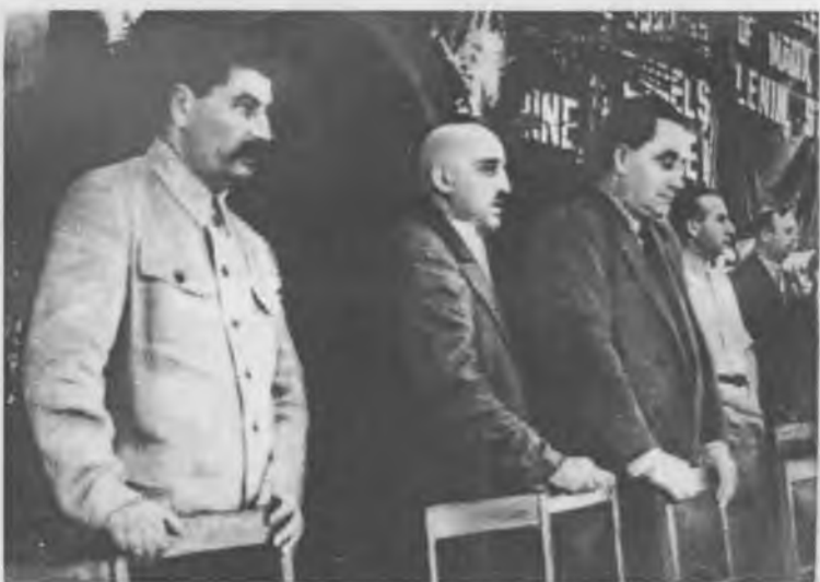
И.В. Сталин, И.А. (Осип) Пятницкий и Г.М. Димитров в президиуме VII Конгресса Коминтерна