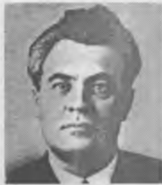
Манфред Сальмович Штерн