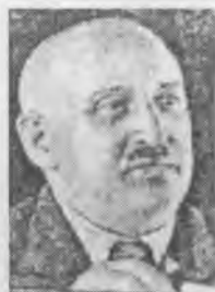
Осип Пятницкий незадолго до ареста