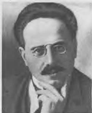
Карл Либкнехт видный деятель германского и международного Коммунистического движения, один из основателей «Союза Спартака»