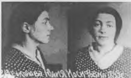
Юлия Соколова-Пятницкая. Тюремный снимок.