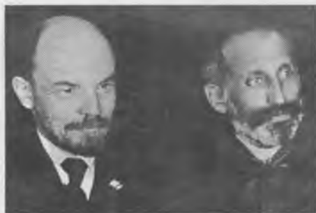
В.И. Ленин и И.А. (Осип) Пятницкий, секретарь МК РКП(б), на заседании актива московской парторганизации (фрагмент снимка). Январь 1921 г.