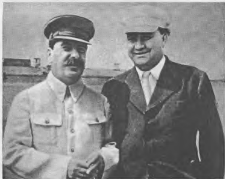
И.В. Сталин и Г.М. Димитров после развала созданного В.И. Лениным Коммунистического Интернационала