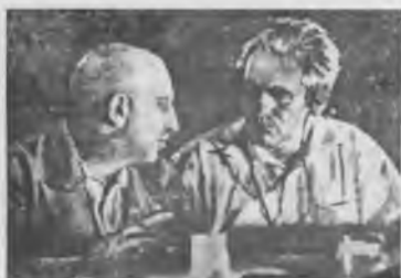
О. Пятницкий и В. Пик в президиуме VII Конгресса Коминтерна