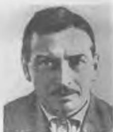
Михаил Петрович Томский

РУКОВОДИТЕЛИ ПОЛЬСКОЙ КОМПАРТИИ, ОБВИНЕННЫЕ В ИНАКОМЫСЛИИ И УНИЧТОЖЕННЫЕ СТАЛИНЫМ