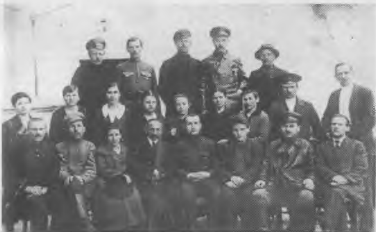
Железнодорожный райком московской организации РСДРП(б). И.А. (Осип) Пятницкий — в первом ряду четвертый слева. Москва, 1917 г.