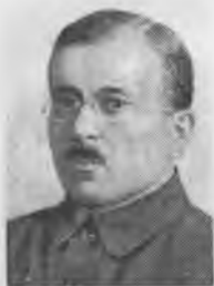
Иосиф Уншлихт — член и консультант Военной и Нелегальной комиссий Исполкома Коминтерна