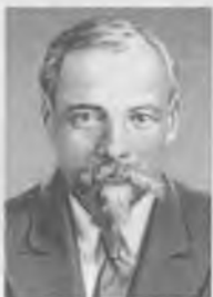
Винчас Симанович Мицкявичус-Капсукас — председатель Нелегальной комиссии Исполкома Коминтерна