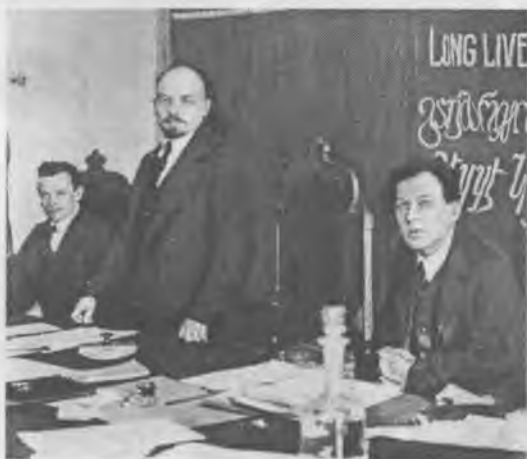
В.И. Ленин открывает I организационный Конгресс Коммунистического Интернационала (Коминтерна). Март 1919 г. Слева направо: Г.Эберлейн, В.И. Ленин и Ф. Платтен