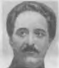
Г.К. (Серго) Орджоникидзе