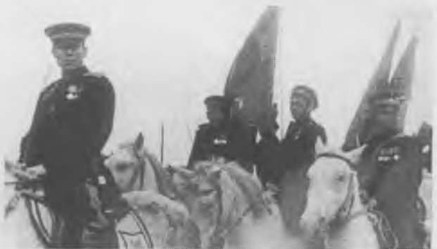
Знаменный взвод 12-й гвардейской Донской казачей дивизии на марше. Венгрия. 1945 г.