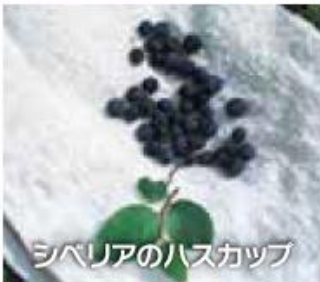
シベリアのハスカップ