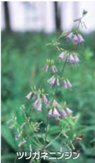
ツリガネニンジン