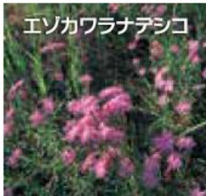
エソカワラナテシコ