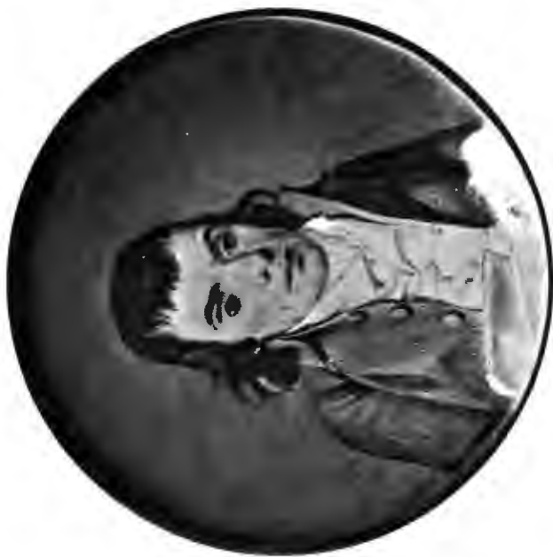
ЖИЛЬБЕРЪ РОМЪ Французскій террористъ.