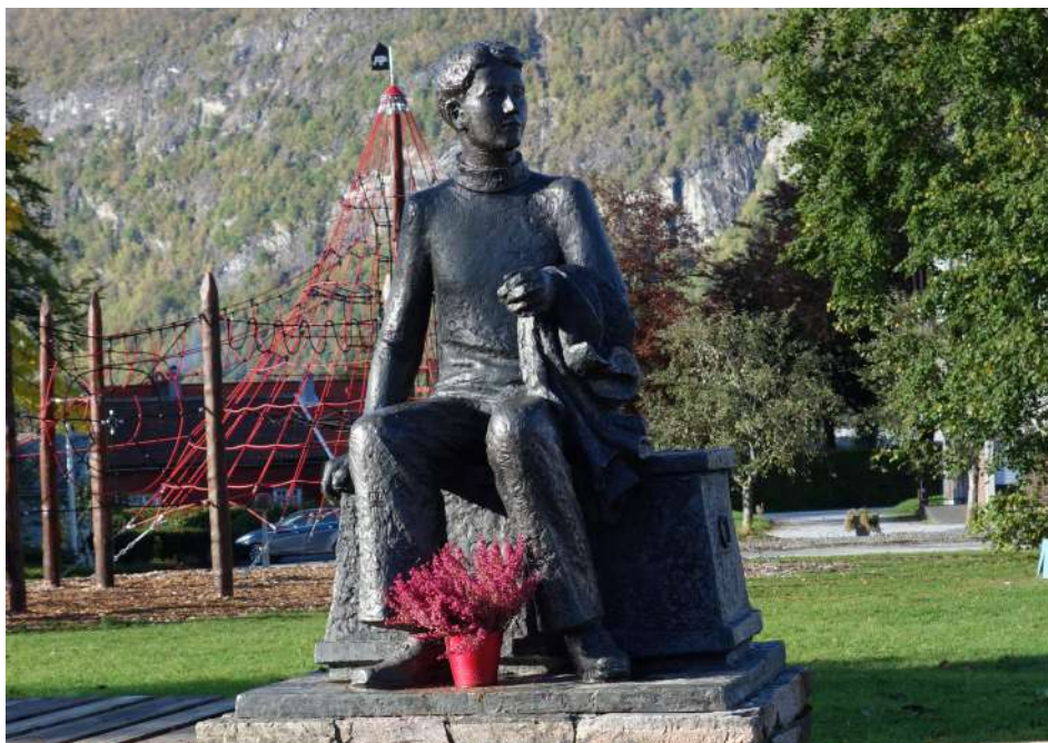
"Vesle Daniel" i Dale