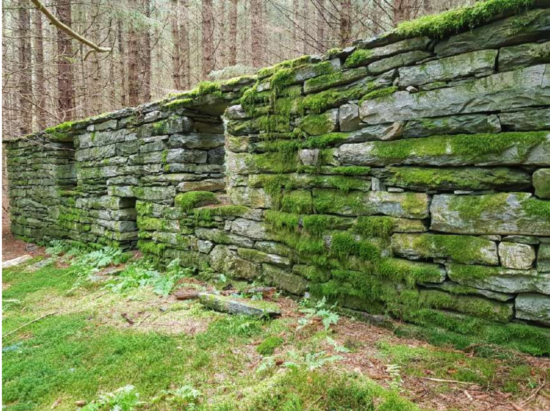
Steinmur på Østenstad

I seinmellomalderen låg mange av gardane i Fjaler aude etter Svartedauden og påfølgjande pestepidemiar, men frå slutten av 1500-talet tok folketalet seg opp att. Folk lengst ute på kysten var fiskarbønder, medan folk i fjordstroka og oppover dalane laut støtte seg mest på jordbruket.