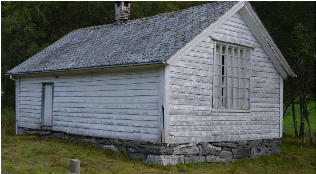
Det gamle skulehuset i Tyssedal

Den første fastskulen i Fjaler var i den gamle tingstova på Tross i Dale. Ikring 1890 vart det så bygt eit eige skulehus sør for kyrkja, som framleis står. På denne tida kom det skulehus i dei fleste krinsane i kommunen. Ein rapport frå 1895 fortel at det var bygt eigne skulestover i 18 av 20 krinsar: Vårdal, Holmedal, Rivedal, Lone, Bakkebø, Tyssedal, Standnes, Strand, Dale, Håland, Vassdal, Flekke, Espedal, Bjordal, Espenes, Guddal, Gallefoss og Heggheim. Krinsane Øen og Sunde dreiv i leigde lokale. Alle skulestovene var bygde som sperrestover med eitt klasserom og ope loft og glasljore.