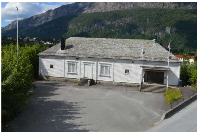
Ungdomshuset Trudvang i Dale

Av andre eldre offentlege bygg kan nemnast folkebadet i Dale frå 1936. Dette blei bygt som eit samarbeid mellom Fjaler Røde Kors og Rieber-konsernet, som eigde skofabrikken. Badet var i bruk fram til slutten på 1950-talet. Fjaler gamleheim vart bygt i 1920. Drifta var sjølvberande fram til 1960, då kommunen gjekk inn med tilskot. Fjaler Sparebank sitt eldste bygg er frå 1923. Det var i bruk som banklokale fram til 1969.