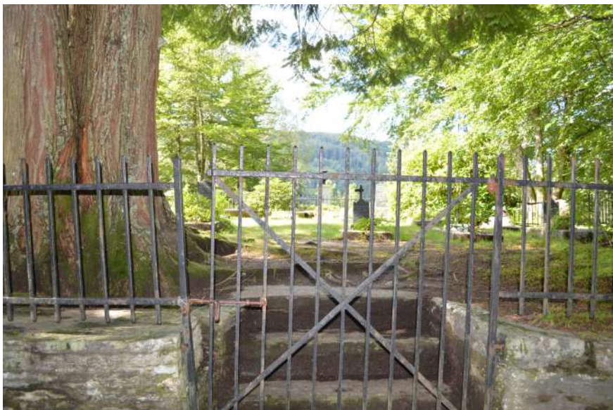
Den private gravstaden på Fredensborg