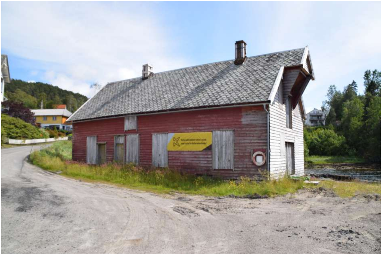
Nilsbua i Hellevika

kaien på Leitet ligg ein butikk som var i drift til 1960-talet, og som vart restaurert på byrjinga av 1990-talet.