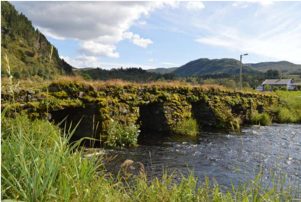
Hålandsbrua på Den trondhjemske postvegen

Det finst ei rekke kulturminne i Fjaler knytt til samferdsle og kommunikasjonar. Den første offentlege vegen gjennom kommunen var Den trondhjemske postvegen , der ein av strekningane går mellom Leirvik og Trossebryggja i Dale (45 km). Postruta mellom Bergen og Trondheim vart sett i gang i 1786, og postvegen vart bygt dei følgjande tiåra. Frå grensa mot Hyllestad ved Røstenskar går han aust for Hovland ned til Espedalen og vidare forbi Vassliåsen til Rennestraum. Frå Flekke går han opp Stavsdalen nord for noverande fylkesveg og deretter ned til Håland over den gamle Hålandsbrua. Postvegen gjennom Fjaler og Hyllestad vart restaurert på 1970- og 80-talet og opna ved ei markering med samferdsleminister Kjell Opseth sommaren 1993. Vegen er skilta. Langs postvegen har det også gått telegraflinje som vart sett opp i midten av 1860-åra. Det finst framleis fundament etter telegrafstolpane. Postvegen har status i gjeldande kommuneplan som verneverdig.