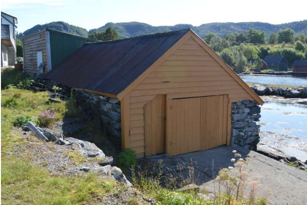
Steinmura naust på Folkestad

Lov om kulturminner gjev føresegner om automatisk freda kulturminne, lause kulturminne, og skipsfunn og fartøyvern. Faste kulturminne (buplassar, bygningar, spor etter åkerbruk, bergkunst, gravminne m. m.) frå oldtid eller mellomalder (fram til år 1537) er automatisk freda, det same gjeld ståande bygningar frå før 1650 og samiske kulturminne frå før 1917. Ikring automatisk freda kulturminne er det ei 5 meter brei sikringssone. Også kulturminne frå nyare tid kan få vedtak om freding i medhald av lov om kulturminner.