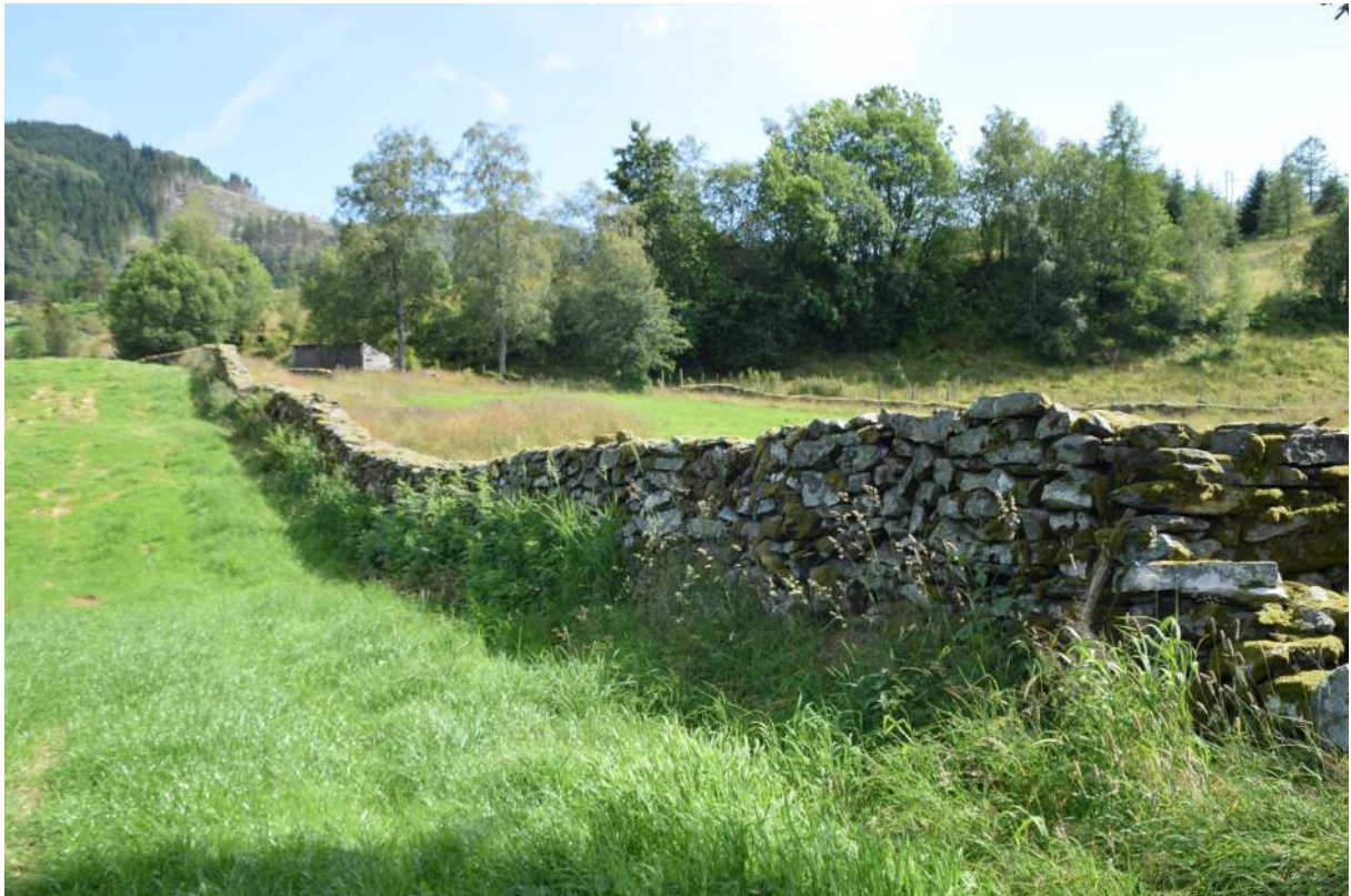
Steingard på Arstein