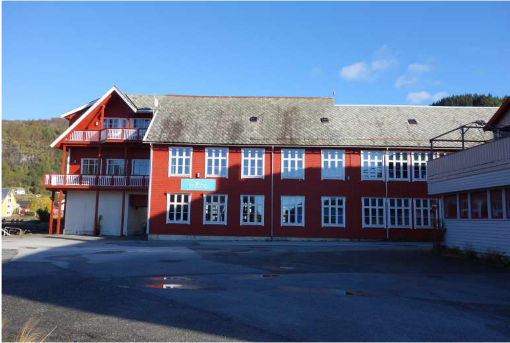
Kloggen i Dale, no kontorlokale for Hansen Technologies.