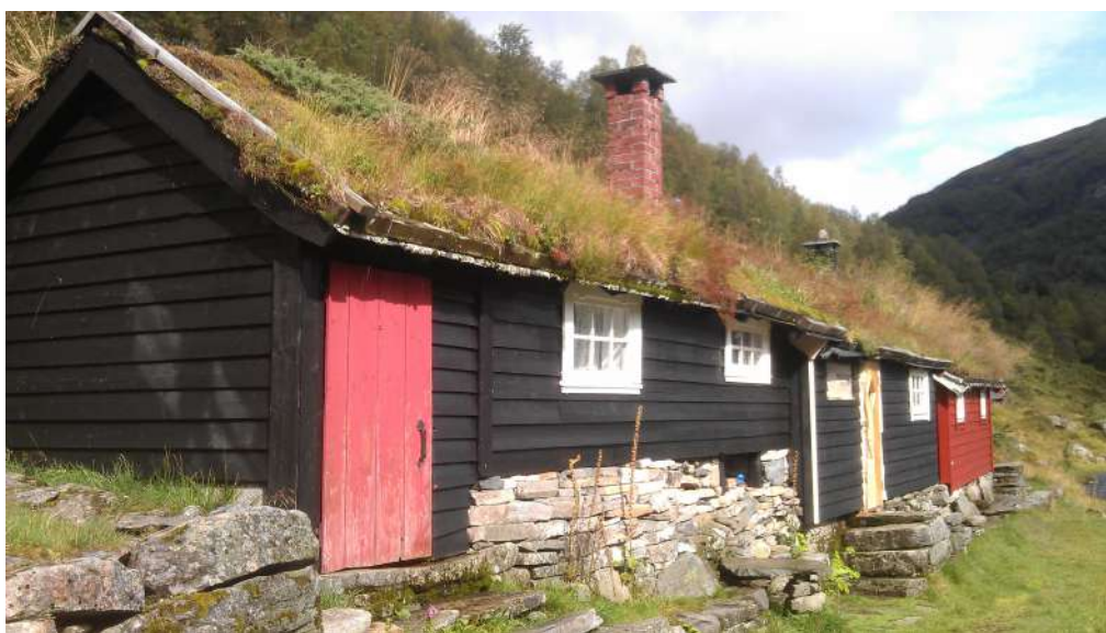
Stølsmiljø på Slettlandsstølen, vurdert som verneverdig i kommuneplanen frå 2009.

Utskiftingane seint på 1800-talet og tidleg på 1900-talet braut opp og fjerna den tidlegare så vanlege gardsstrukturen med eitt fellestun for fleire bruk. Men somme stader, der utskiftinga skjedde tidleg, har bygningane ikkje blitt flytta frå ein annan slik at tunstrukturen framleis eksisterer. Dette er tilfelle i Tyssedalen, der dei to bruka framleis har husa tett samla. Det gamle klyngetunet på Igeltjern er med hjelp av gamle dokument blitt rekonstruert og teikna.