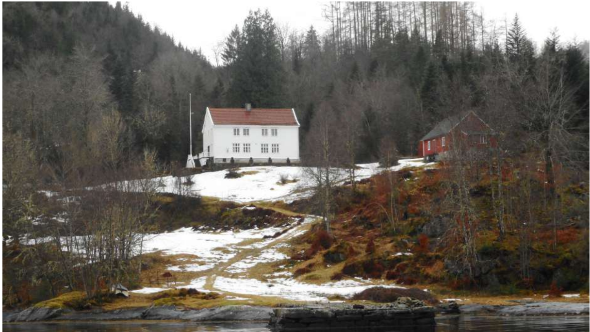
Fagervik, eit av herskaphusa på Tysselandet

Reglene om kulturminner og kulturmiljøer gjelder så langt de passer også for botaniske, zoologiske eller geologiske forekomster som det knytter seg kulturhistoriske verdier til.