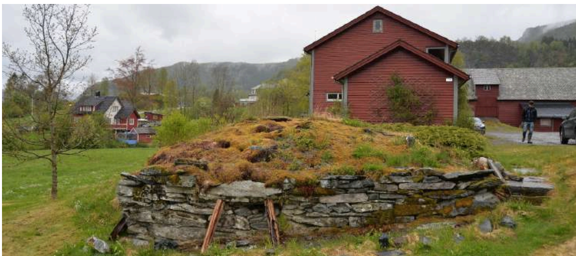
Jordkjellar i Flekke.

Dei fleste gardane i kommunen var små til mellomstore, men her var også dei som dreiv i større stil. Garden Gallefoss kan stå som eit typisk døme på drifta på ein velhalden vestlandsgard. I 1865 var her to brukarfamiliar og i alt 26 menneske budde på garden. I