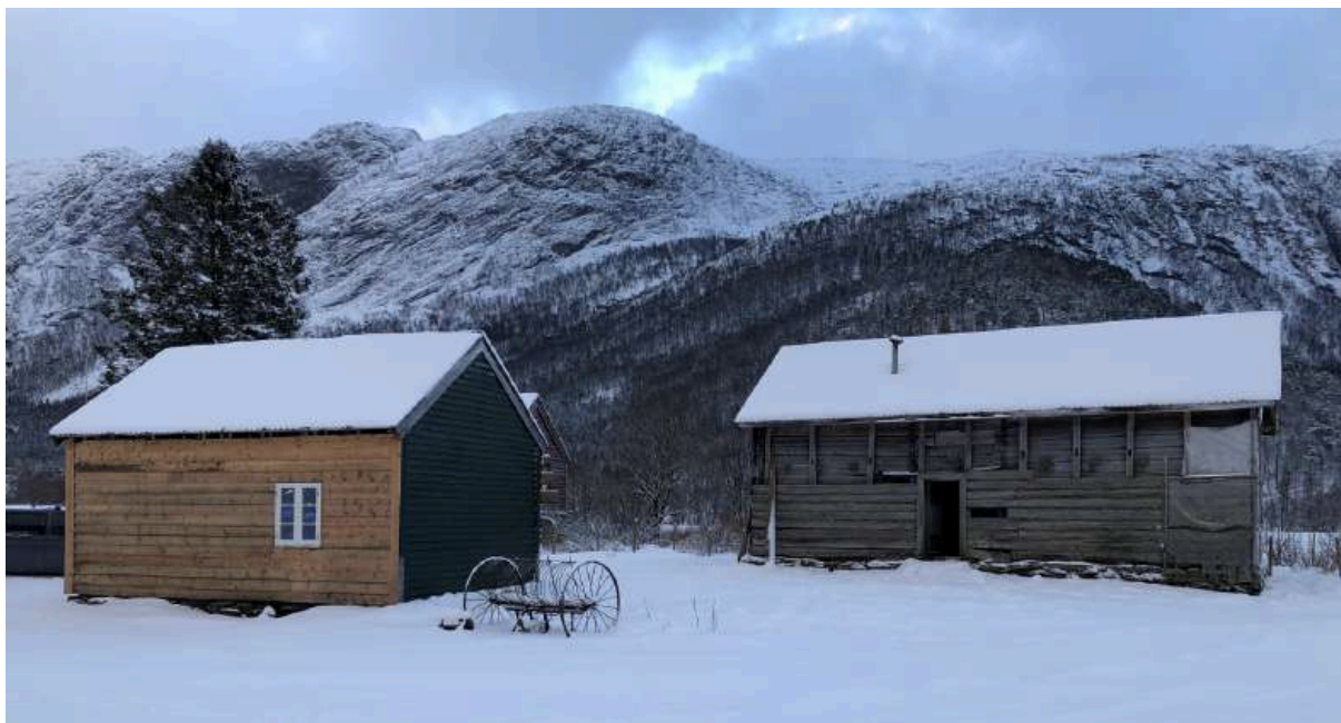
Eldhus og gammalt våningshus på Gallefoss.

fjøsen hadde dei to bøndene til saman 4 hestar, 59 kyr, 90 sauer, 68 geiter og to griser. Dei sådde ut i alt 13 tønner havre og 7 tønner poteter. Det er planar om å restaurere det gamle gardstunet på Gallefoss bnr. 1. Både her og elles i Guddalen finst det fleire gardshus av høgare alder enn nede ved fjorden.