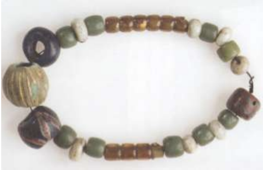
Perler frå ei jernaldergrav på Fure

Eit av dei mest særmerkte funna kjem frå ei grav på Fure. Der låg eit beslag av bronse som er irsk og som truleg har vorte innført kring år 800. Grava inneheldt også nokre brotstykke av eit sølvband som truleg har vore eit armband, og totalt 22 perler, derav ei av bronse og to mosaikkperler. Perlene er daterte til merovingertida (ca. 550–800 e. Kr.).