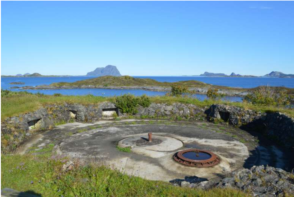
Kanonstilling på Lammetun