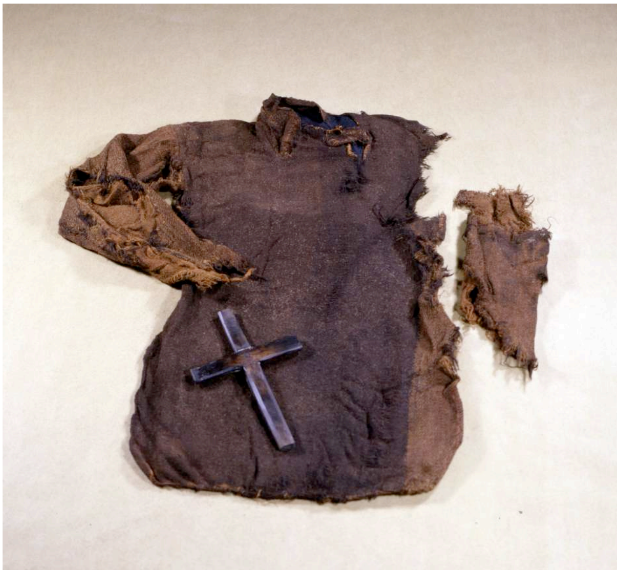
Forside av drakt med kross frå myrkyrkjegarden i Guddal.

I ei myr ved Guddal kyrkje er det funne restar av ein gammal kyrkjegard. Her fann dei ei rekkje kisteplankar, to draktplagg, eit teppe, ein hasselkjepp og ein trekross. I alt vart det registrert 40 graver, både for vaksne og barn. Dei samla dateringane tyder på at gravplassen kan ha vore i bruk frå 1000-talet til siste halvdel av 1200-talet, kanskje noko lenger. Gravlegging av menneske i myr er eit nokså uvanleg fenomen, og funnet i Guddal er eineståande i Norden.