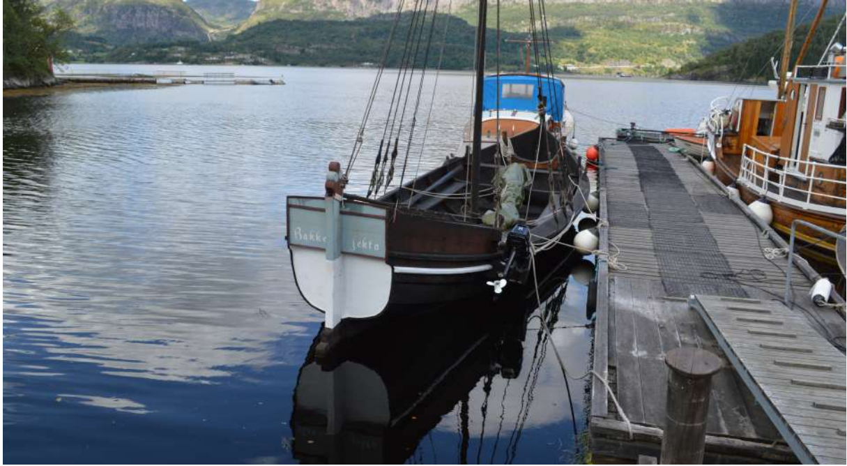
Bakkejekta til kai ved Jensbua.