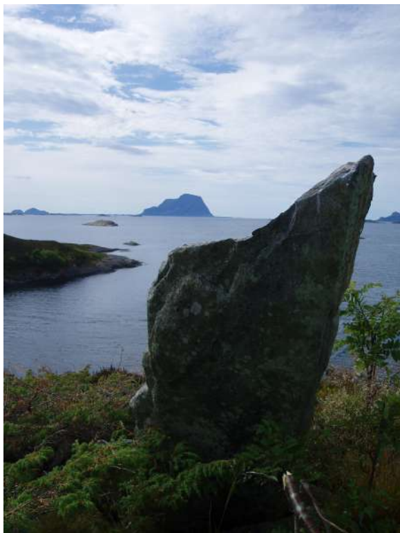
Bautastein på Vardholmen i Lammetusundet

Arbeid med kulturminne er krevjande, både i tid og pengar. Mange faste kulturminne er dyre å restaurere og halde ved like, ikkje minst bygningar. Også lause kulturminne krev ressursar når det gjeld oppbevaring, vedlikehald og formidling.