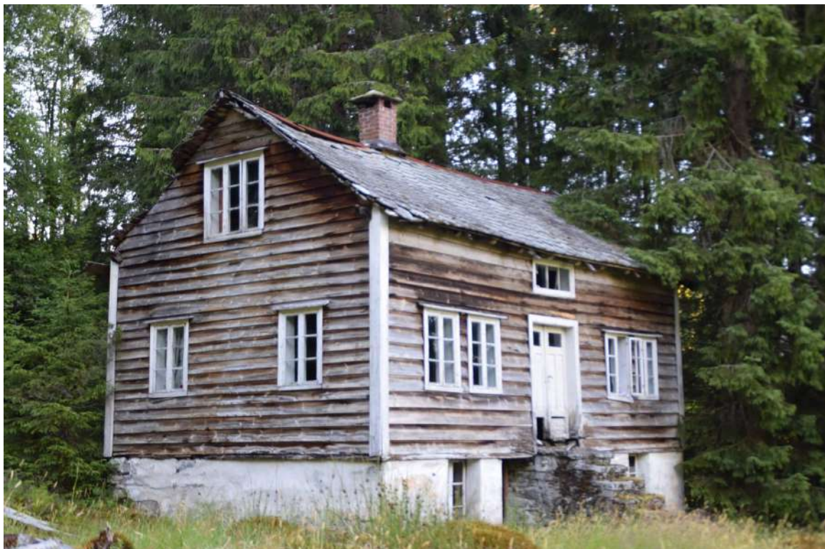
Våningshus på Fuglevatn, ein fråflytta gard ved Gyttavatnet. Garden er nemnt i Bergens Kalvskinn frå omkring 1350, og høyrde då til kyrkja i Holmedal.

Omkring 36 av gardsnamna i Fjaler er nemnde i Bergens Kalvskinn og ymse andre mellomalderdokument. Men Fjaler og Fjalafylket er også omtala i annan eldre litteratur. Den islandske Landnámabok knyter Ingolf Arnarson til området. I to versjonar av boka heiter det at bestefedrane til Ingolf og fosterbroren Leif busette seg i "Dalsfirdi æ Fiolum" – Dalsfjorden i Fjaler. Dei norrøne bokskrivarane i høg mellomalderen reknar ofte opp Fjaler for seg ved sidan av Sogn i sør og Fjordane i nord, og det kan difor tenkjast at området mellom Buefjorden og Stavfjorden med tilhøyrande fjord- og fjelldistrikt har vore eit eige hovdingdømme på 800- og 900-talet.