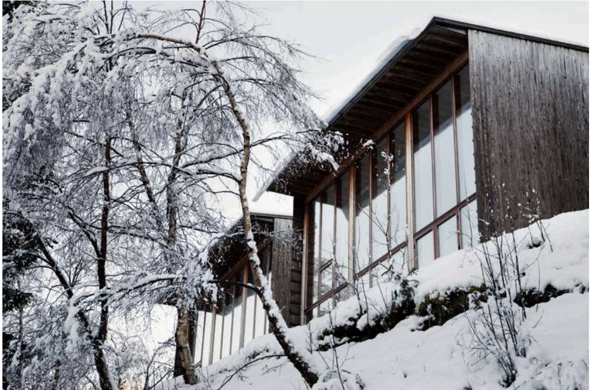
Nordisk Kunstnarsenter på Dalsåsen – eit arkitektonisk kulturminne frå nyare tid.

I 2017 blei det opna ei ny kulturløype ved Klokkargarden med fokus på Jakob Sande. Løypa vart etablert i samarbeid med reiselivsorganisasjonen Fjordkysten, og har skilt som viser til kvar ein kan laste ned lyd- og videofiler. Ei liknande kulturløype finst også i Korssundet, og det er planar om å etablere ei ny løype på Tysselandet med fokus på dei gamle kulturmiljøa der.