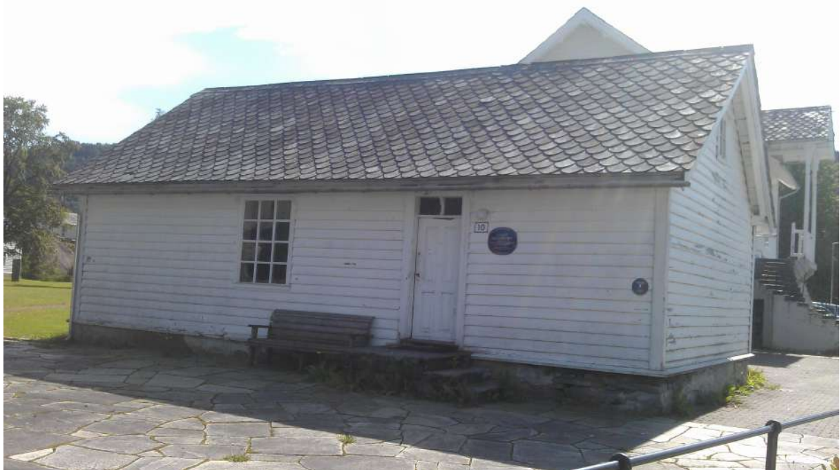
Gamle skulestova i Dale

Fjaler har ei rik og mangslungen skulehistorie, frå den første omgangsskulen på 1700-talet til moderne offentleg skuledrift og UWC på Haugland.