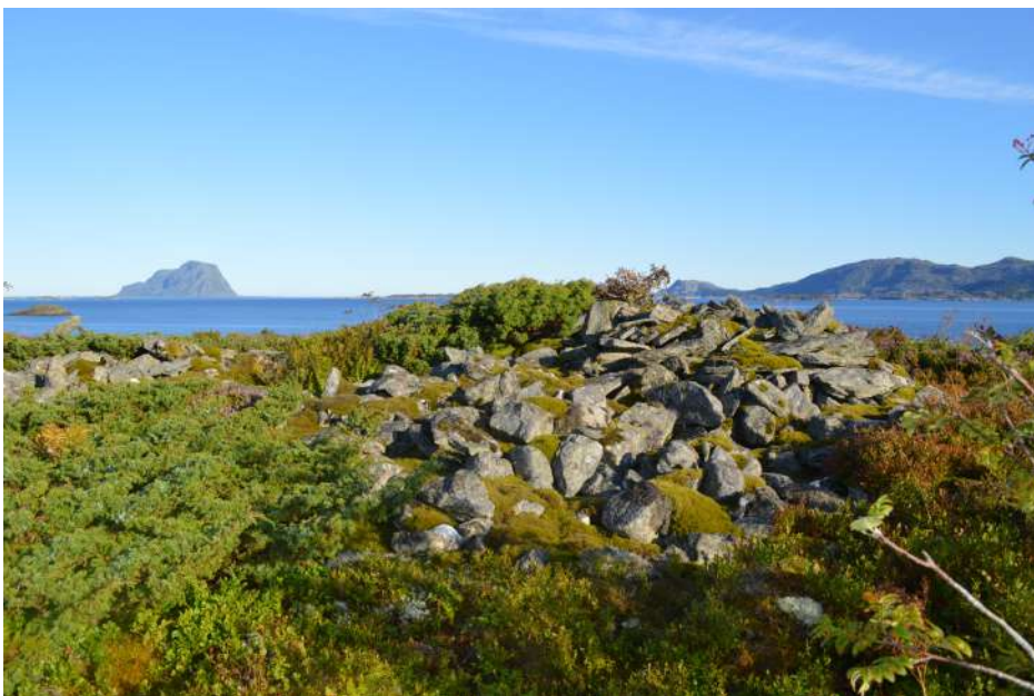
Gravhaug på Vardholmen i Lammetusundet.

I Fjaler finst det ein del førhistoriske gravrøyser og -haugar, i alt 34 registrerte lokalitetar. Over to tredelar av dei ligg ute på kysten, konsentrerte i nokre område – på Fure og Fureneset, Einingsneset, Vardholmen og langs sunda mellom Lammetun, Lutelandet og fastlandet. Desse gravminna ligg stort sett på stader som er godt synlege frå og med godt utsyn til skipsleia. Til Einingsneset er det lagt til rette med sti og skilting. Gravminna i indre strok ligg meir spreidd. Det finst likevel samlingar av fleire