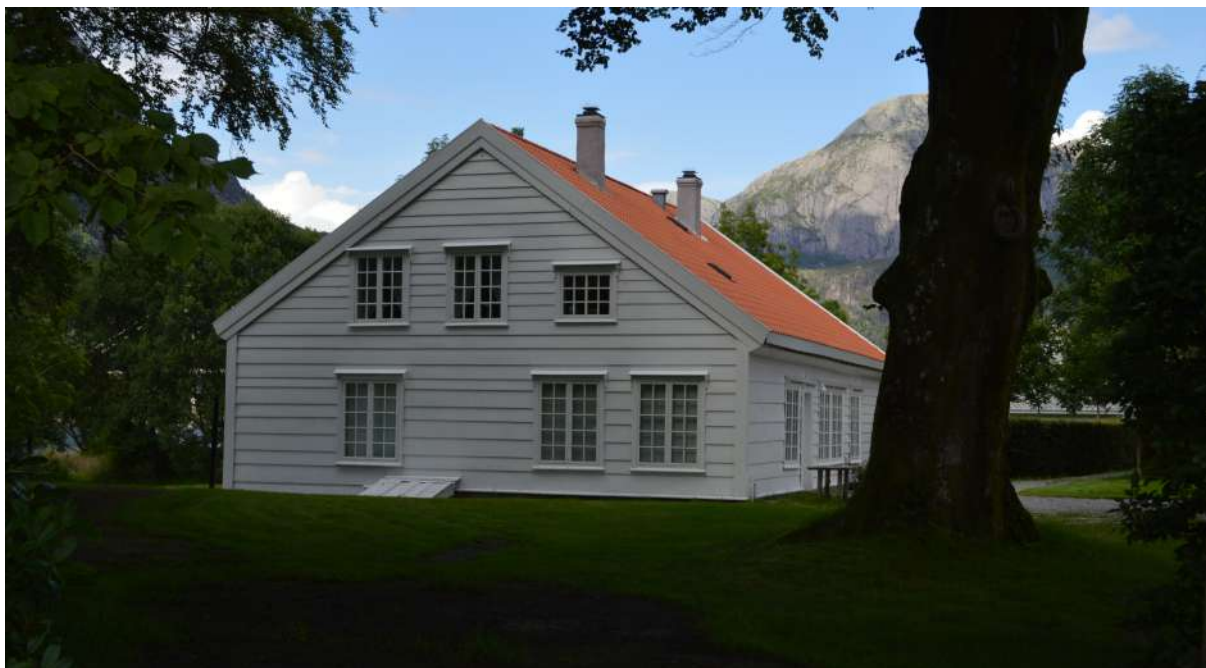
Vonenhuset i Dale