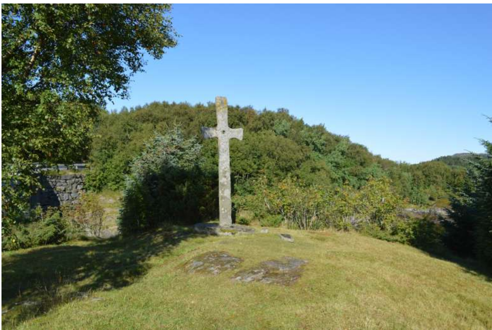
Krossen i Korssundet

I vikingtida tok folk frå distriktet til å fare over havet for å busetje seg på Vesterhavsoyane. I følgje to versjonar av den islandske Landnámabok kom den første landnåmsmannen på Island, Ingolf Arnarson, frå Dalsfjorden. Samstundes vitnar steinkrossen i Korssundet om tidleg kristen påverknad vestfrå. Utover i mellomalderen vart kyrkja ei viktig samfunnsmakt, og skriftlege kjelder peikar på Dale, Guddal og Åsnes som eldgamle kyrkjestader.