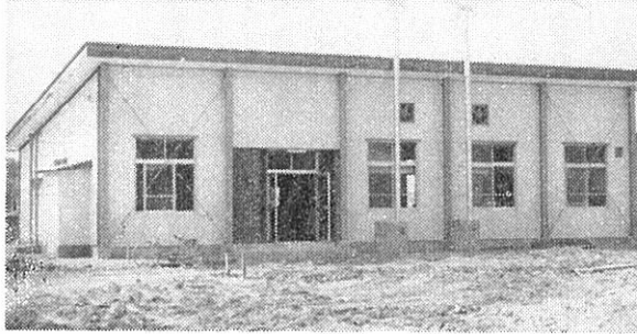
(準備がすべて完了した給食センター全景)

交通事故相談日 七月の交通事故相談日は次のとおりです。事故でお困りの方はご利用ください。 日時 七月二日午前十時から五時まで 場所 北秋田福祉事務所 (鷹巣町)