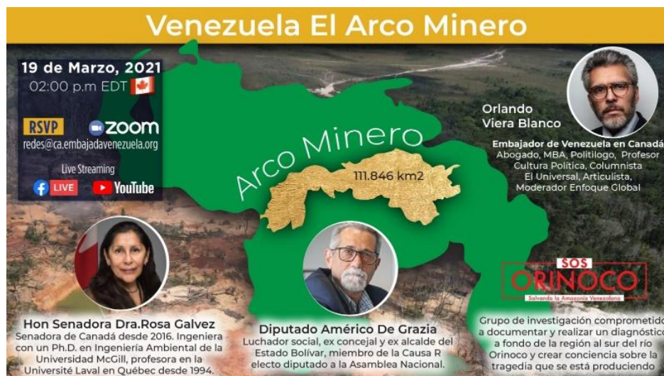
Figura 3: El Arco Minero (2021 International Webinar sobre el Arco Minero del Orinoco con miembros de los Parlamentos de Canadá y Venezuela)

3) Organizaciones especializadas han avanzado un enorme trabajo de evaluación para identificar daños y efectos en diferentes aspectos tales como daños a suelos, deforestación de área boscosas, tráfico de personas, uso de sustancias toxicas... etc. Los esfuerzos incluyen estudios biológicos, evaluaciones satelitales y pruebas de salud de la población.