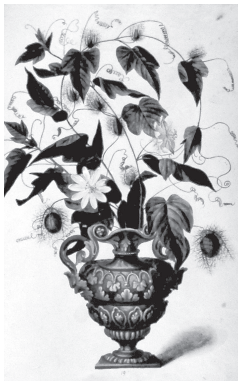
Witte Clematis uit de tuin van Fagel.

Overname van artikelen: alleen mogelijk in overleg met de redactie.