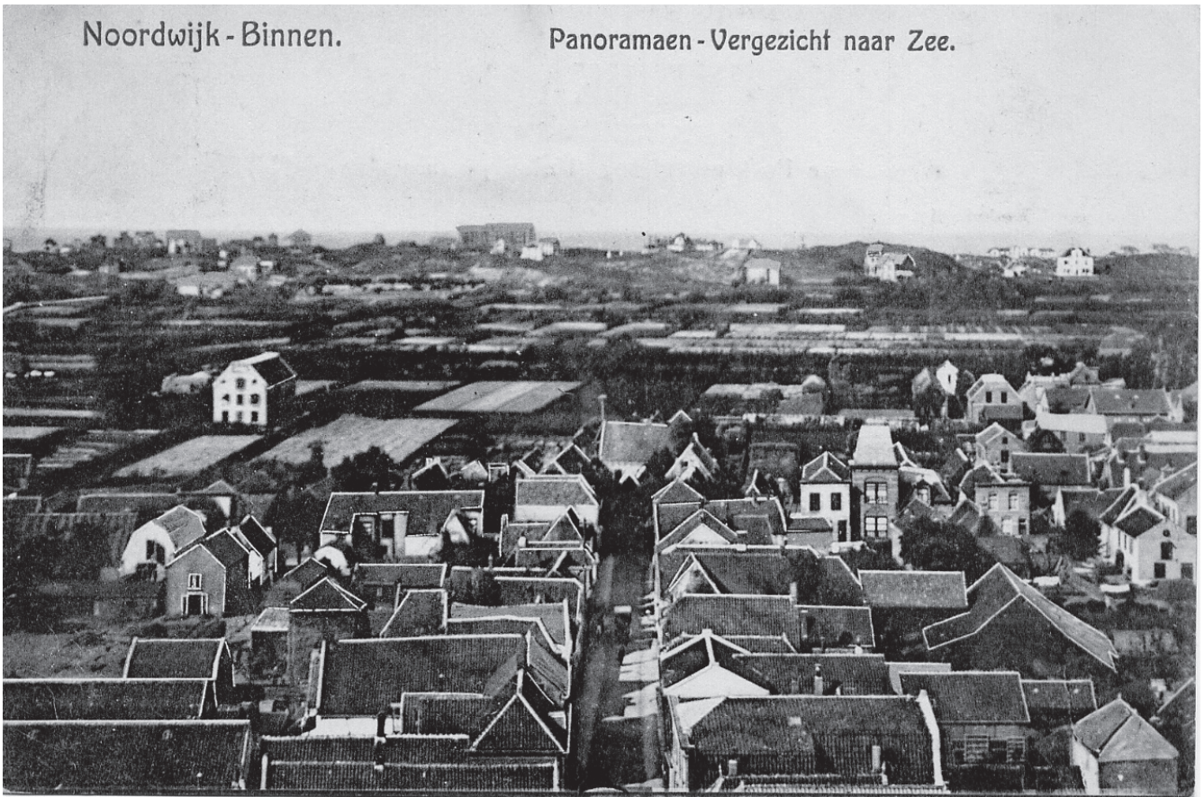
Panoramaen - Vergezicht naar Zee.