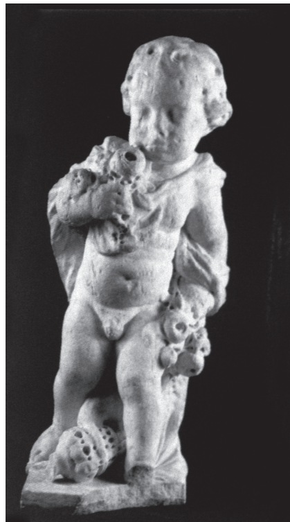
Twee tuinbeeldjes van Rombout Verhulst uit 1687, vermoedelijk uit de tuin van Fagel.