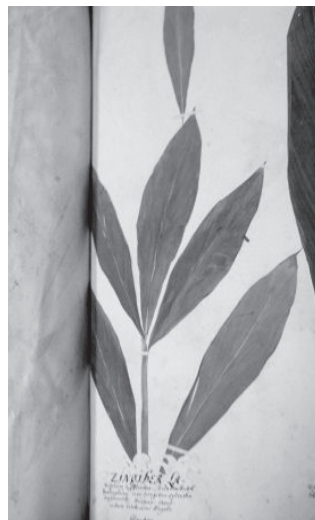
Gemberplant in het Sloane herbarium. British Museum of Natural History, Londen.