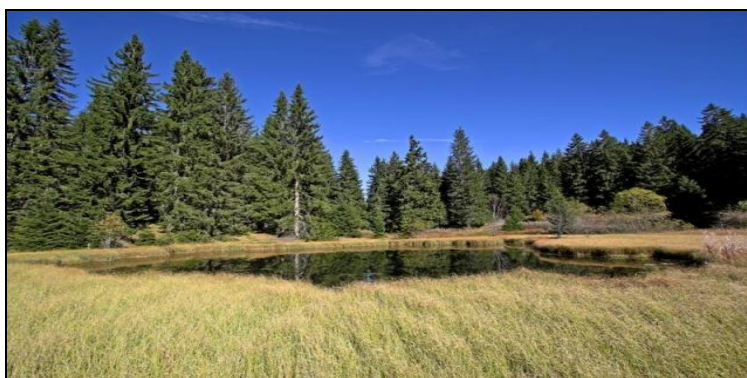
Дајићко (Тичар) језеро

метара. Раније је било много веће и отицало је у реку Пакашницу. Образовано је од атмосферских вода и језерска вода је временом растварала стене на свом дну, тако да се басен језера удубљивао док није допро до издани одакле и данас добија воду и тако се одржава. Дајићко језеро је тресетиште које се полако претвара у бару. Шумари кажу да су 60-их година постојала три нивоа језера, и да је имало редован доток воде. Када је поред језера изграђен пут Ивањица-Сјеница, вода која се сливала у језеро почела је да отиче каналом, а језеро да се смањује.