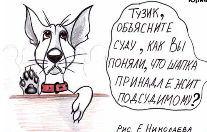
Рис. Е. Николаева

Из коллекции Председателя Верховного суда РТ Ильгиза Гилязова и судьи Верховного суда РТ Юрия Худобина