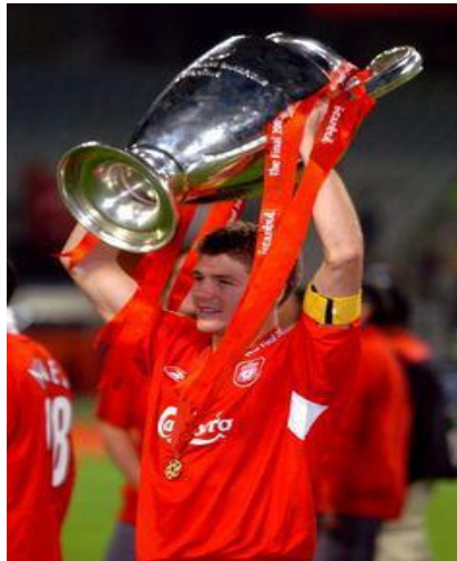
Gambar 1.1 Kapten Liverpool Steven Gerrard Mengangkat Trofi Piala Champion

Final Piala Champion 2005, Milan dianggap sebagai favorit dan tim mereka termasuk banyak pemain yang mengalami keberhasilan dalam kompetisi. Yang paling menonjol adalah kapten Paolo Maldini yang telah memenangkan kompetisi empat kali sebelumnya, semua dengan Milan dan Clarence Seedorf yang telah memenangkan kompetisi tiga kali dengan tiga klub yang berbeda. Liverpool telah dianggap underdog seluruh kompetisi, tetapi telah mengalahkan oposisi yang lebih disukai termasuk Juventus dan Chelsea mencapai final. Manajer Liverpool Rafael Benítez mengakui hal ini: "Mungkin Milan favorit, tapi kami memiliki keyakinan, dan kita bisa menang". Liverpool sempat tertinggal 3 – 0 di babak pertama, di babak kedua Liverpool mampu bangkit sehingga menyamakan kedudukan menjadi skor 3 – 3, diperpanjang waktu tidak ada lagi gol tercipta. Dramatis Liverpool di nyatakan pemanang lewat adu finalti ini keterkaitan mental pemain dalam hal motivasi.