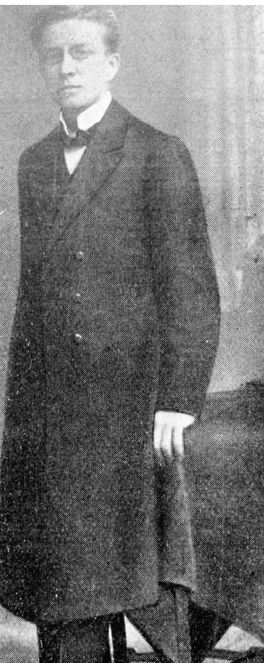
Fotografie ženy v mužských šatech z dobové učebnice soudního lékařství