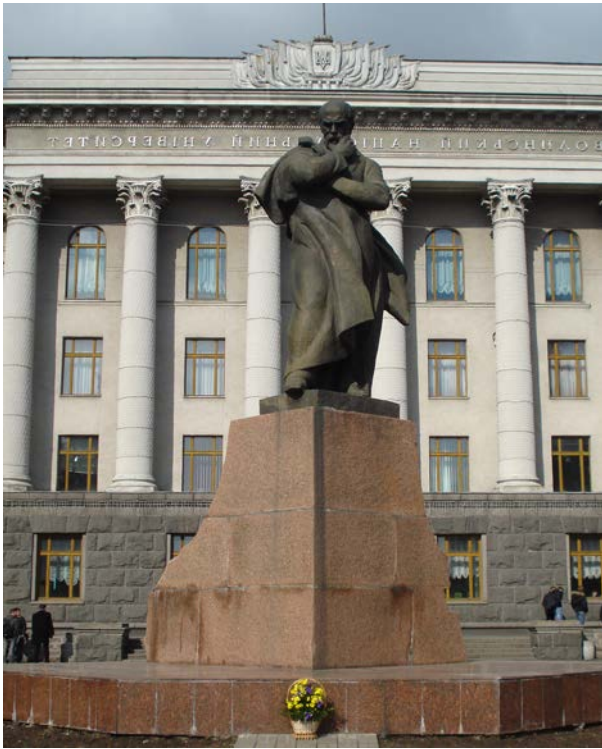
Фото 4. Пам'ятник Тарасові Шевченку