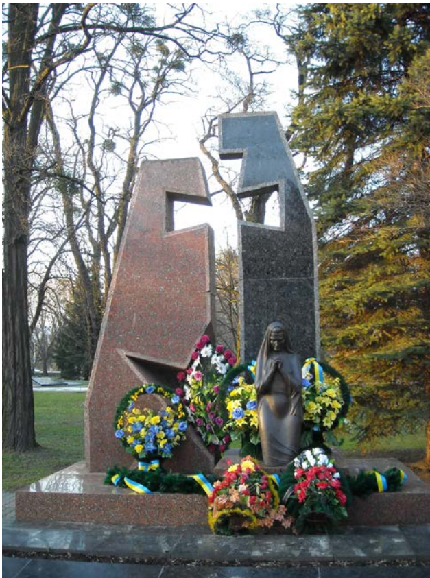
Фото 7. Воїнам-інтернаціоналістам на Меморіалі Вічної слави