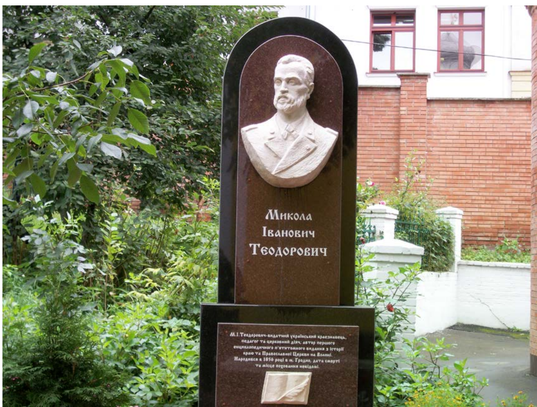
Фото 14. Пам'ятник Миколі Івановичу Теодоровичу