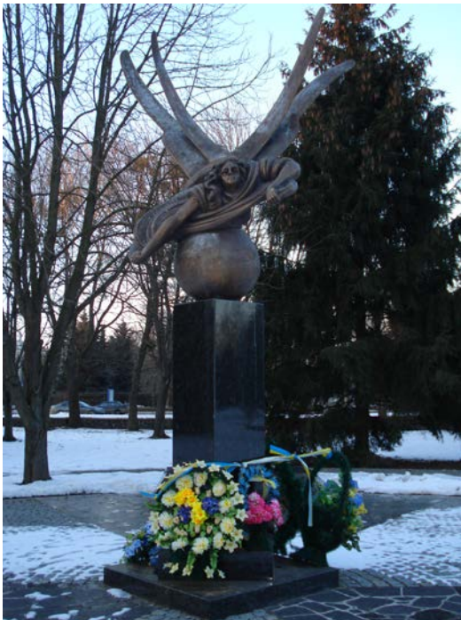
Фото 11. Пам'ятник ліквідаторам та постраждалим внаслідок Чорнобильської катастрофи.