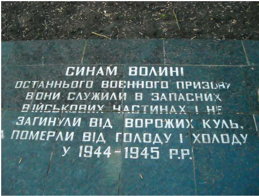
Фото 8. Загиблим у Саратовських таборах войнам останнього воєнного призову