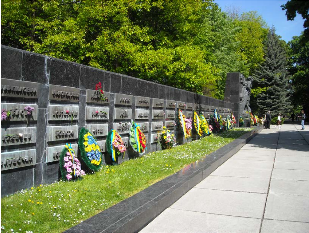
Фото 6. Стіна Плачу на Меморіалі, де згадано 107 спалених сіл