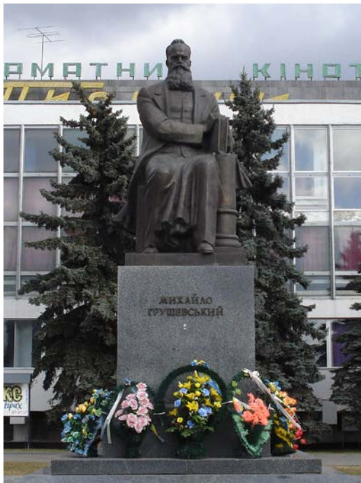
Фото 6. Пам'ятник Михайлу Грушевському.