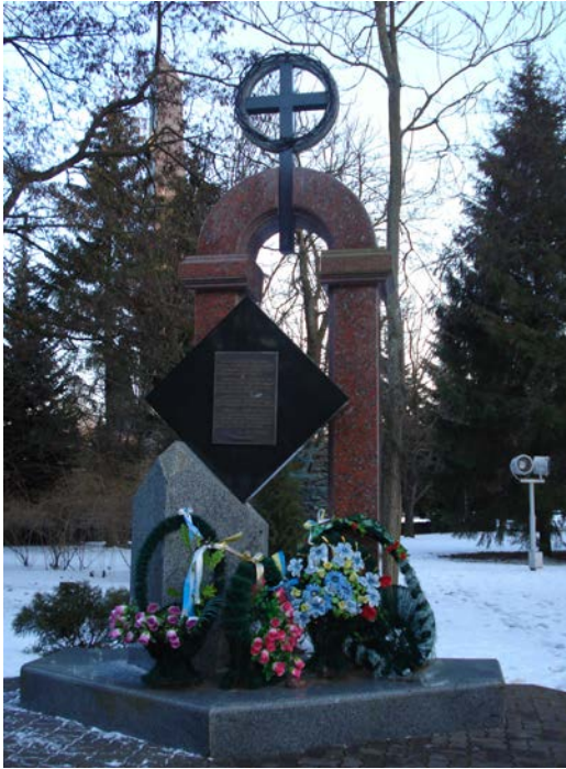
Фото 10. Пам'ятник українцям Холмщини, Підляшшя, Надсяння, Лемківщини, Бойківщини.