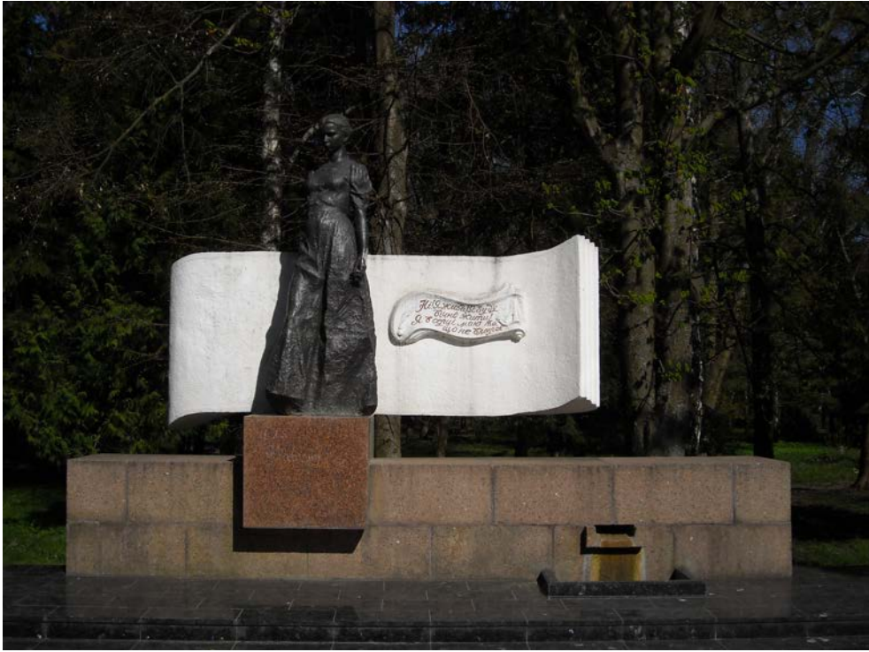
Фото 4. Пам'ятник Лесі Українці у парку культури та відпочинку м. Луцька