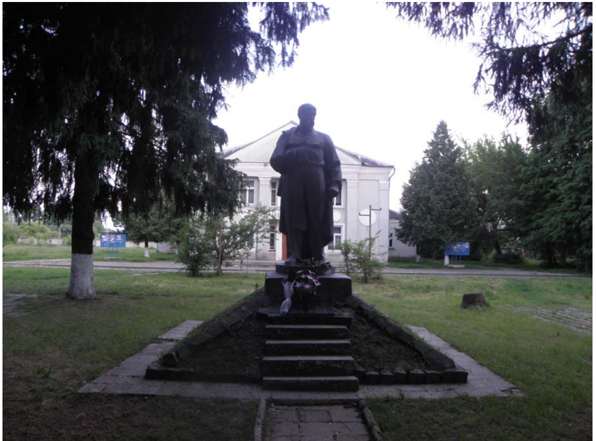
Фото 9. Памятник Т. Шевченку в Луцьку у мікрорайоні Вересневе