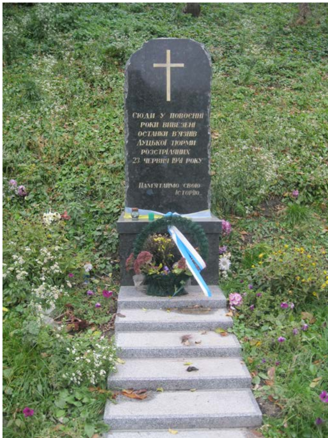
Фото 16. Пам'ятний знак Вязням Луцької тюрми