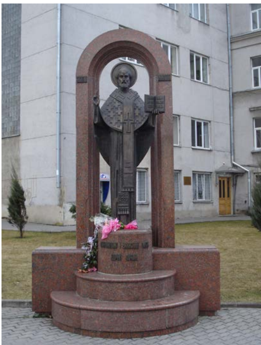
Фото 5. Пам'ятник Святому Миколаю.