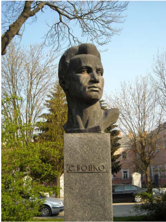
Фото 1. Пам'ятник Степанові Бойку