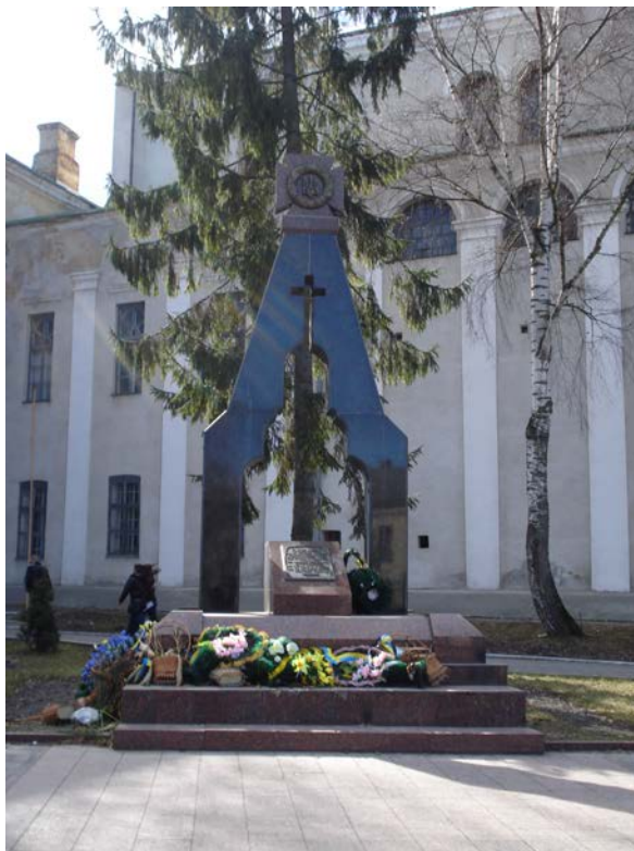
Фото 11. В'язням Луцької тюрми