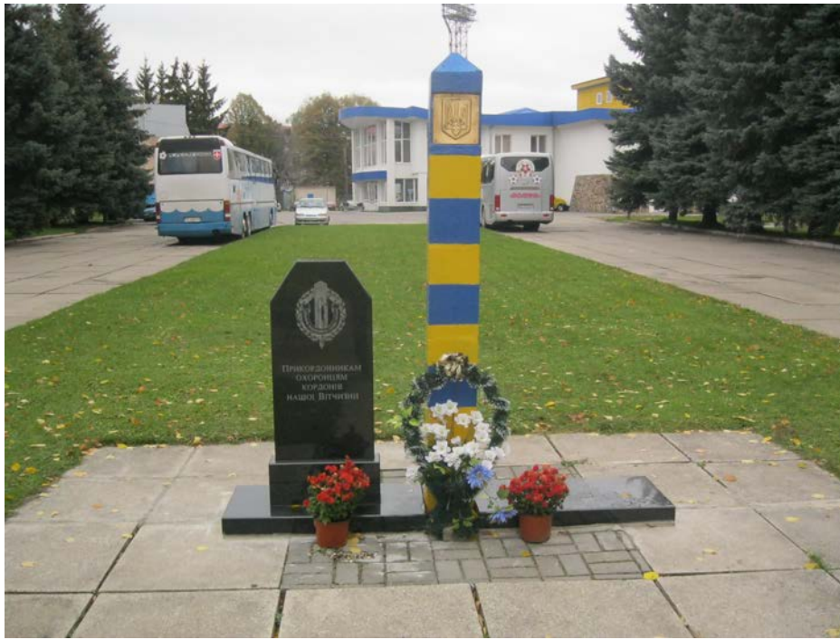
Фото 15. Пам'ятний знак Прикордонникам охоронцям нашої вітчизни