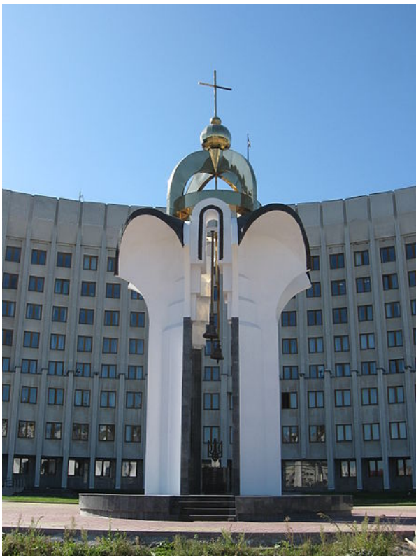
Фото 9. Пам'ятник борцям за незалежність