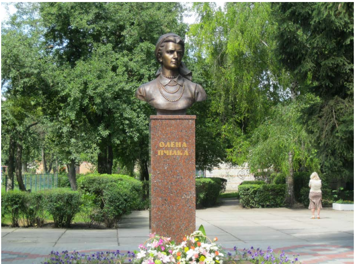
Фото 7. Памятник Олені Пчілці