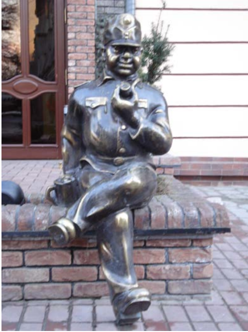
Фото 8. Скульптура Швейка на вулиці Лесі Українки біля пивного кафе.