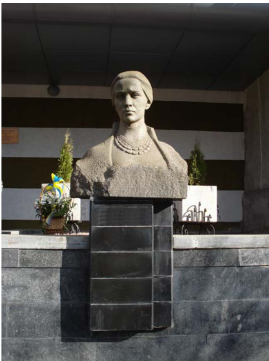
Фото 3. Погруддя Лесі Українки біля корпусу № 1 СНУ