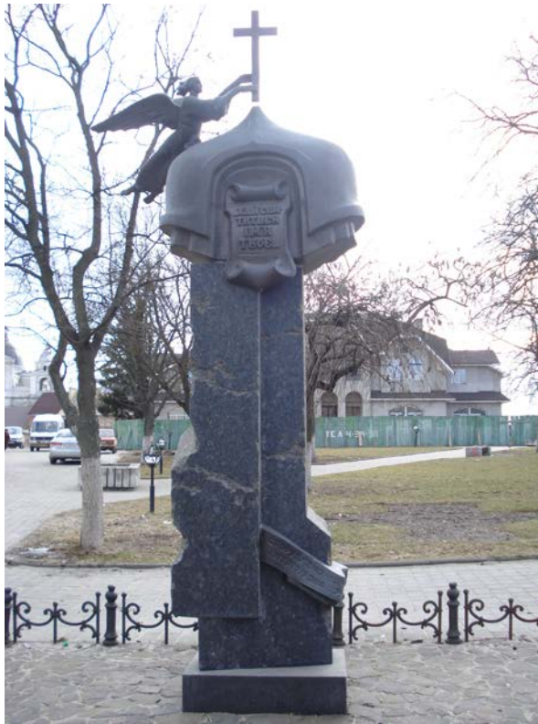
Фото 10. Пам'ятний знак 2000-літтю християнства