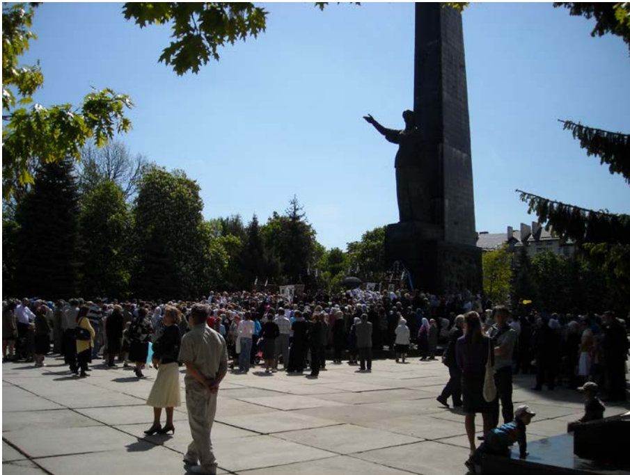
Фото 5. Центральний монумент Меморіалу Вічної Слави