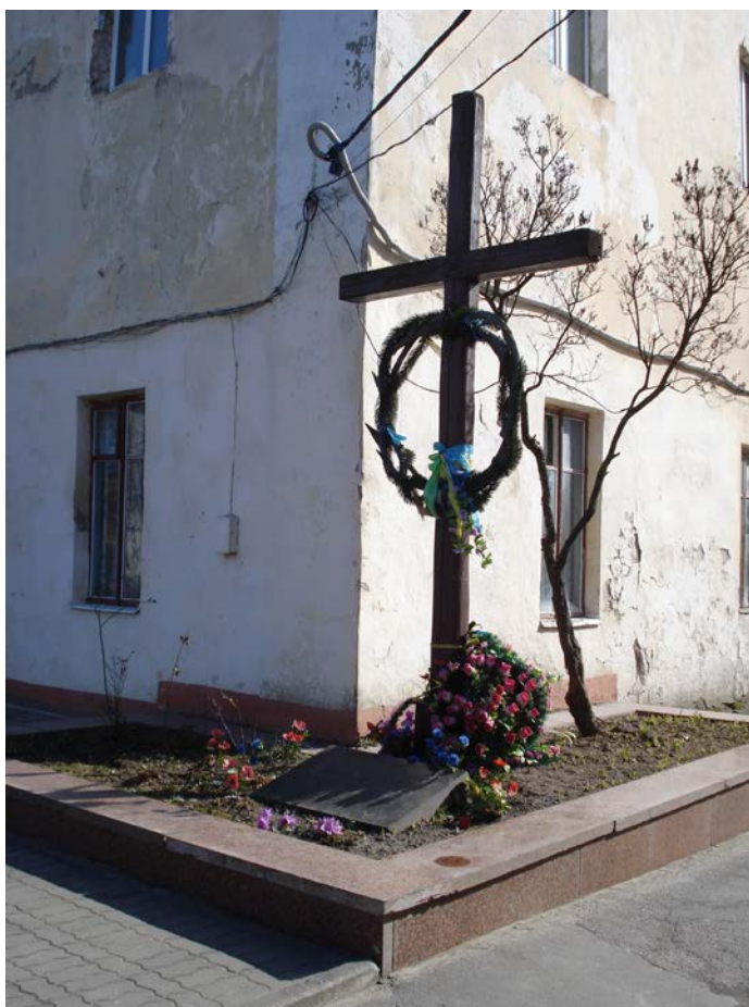
Фото 12. Хрест і плита у пам'ять загиблих в'язнів Луцької в'язниці