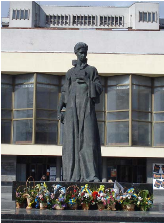
Фото 2. Пам'ятник Лесі Українці на Театральному майдані