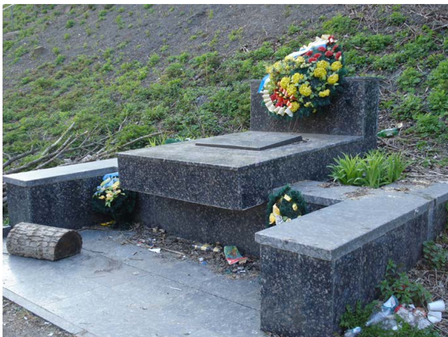
Фото 13. Пам'ятний знак луцьким підпільникам-антифашистам розстріляним 1941 - 1944 р.