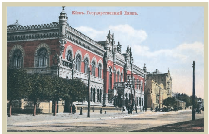
Новозбудована Київська контора Державного банку.