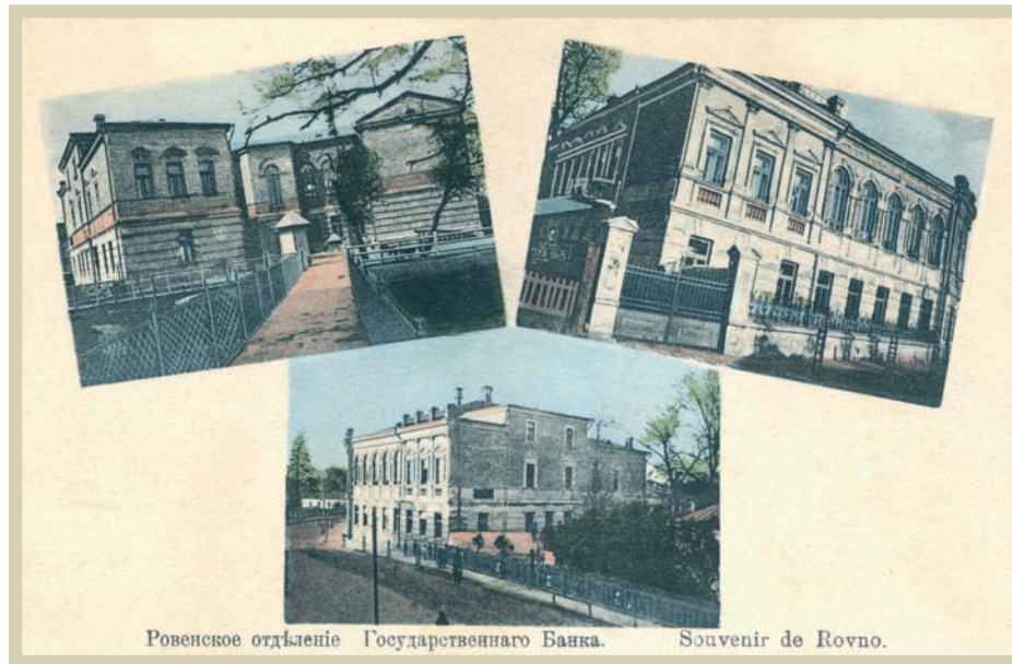
Рівненське відділення Державного банку.

у власній будівлі, зведеній біля в'їзду до нової частини міста, так званого "Нового плану". Один із двох корпусів банку розташовувався практично над каньйоном річки Смотрич; зараз тут, по вулиці Князів Коріатовичів, 1, працює відділення Унікредит-банку. Під час Першої світової війни в Кам'янці-Подільському розміщувався штаб Південно-Західного фронту. 4 серпня 1914 року місто захопили австро-угорські війська, але вже через два дні ворожа армія відступила, повернувши захоплену контрибуцію. Адміністративний центр губернії разом із ключовими структурами був перенесений до Вінниці.