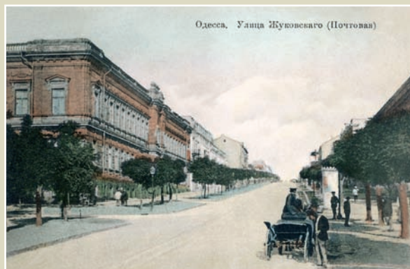
Одеса. Споруда контори Держбанку.