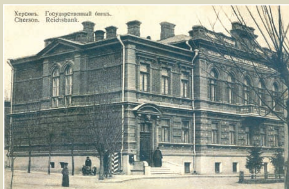
Херсон. Відділення Держбанку.