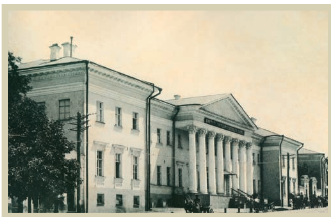
Київська контора Державного банку. 1900 рік.

* Дати в статті подано за старим стилем.