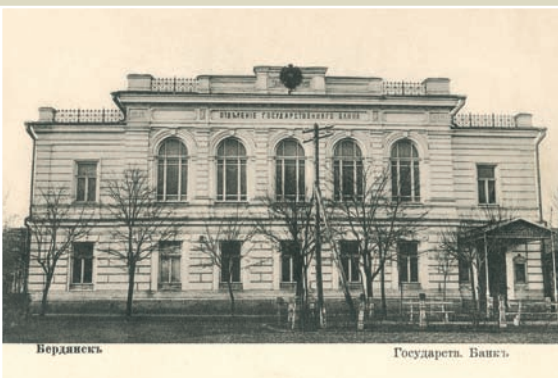
Бердянськ. Будинок відділення Державного банку.