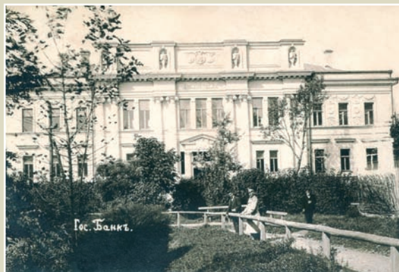
Чернігів. Відділення Державного банку.