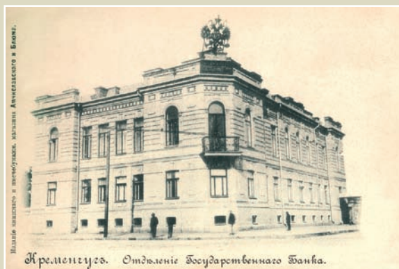
Кременчук. Відділення Державного банку.