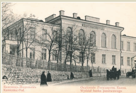
Кам'янець-Подільський. Відділення Державного банку.