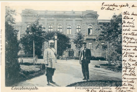
Елисаветград (нині – Кіровоград). Відділення Державного банку.

Одеської контори налічував 154 особи, річний оборот видатку коштів за обліковими та позичковими операціями становив близько 115 млн. рублів. Оскільки фінансова установа стрімко розвивалася, за проектом архітектора В.Ф.Мааса інженером М.А.Лішиним для її потреб було споруджено нове приміщення на розі вулиць Поштової та Польської. Одеське градоначальство хоч і перебувало адміністративно в Херсонській губернії, проте мало практично повну автономію, підпорядковувалося херсонському губернатору лише в питанні відбування населенням військової повинності.