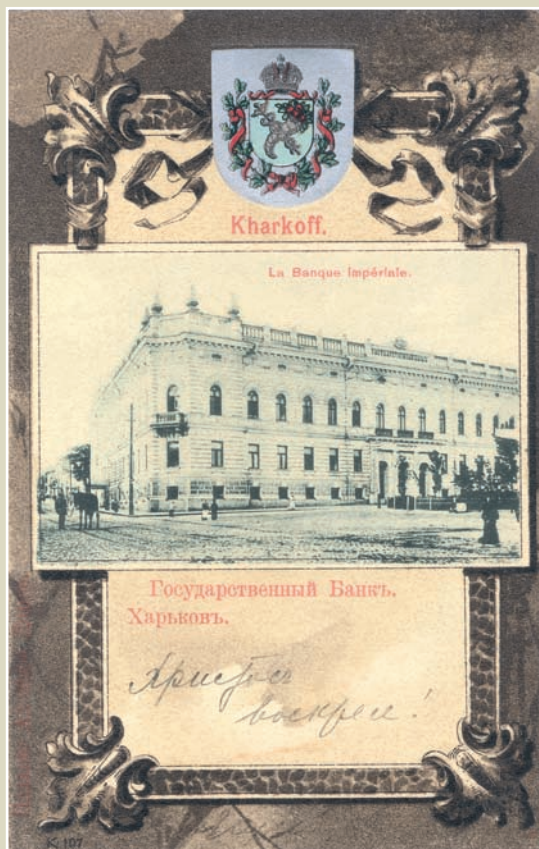
Харків. Первісний вигляд контори Держбанку. 1904 рік.

Одеська контора Держбанку, як і Київська та Харківська, утворена в 1860 році на базі контори Держбанку комерційного банку, що діяв тут із 1819 року. На початку ХХ століття Одеса була четвертим містом імперії за кількістю населення (після Санкт-Петербурга, Москви і Варшави) і найбільшим портовим центром з експорту зернових на півдні країни. У 1914 році особовий склад