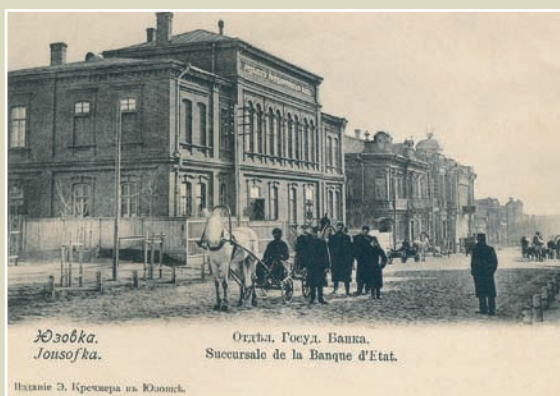
Юзівка (нині – Донецьк). Відділення Державного банку. Фото початку XX століття.