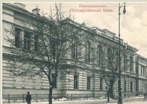
Катеринослав (нині – Дніпропетровськ). Відділення Державного банку.

Кам'янець-Подільське відділення Держбанку було відкрито 23 вересня 1865 року. З 1901-го воно розмішувалося