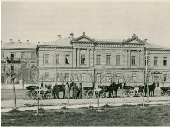
Феодосія. Відділення Державного банку.