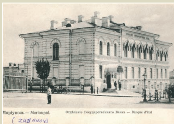
Маріуполь. Відділення Державного банку.