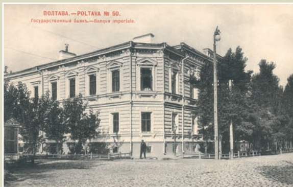
Полтава. Відділення Державного банку. 1902 рік.