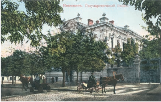
Миколаїв. Відділення Державного банку.