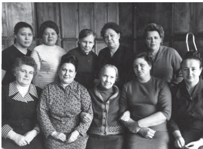
Сотрудники отдела кадров института. 1972 г.