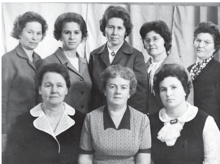
Коллектив библиотеки НЭТИ. Конец 1960-х гг.