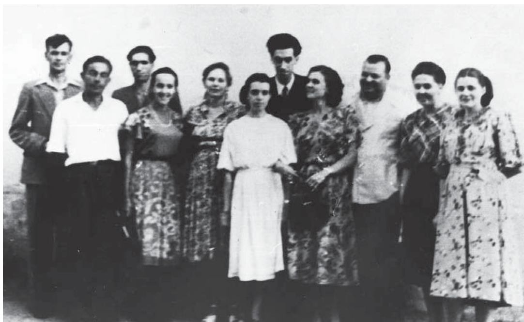
Преподаватели НЭТИ. 1955 г.