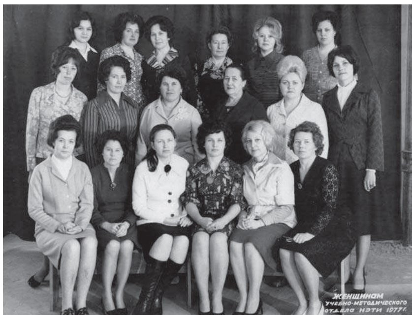
Коллектив учебно-методического отдела НЭТИ. 1977 г.