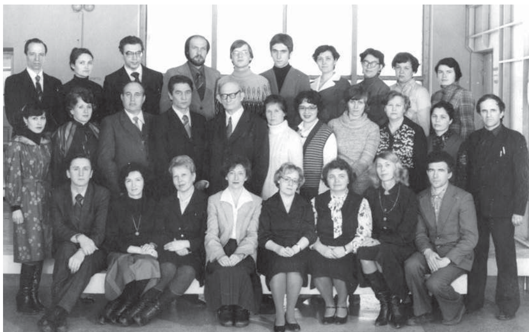
Кафедра высшей математики. 1988 г.