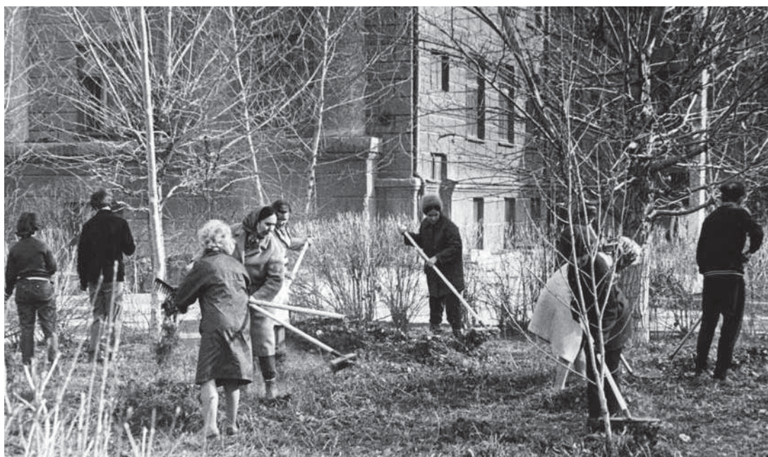
Традиционный ленинский субботник. 1960–1970-е гг.