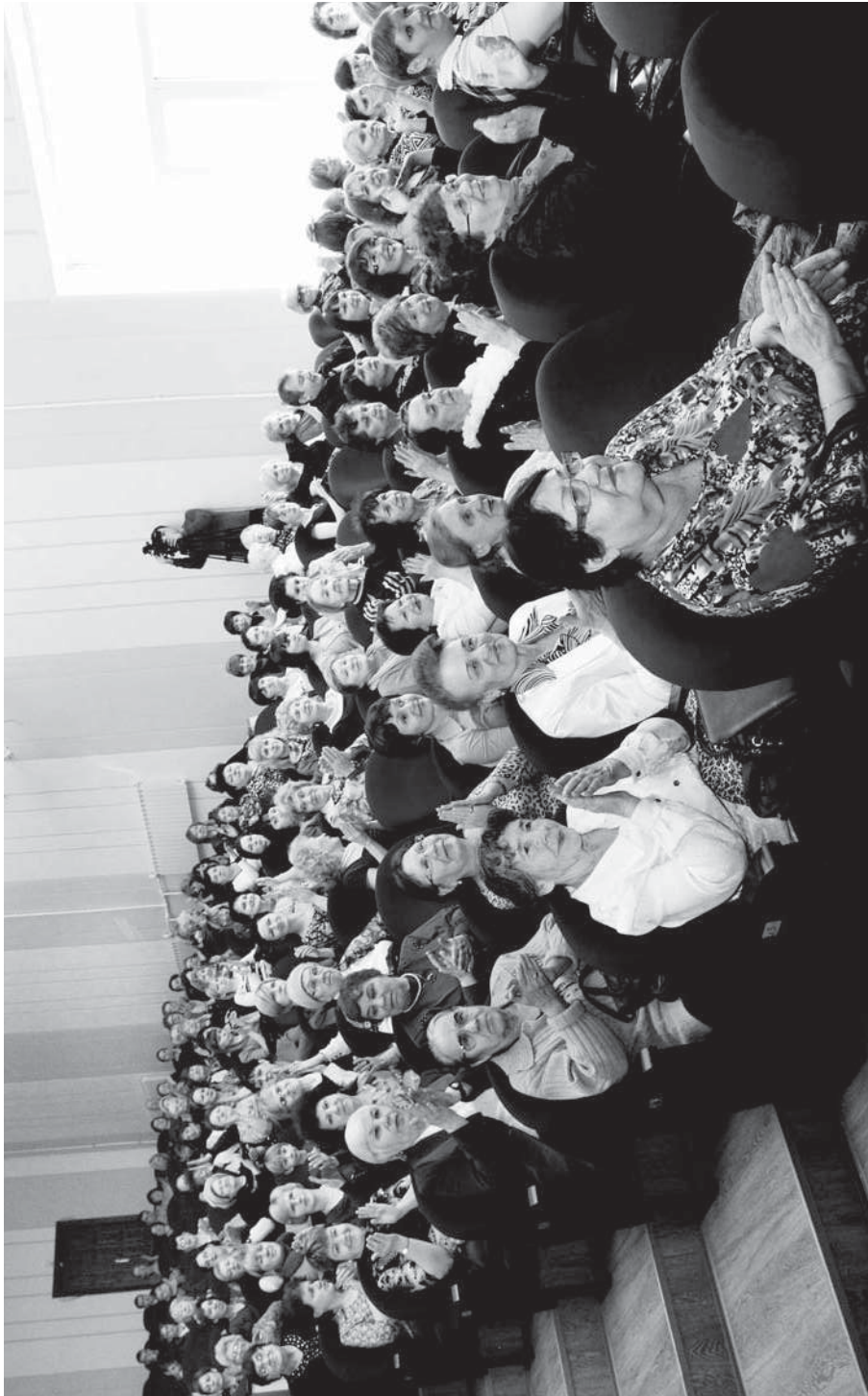
Актовый зал НЭТИ–НГТУ. 8-е марта 2012 г.