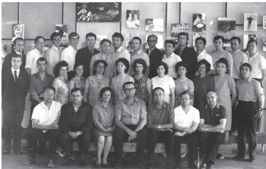
Кафедра электрических машин. 1970-е гг.