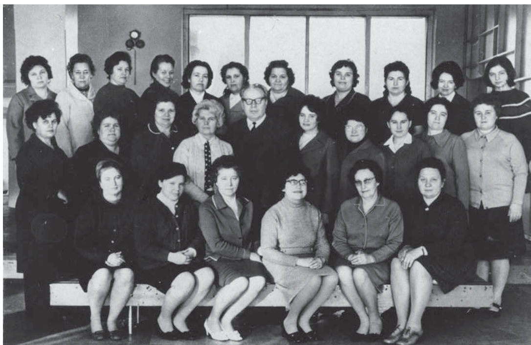
Коллектив бухгалтерии НЭТИ. 1965 г.