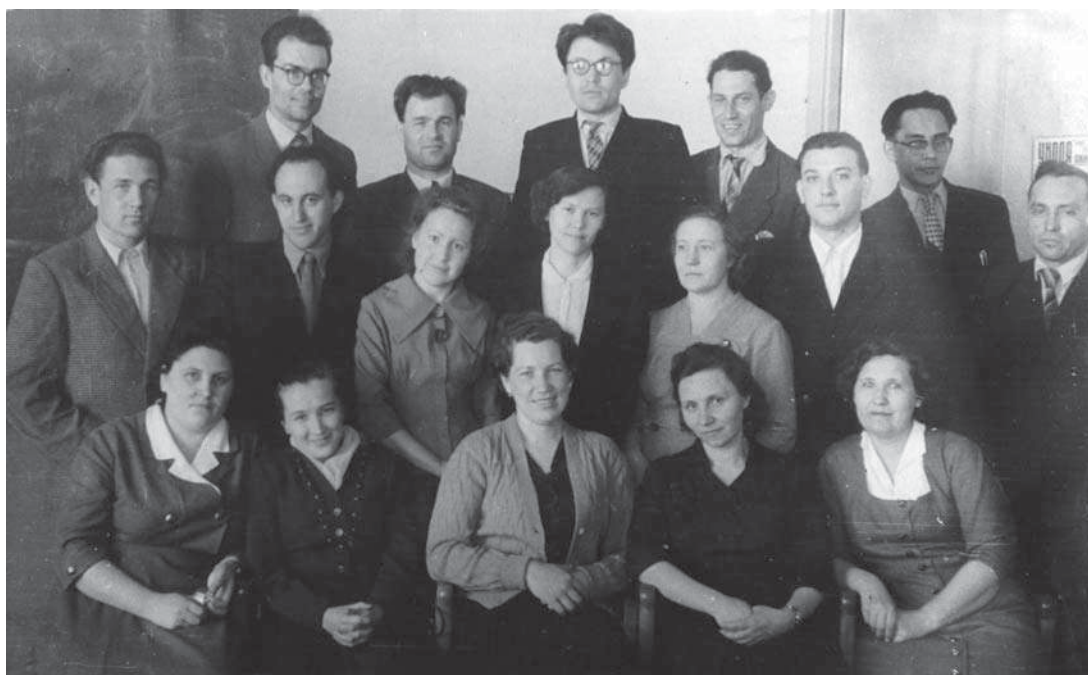
Преподаватели кафедры высшей математики. 1960 г.