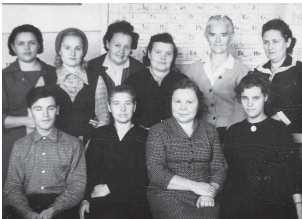
Кафедра химии. 1969–1970 гг.