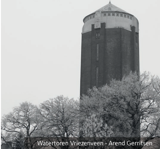
Watertoren Vriezenveen - Arend Gerritsen