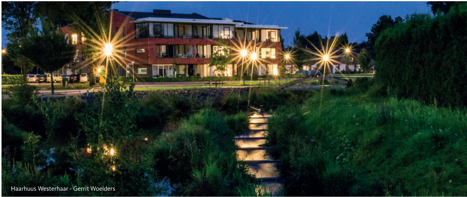
Haarhuus Westerhaar - Gerrit Woelders