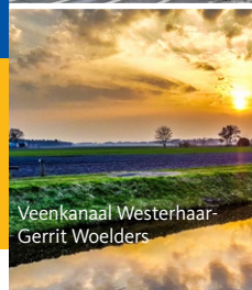
Veenkanaal Westerhaar Gerrit Woelders