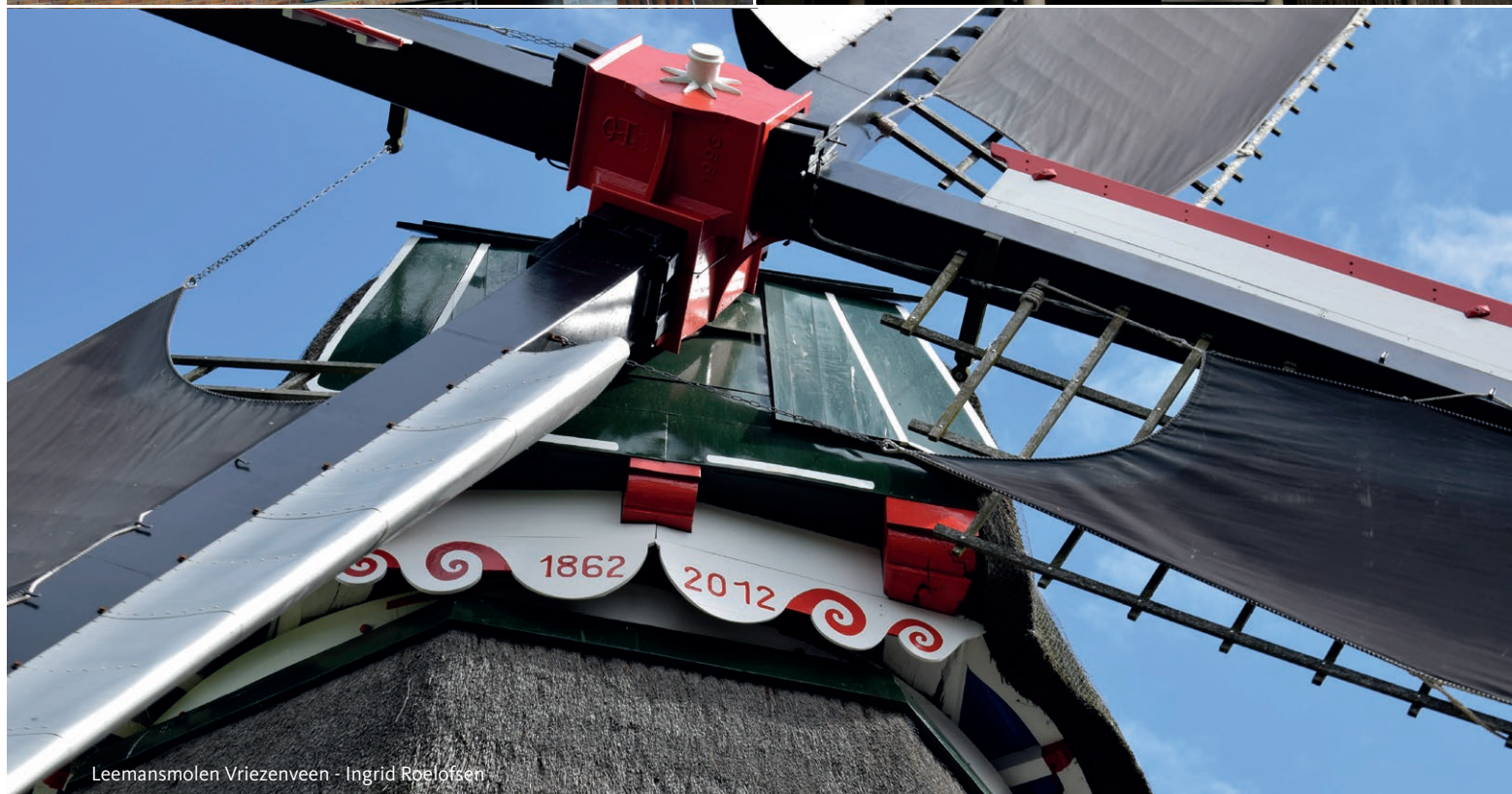
Leemansmolen Vriezenveen