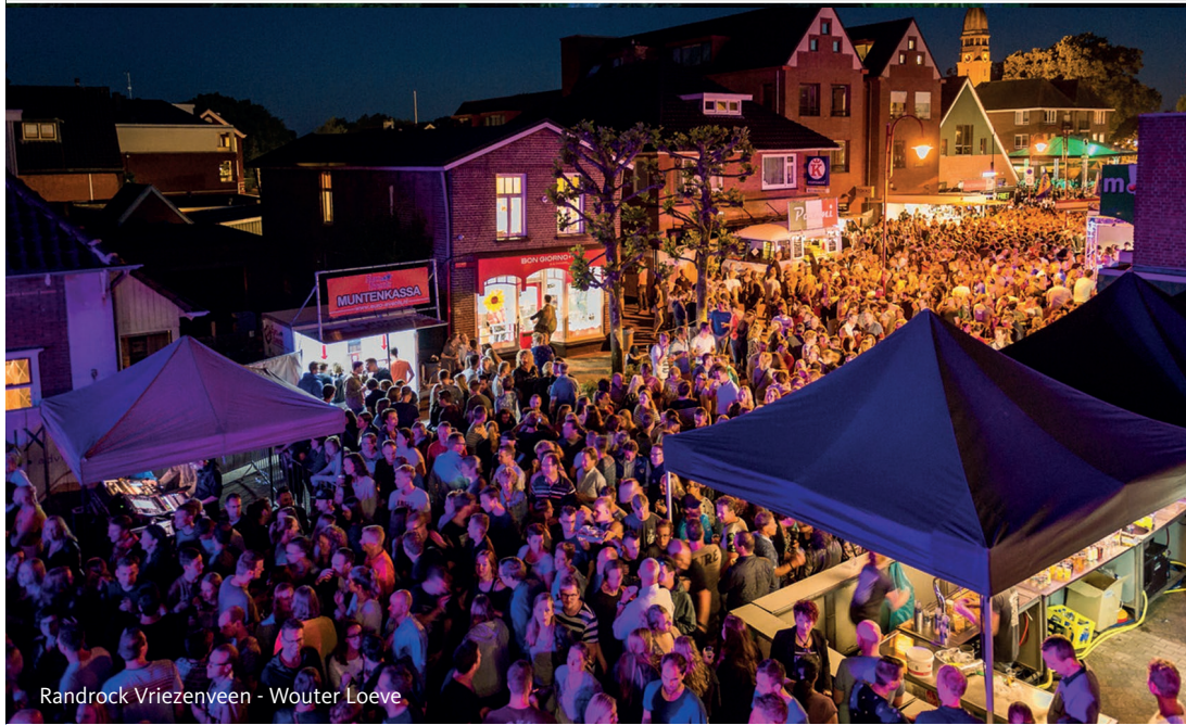
Randrock Vriezenveen - Wouter Loeve