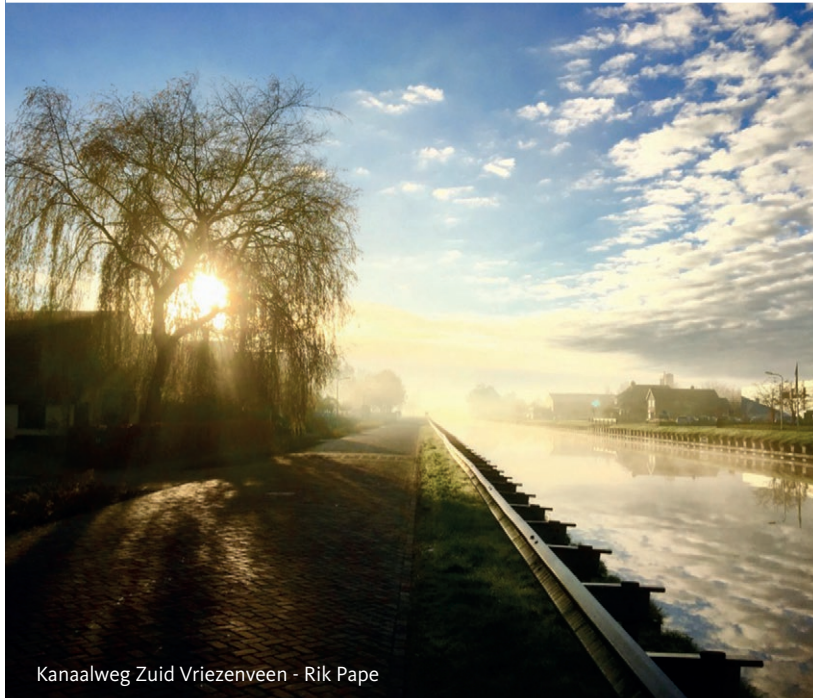
Kanaalweg Zuid Vriezenveen - Rik Pape