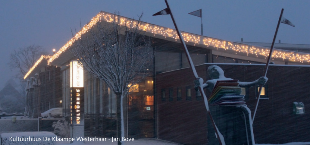
Kultuurhuis De Klaampe Westerhaar - Jan Bove