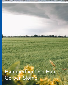
Hammerflter Den Ham Gerben Slomp