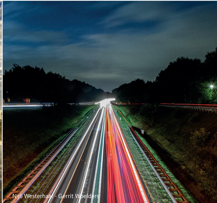
N36 Westerhaar - Gerrit Woelders