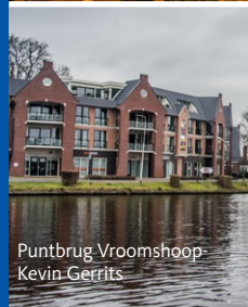
Puntbrug Vroomshoop Kevin Gerrits