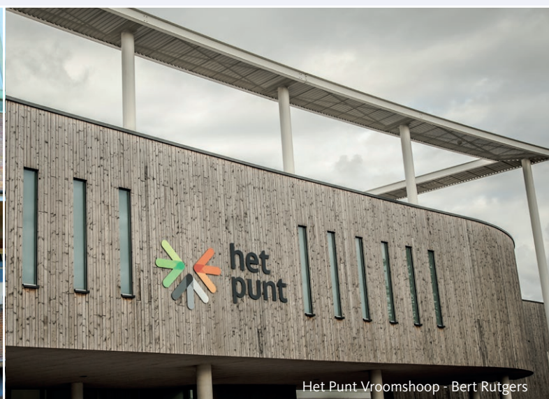
Het Punt Vroomshoop - Bert Rutgers