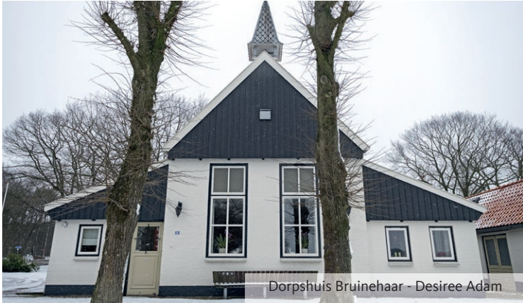
Dorpshuis Bruinehaar