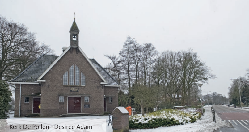
Kerk De Pollen