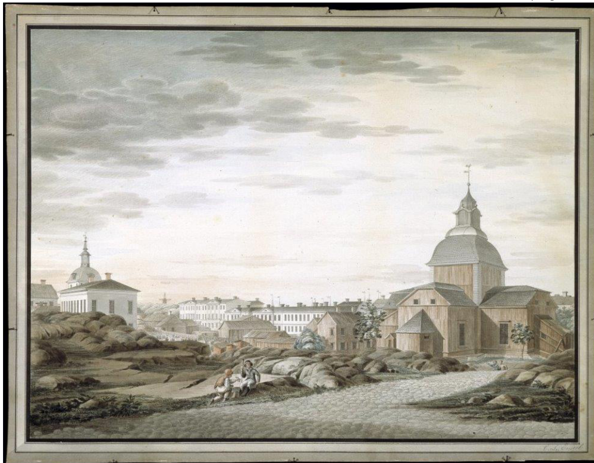
Kuva 1. C. L. Engelin maalauksessa etualalla Ulrika Eleonoran kirkko. Taustalla nykyisen Aleksanterinkadun varrella sijaitsevia rakennuksia.