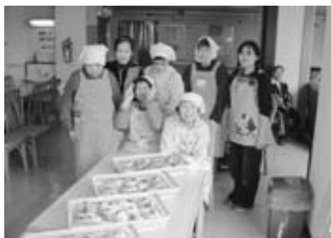
▲おいしそう…。焼きたてパンに大満足!!

利用者は、毎月2回、講師の方の指導のもと、おぼつかない手つきながらも真剣に、時にはおしゃべりに興じながらパン作りに励んでいます。プロプロの固まりがフワフワのパンに焼き上がり、アツアツのパンを頬ばる。好き嫌いのある方でも、このパンに関しては、「おいしい」の一言です。 ボランティアで来ていただいている講師の方にはパンづくりだけではなく、利用者の話し相手にもなっていたり、この時間は本当に楽しそう、活気あふれる姿を見るたび感謝の気持ちでいっぱいです。