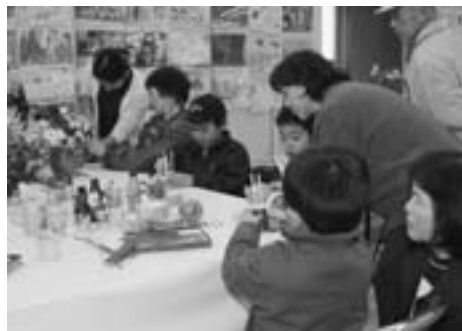
▲新たに設けた体験コーナーは大人気!!

仕上げた作品をズラリと展示し、その作品の完成度の高さに、訪れた人々はすっかり目を奪われていました。一方、開発センターでは、各クラブによる芸能発表が行われ、毎週1～2回の練習の成果を、舞台上に立って披露しました。