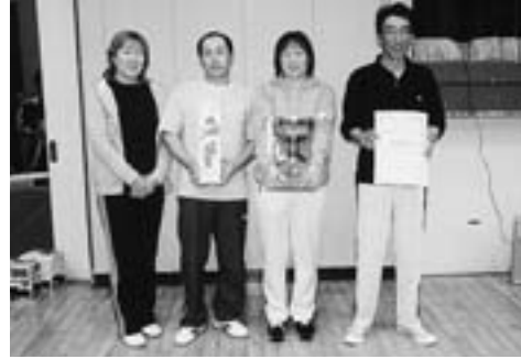
▲私たち、Aクラスで優勝しちゃいました…

10月5日(火)～19日(火)、平成16年度町民ナイター卓球リーグ戦が行われました。