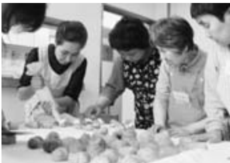
▲「こうやってしほるのよ」とアドバイスが...

これまでは、利用者の希望から出張販売に来てくれるパン屋さんから購入していましたが、「こんなに食べたいのであれば、自分たちの手でつくった焼きたてのパンを食べさせてあげたい」と思っていたところ、町民の方を講師に、活動を実現することができました。