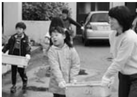
▲重いプランターも、なんのその!

10月27日(水)、地域子ども教室図書館(愛称ぶつくるんセンター)では、プランターの片づけを行いました。ぶつくるんセンターをきれいにしようとして、6月にみんなで植えた花が枯れたので、花を抜き、プランターを運び出しました。みんなで協力して作業をしたり、図書館前の階段や広場を進んで掃いたり、子どもたちはたくましく成長しました。