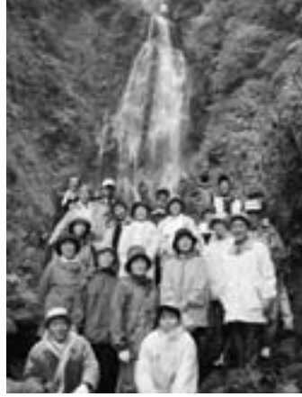
▲くろくまの滝まで歩きました!!

両日とも、あいにく小雨混じりの天気でしたが、参加者は、赤石川溪流美河原からくろくまの滝までの約4kmを歩きました。