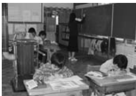
▲みんな授業に集中して、お勉強しています