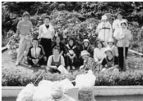
▲いい汗流した清掃活動を終えて…

午前9時、部員18名がJR小湊駅に集合し、清掃活動を実施しました。テーマを「環境美化」とした今回の活動では、本町・元町・川原町の商店街中心地区の清掃作業に加え、JR小湊駅の花壇の除草・育成作業を行いました。快晴の秋空の下、流れる汗をタオルでふきながらも、地