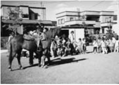
▲お馬さんは、とっても優しい目や表情でした