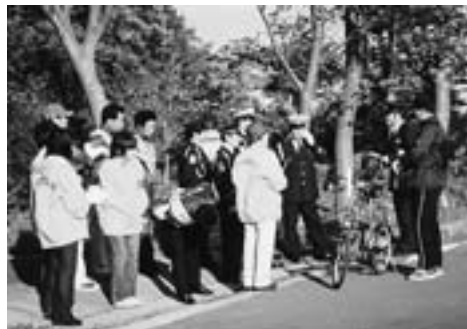
▲訓練とはいえ、緊張に包まれていました

平内地区防犯協会、防犯指導隊、更生保護女性部では、10月15日(金)に平内幹部交番と連携して、秋の全国地域安全運動の一環として合同防犯訓練を平内町営グラウンド周辺において行いました。