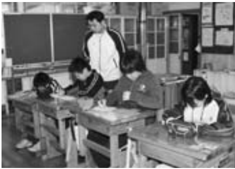
▲慣れ親しんだこの教室ともお別れです…

□昭和47年9月14日、第19回平内町小学校野球大会で初優勝を飾り、稲生町内をパレードする。 □平成5年2月11日、第31回平内町民スキー大会のアルペン競技2部で10年連続優勝を飾る。 □平成16年、児童数は8名で、複式2学級。