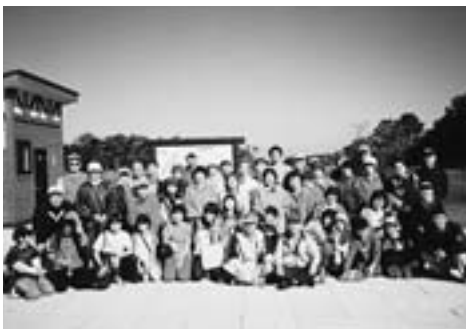
▲天気にも恵まれ、満足のいく大会でした