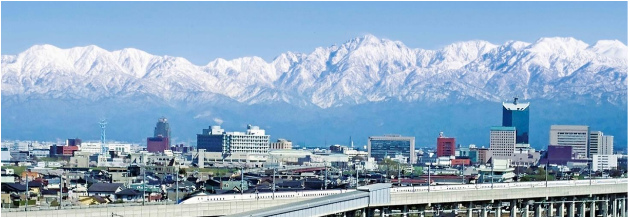
12階コンセプトフロア「富山」から見る立山連峰 ※イメージ