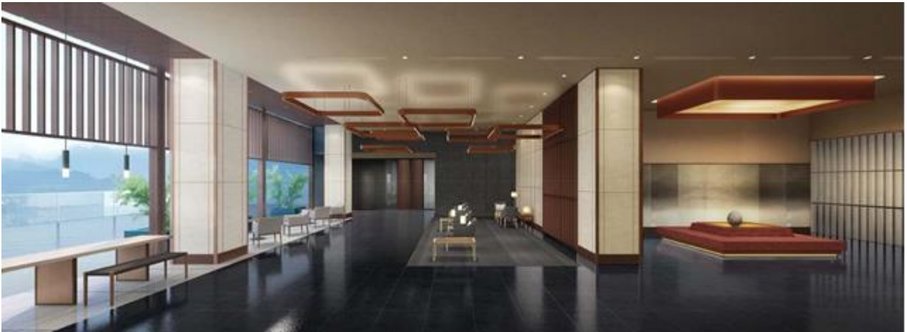
5階ホテルエントランス（フロント・ロビー） ※CGパース

5階エントランスは、立山連峰が望める開放的な空間となります。内装空間は富山の伝統を現代的な手法でアレンジし、デザインしました。ロビーには、たらしこみ技法を用いた和紙、フロントには布着せ技法を用いたカウンター等を施し、富山を感じさせるホテルエントランスを演出します。