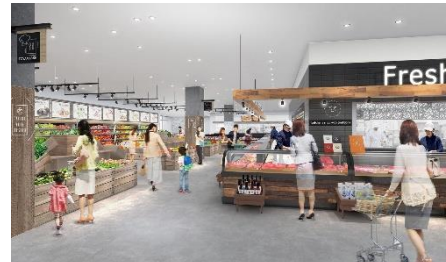
スーパーマーケットエリアのイメージ

MAROOT に出店するショップ情報については、12 月 8 日開設(予定)の告知サイトにて発信いたします。開業に関する情報、イベント情報の他、MAROOT だからこそ提供できる価値を盛り込んだ、独自性や強みにフォーカスしたオリジナル情報を随時発信してまいります。