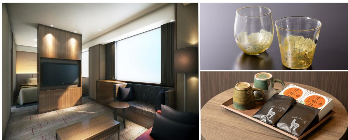
左：プレミアムツイン（※CG パース） 右上：富山ガラス 右下：三助焼き、アルパカコーヒー、甘金丹

最上階（12階）のコンセプトフロア富山は、6～11階までの客室より天井高を30cm高く設定した280cmの開放感あふれる空間となります。また、フロア名称となる富山の観光名所である立山連峰をデザインした絨毯やフロアオリジナルの壁面デザインに加え、眠りのおもてなしとして、フロアオリジナルのシモンズ社製7.5インチのマットレスを設置。その他、富山にちなんだ三助焼きのコーヒーカップ、地産のアルパカコーヒー、銘菓「甘金丹」、立山連峰をデザインした富山ガラスのグラス、和紙の客室備品など、地域とお客様をつなぐホテルヴィスキオ富山ならではのおもてなしを提供します。