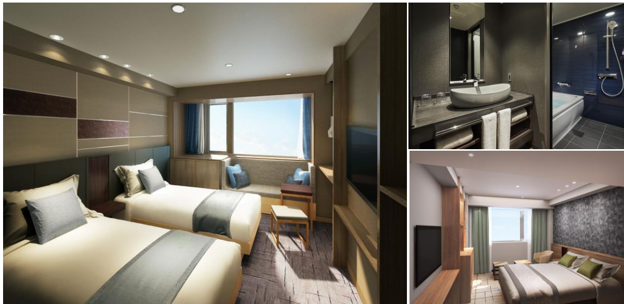
左：スーパーアツイン（ベッドルーム） 右上：スーパーアツイン（バスルーム） 右下：スタンダードダブル（ベッドルーム） ※CG パース

心地よく、スマートな滞在を提供する客室は、2名以上で利用するダブル・ツインタイプを主として、17.7㎡～39.5㎡の広さに設定しました。加えて一部の部屋タイプには、ゆったりと寛げるベンチシートや、要望の高い独立型の浴室と個室トイレも設置し、様々なライフスタイルやニーズに合わせた多彩なルームバリエーションを展開。全9タイプの客室は、全室窓を完備し、東側の客室からは立山連峰が、西側の客室からは神通川が望めます。