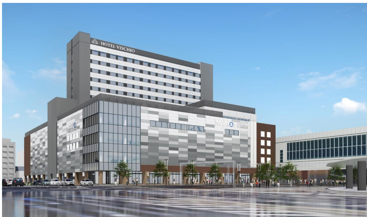
「JR 富山駅ビル」全景と「ホテルヴィスキオ富山 by GRANVIA」の外観 ※CG パース

「ホテルヴィスキオ富山 by GRANVIA」は、J R 西日本ホテルズの宿泊主体型ホテル「ヴィスキオ」ブランドとして、大阪、尼崎、京都に続く 4 号店となります。富山を訪れる人々の玄関口として、交通至便な富山駅南口の南西街区に同日開業予定の複合商業施設「J R 富山駅ビル」の上層階（4 階一部及び 5 階～12 階）にランドマークホテルとして開業し、J R 西日本ホテルズのフラッグシップブランドである「グランヴィア」品質の上質な施設と設備をシンプルサービスで提供します。