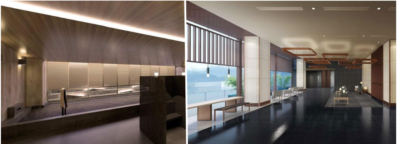
左：5 階大浴場 右：5 階エントランス（※CG パース）

今回新たな取り組みとして、北陸エリア初出店となる富山にちなんだ“コンセプトフロア「富山」”を最上階（12 階）に配し、全 182 室の客室と大浴場を備え、国内外のレジャー層やビジネスユーザーにご利用いただけます。