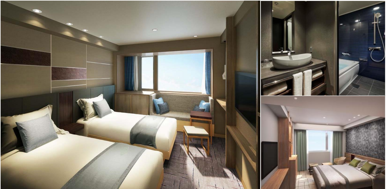
左：スーパーアツイン（ベッドルーム） 右上：スーパーアツイン（バスルーム） 右下：スタンダードダブル（ベッドルーム） ※CG パース

心地よく、スマートな滞在を提供する客室は、2名以上で利用するダブル・ツインタイプを主として、17.7㎡～39.5㎡の広さに設定しました。加えて一部の部屋タイプには、ゆったりと寛げるベンチシートや、要望の高い独立型の浴室と個室トイレも設置し、様々なライフスタイルやニーズに合わせた多彩なルームバリエーションを展開。全9タイプの客室は、全室窓を完備し、東側の客室からは立山連峰が、西側の客室からは神通川が望めます。