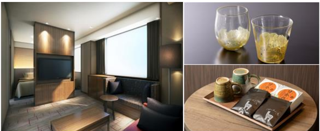
左：プレミアムツイン（※CG パース） 右上：富山ガラス 右下：三助焼き、アルパカコーヒー、甘金丹

最上階（12階）のコンセプトフロア富山は、6～11階までの客室より天井高を30cm高く設定した280cmの開放感あふれる空間となります。また、フロア名称となる富山の観光名所である立山連峰をデザインした絨毯やフロアオリジナルの壁面デザインに加え、眠りのおもてなしとして、フロアオリジナルのシモンズ社製7.5インチのマットレスを設置。その他、富山にちなんだ三助焼きのコーヒーカップ、地産のアルパカコーヒー、銘菓「甘金丹」、立山連峰をデザインした富山ガラスのグラス、和紙の客室備品など、地域とお客様をつなぐ「ホテルヴィスキオ富山 by GRANVIA」ならではのおもてなしを提供します。