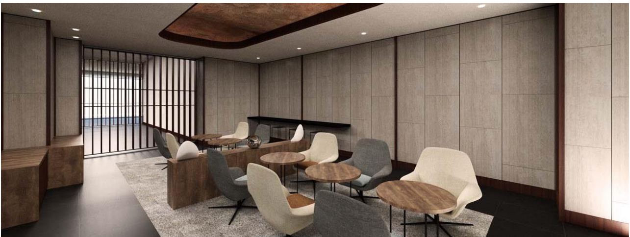
宿泊ゲスト専用ラウンジ ※CGイメージ

5階宿泊ゲスト専用ラウンジは、アクセントウォールとして雪が降る風景を見立てた雲母（キラ）刷りの和紙を用い、落ち着いた空間デザインに仕上げました。また、観光情報やパソコン、プリンター、無料ドリンクに加え、客室内同様に無料でWi-Fiを利用できる快適なインターネット環境を整え、レジャーやビジネスなどの快適な旅をサポートします。