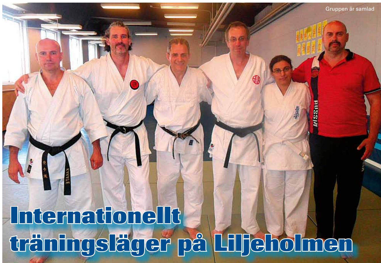
Gruppen är samlad