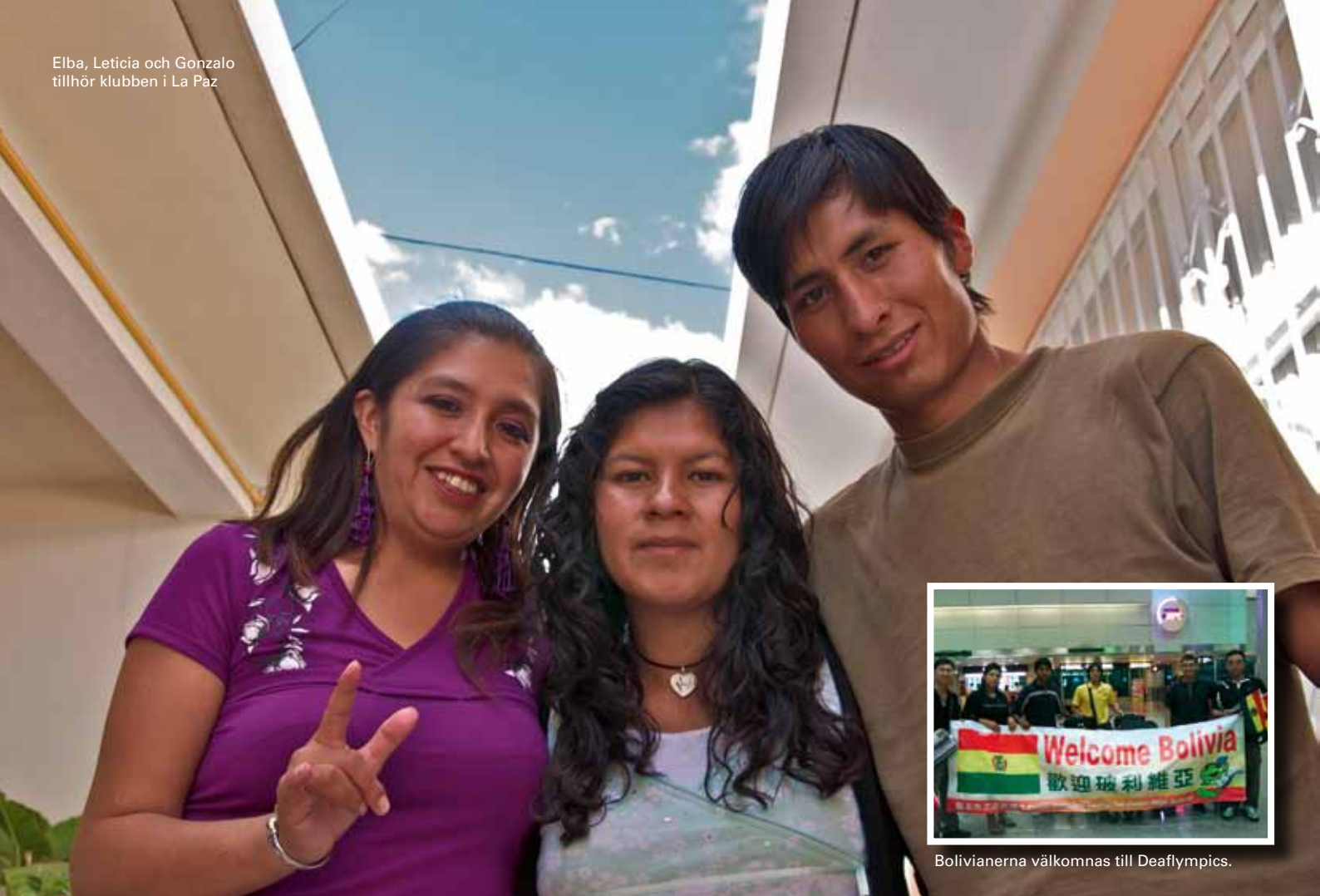
Bolivianerna välkomnas till Deaflympics.