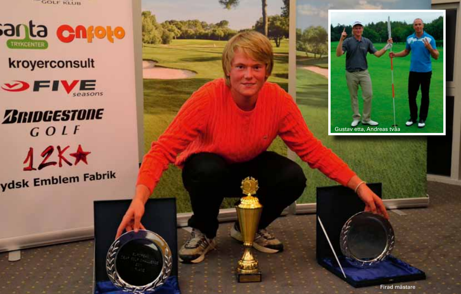
Gustav etta, Andreas tvåa