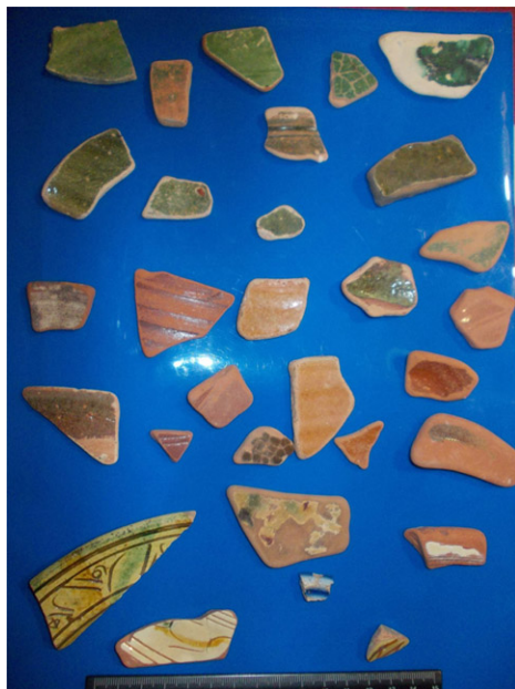
Рис.1. Керамика Хаджибеевой тьмы