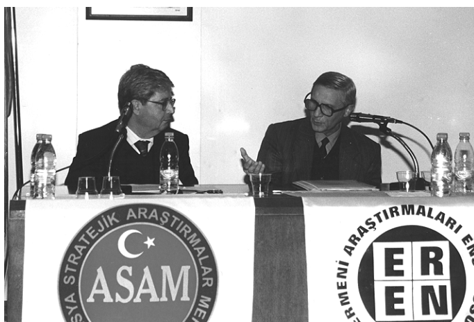
Во время выступления на “Конгрессе по Армянскому Вопросу”. Тема: “Место “Армянского Вопроса” в политике империй: причины и следствия”. г. Анкара. 21 апреля 2002 г.

Цицианов обещал помогать Ибрагим хану в его стремлениях в области наследства. И весной 1804 года, наконец, Ибрагим хан официально сообщил о своем подчинении России, о своем желании укрыться под ветвями могучего дуба Российского самодержавия, и