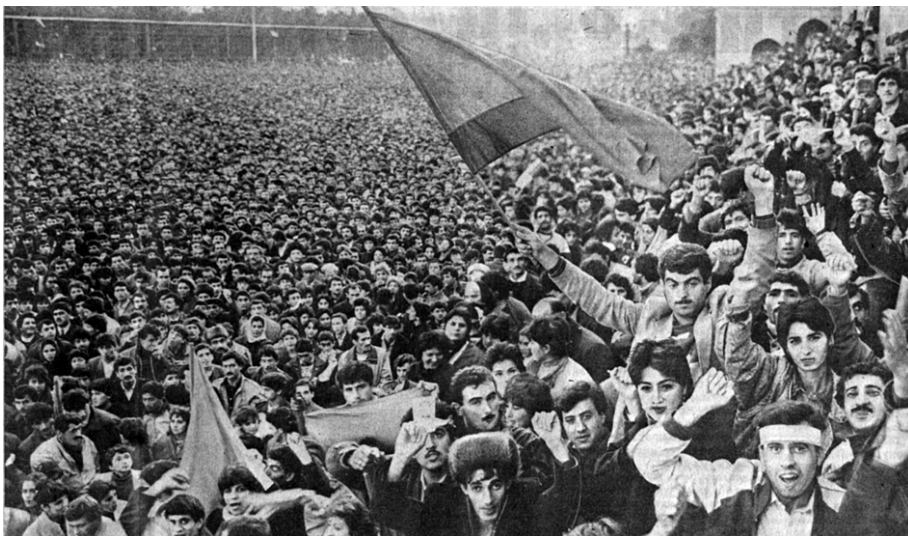
г. Баку. Площадь им. Ленина (ныне Площадь Свободы). 22 ноября 1988 г.

рублей, так щедро отпущенных Советом Министров СССР для решения “социально-экономических задач” в Нагорном Карабахе; вторых, нагадить на святом для нас месте, месте историческом, объявленном государственным заповедником – так называемой “Топхане” (лесной массив) – под предлогом стройки, для того чтобы плюнуть в душу азербайджанского народа; и, наконец, выкурить