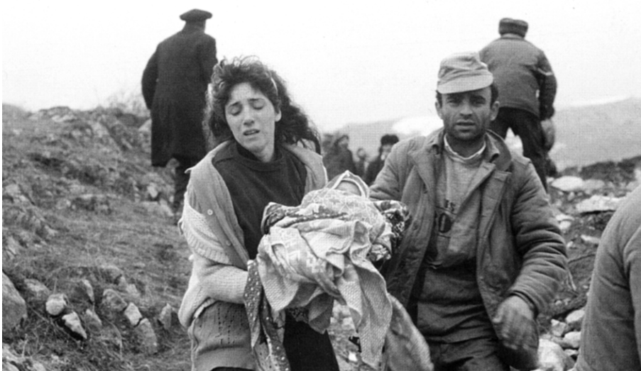
Беженцы на своей земле.

К этому следует добавить, что там теперь практически не осталось азербайджанского населения. А войсковые подразделения были введены в эти районы лишь после того как последние азербайджанцы были выгнаны оттуда голыми, с пустыми руками и кар-