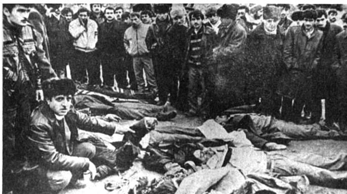
Утро “Черного Января”. Баку. 20 января 1990 г.

руженные силы во главе самых высокопоставленных военных и государственных чиновников (Горбачев, Язов, Крючков, Бакатин и пр.) устроили настоящую резню, а потом в течение почти месяца настоящий узаконенный террор. Первым терактом, между прочим,