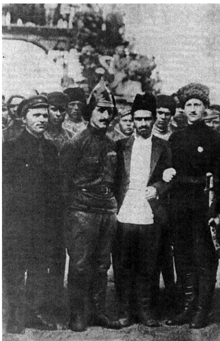
С. Киров, С. Орджоникидзе, А. Микоян, М. Ефремов на вокзале "освобожденного" Баку. 1920 г.

Ну, что потом? Потом мы сумели убедить медленно, с трудом и остальных. И восстановили свою государственность объявленную 28-го мая 1918 года (после крушения царской империи) и уничтоженную 28-го апреля 1920 года "доблестной" XI Красной Армией (впрочем и тогда шла армяно-азербайджанская война и тем самым создавалась почва для вмешательства так называемых старших братьев). Нас признали уже около 80 государств мира. Мы мало-помалу возвращаемся к истокам, чтобы нащупать, найти и