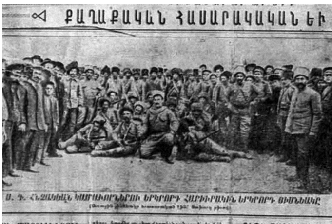
Вторая рота Армянского Гнчакского Добровольного Полка. Газета “Йеридасарет Хайастан” (“Молодая Армения”). 20 июля 1915 г.

“У них все построено на раздувании фактов. Вся их деятельность основана на создании небылиц, которые могли бы вызвать